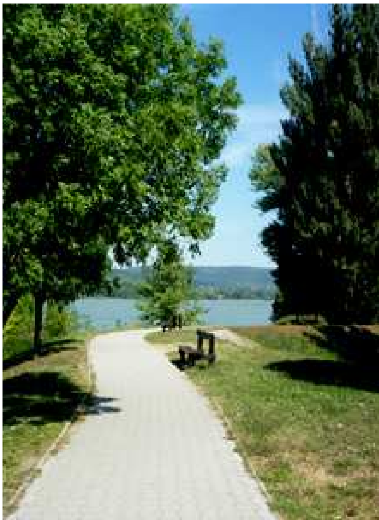
Visegrád, Duna-part