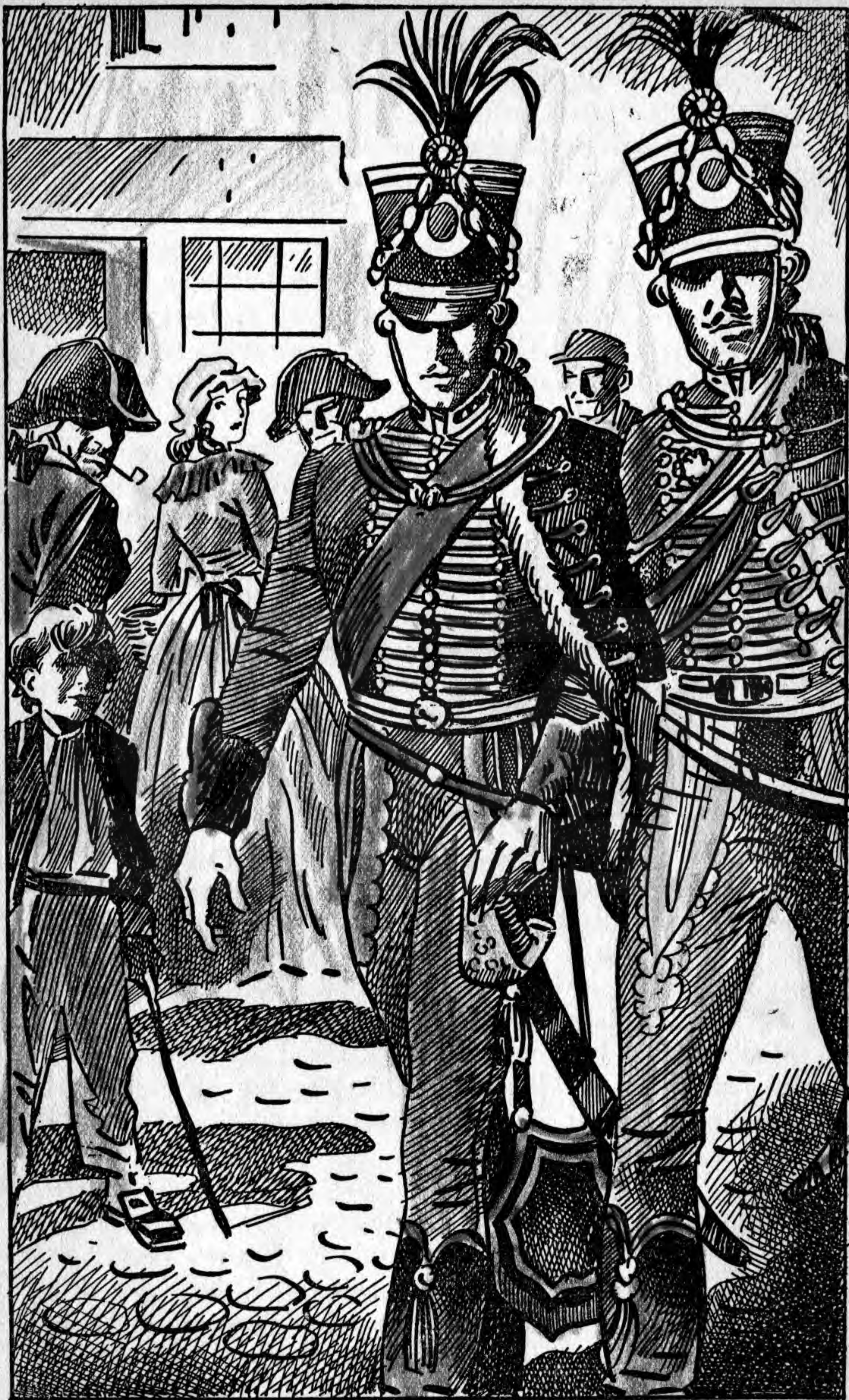
Sokan utánanéztek a két daliás alaknak . . .