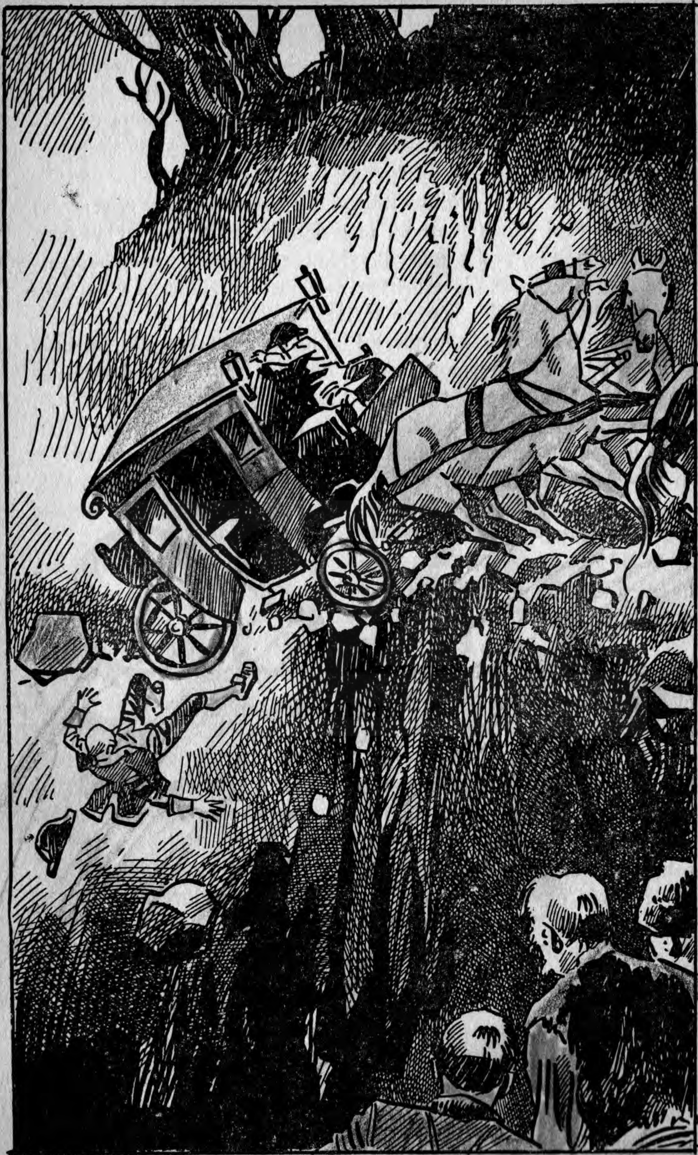
A hintó rémséges robajjal alázuhant.