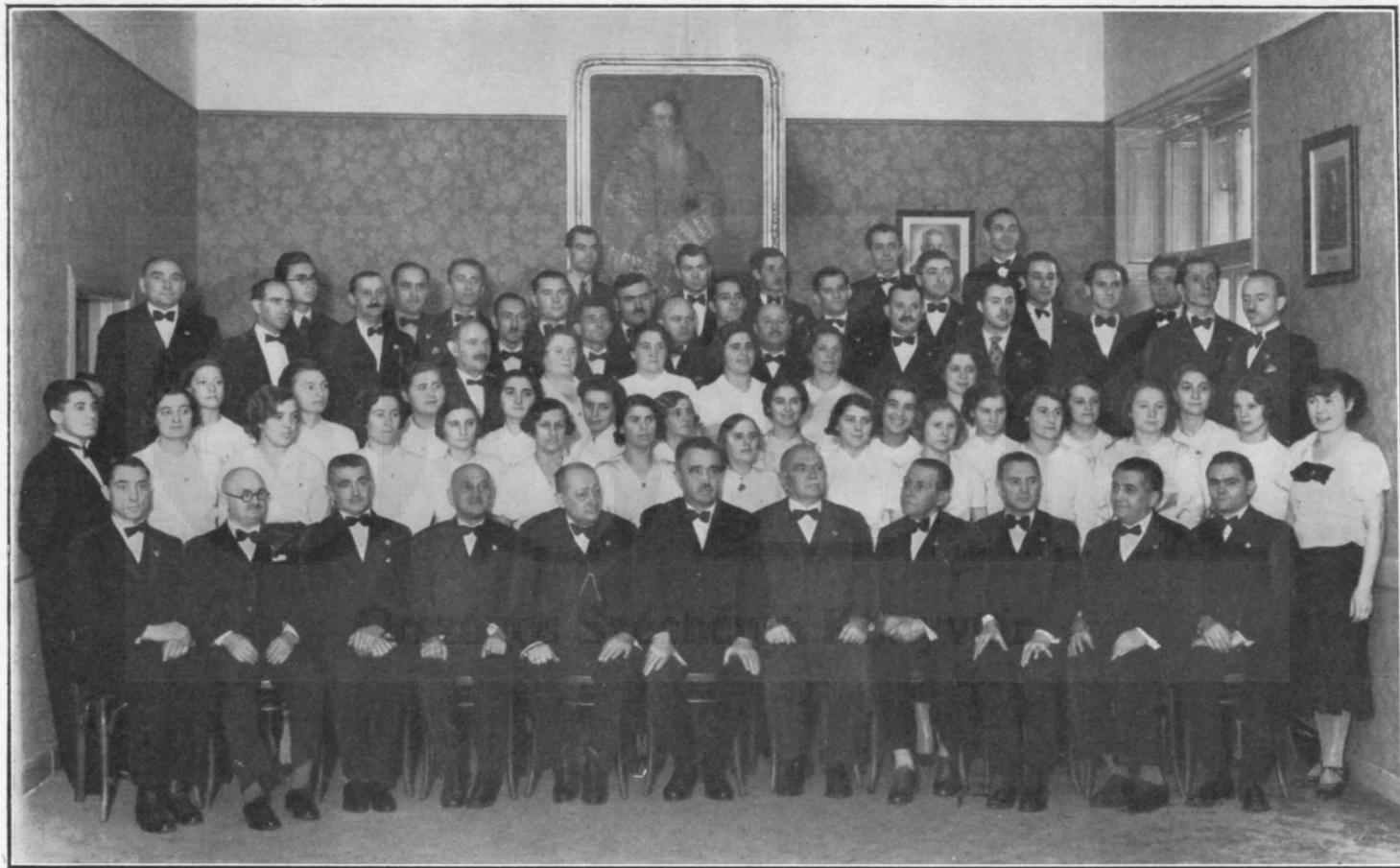
A Budapesti Könyvnyomdászok Dalköre működő tagjainak csoportképe.