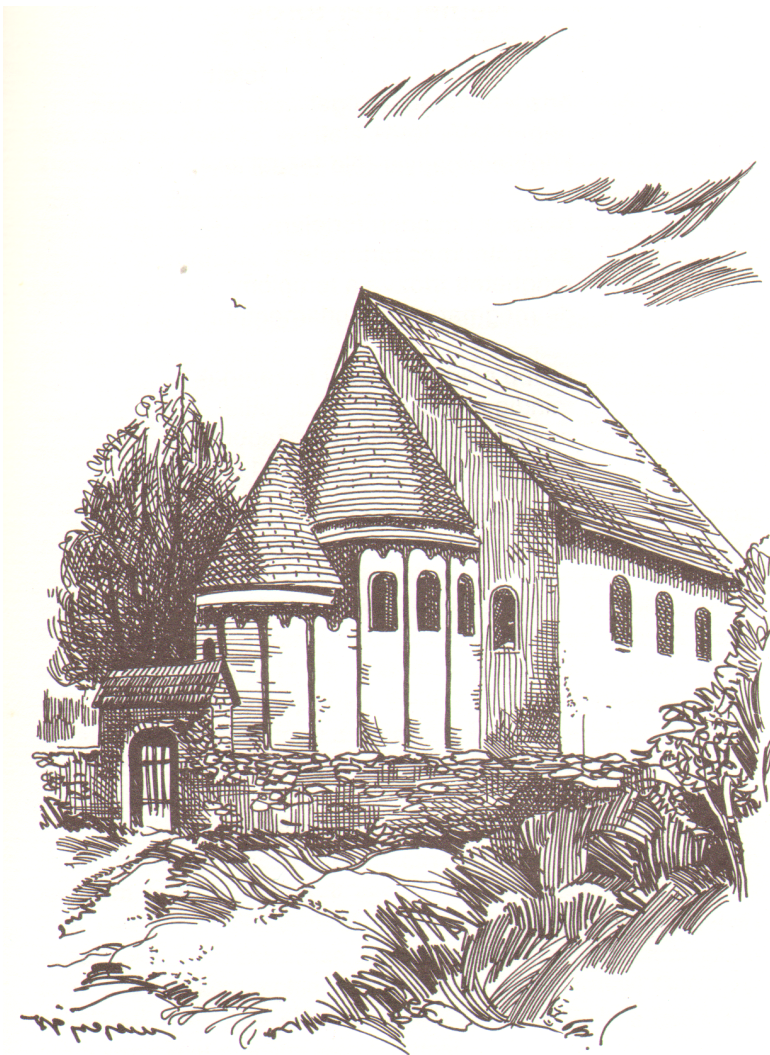
A szalonnai református templom XI. és XIII. század