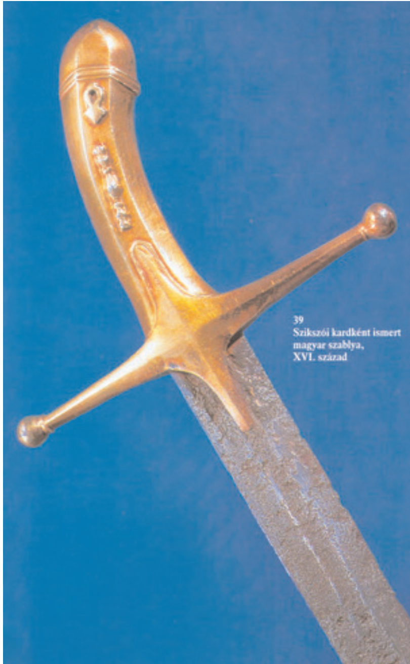
39 Szikszói kardként ismert magyar szablya, XVI. század