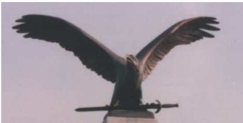
A turul madár a Hósi emlékművön. Stremeny Géza szobrászművész alkotása.