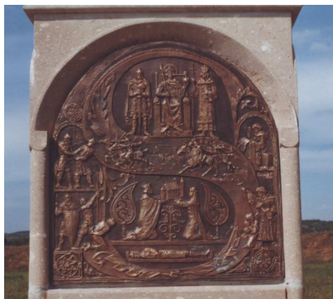
A szobor talapzatán lévő dombormű.