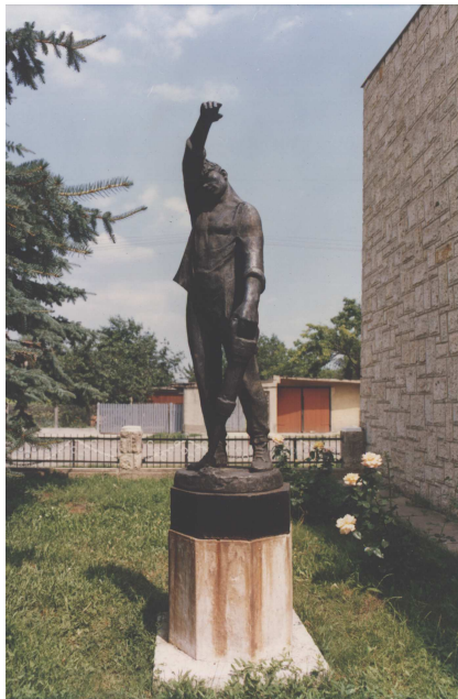
A szobor az eredeti talapzaton