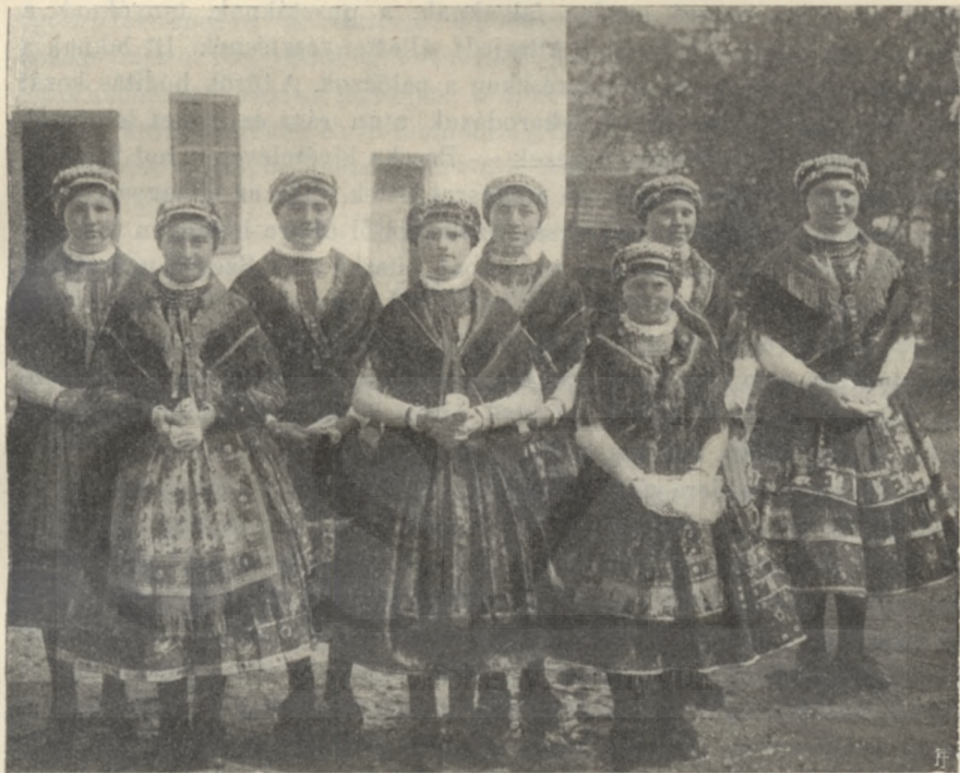
PÁRTÁS LEÁNYOK. (Váralja, Tolnamegye.)

kezére kerül. Főntebb mondtuk, hogy igaz magyar típusokat nagy tömegben Somogyban és a Kapos mentén találunk; de elszórtan, különösen a számos nemes községekben, mindenütt. Érdekes, hogy a fehér gyászviselet is fenmaradt Somogyban Csököly táján. Valamelyes népviseletet