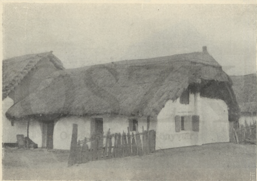
ÁGASFÁS, ÜSTÖKÖS, SÖVENYFALÚ HÁZ.

égerfa vesszejét igen különböző fonásokra használják nálunk — kosarakra, ládákra, cserényfalakra, ajtókra, kapukra, füstfogókra, kályhákra stb. — s minden bizonynyal házfalak fonására is régóta alkalmazták, a mire följegyzések is mutatnak. Dunántúl még a XVIII. században is voltak sövényfalú református templomok, az erdélyi szászoknál pedig a XVI. századból említenek ilyen papi házakat. A sövényfalú ház úgy készül, hogy az építendő falak helyére karókat vernek, e karók közeit vesszővel átgúzsolják, s az így előállott fonadékot kívül-belül sárral megtapasztják és csak azután vágnak bele nyílásokat ajtónak, ablaknak. Ezek