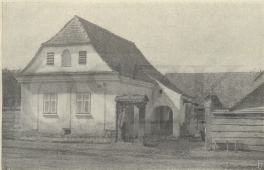
SZÁSZ HÁZ. (N.-KÜLKÜLLŐ M.)

Vályog- és téglaeépítkezés természetesen ott van általánosan elterjedve, a hol arra alkalmas nyersanyag van. A vályog a szegényebbek, a tégl a módosabbak házához való; de ma már ez az utóbbi mindenfelé erősen terjed. Leggyakoribb a németeknél és pedig az erdélyi szászok jó részénél; az északmagyarországiaknál inkább csak a városokban; a dunántúli és délmagyarországi sváboknál, valamint az ottani többi telepeseknél is. A németek lévén nálunk a városalapító elem, a csinosabb kőépítkezést ők honosították meg. E kőházakra különösen jellemző a tető síkjából kiemelkedő magas tűzfal, s az erdélyi szászokéra a konyha