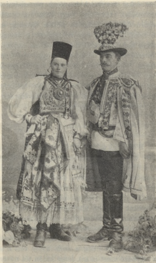
SZÁSZ JEGYESPÁR N.-SZEKEN VIDÉKÉRŐL.

Nagyobb számú német telepek vannak még a felvidéken, Sárosban a tótok és Beregben Munkács körül a rutének között. Ez utóbbiak terjeszkednek. A szétszórta apró német telepek lassankint fölszívódnak környezetükbe.