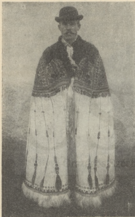
PARASZT EMBER SUBÁBAN.

A magyar férfi-viselet meglehetősen egyöntetű az országban. Nyáron házi vászonból, újabban gyolcsból varrott, térdén alúl érő, ezer ránczba szedett (némely helyen redőtlen, csúf zsákalakú, pl. Dunáninnen Nyitra, Komárom, Esztergom megyékben) rojtos gatyá; rövid, gyakran köldökig