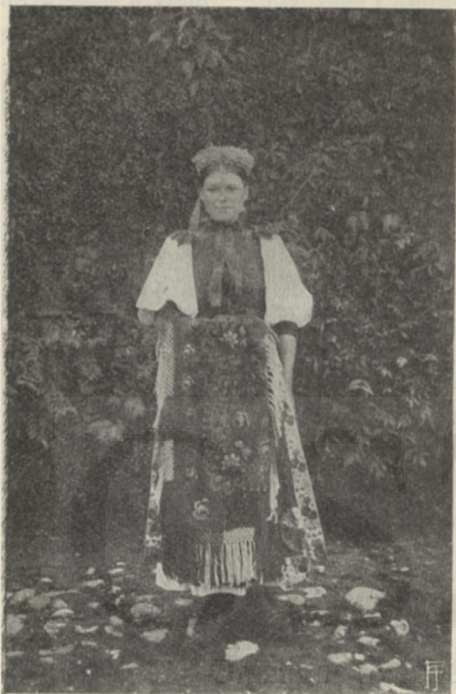
PÁRTÁS LEÁNY NYÁRI RUHÁBAN.

rész a néprajz klasszikus földje. Főtömegét oláhok lakván, természetes, hogy sok oláh hatást találunk a magyarság néprajzában, az őslakos szlávoké és az újabb, de szintén régi németeké mellett. Viszont azonban a magyarság is erős befolyással volt mindkettőre.