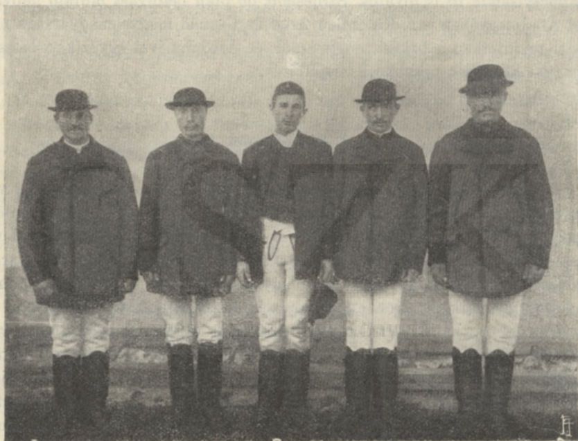
CSÍKI SZÉKELY FÉRFIVISELET.

gyarok jóval a honfoglalás után és pedig két ízben telepítettek ki a keleti szélekre, a határok védelmére. Erre mutat az is, hogy egyik águk (Csik, Háromszék, Maros-Torda) az «ë»-ző, a másik (Udvarhely) az «ö»-ző nyelvjárást beszéli. A székely nyelvben igen sok becses régi nyelvsajátságunk maradt fenn. A legszebb, régies nyelvű népballadák is tőlük kerültek elő. A bevezetésben már említettük, hogy a székelyek külsőre nézve legjobban eltérnek az átlagos magyar típustól — sem embere, sem aszszonya nem olyan szép — de különböznek karakter dolgában is. A székely