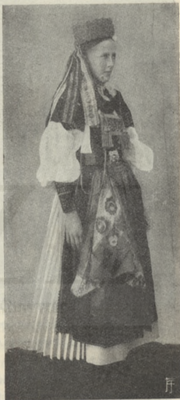
MAGYAR PÁRTÁS LEÁNY.

Néprajzi tekintetben nevezetesebb szigetek még Alsófehér vármegye, Kolozsvár környéke és a Kis-Küküllő mente. Egyáltalában az egész erdélyi