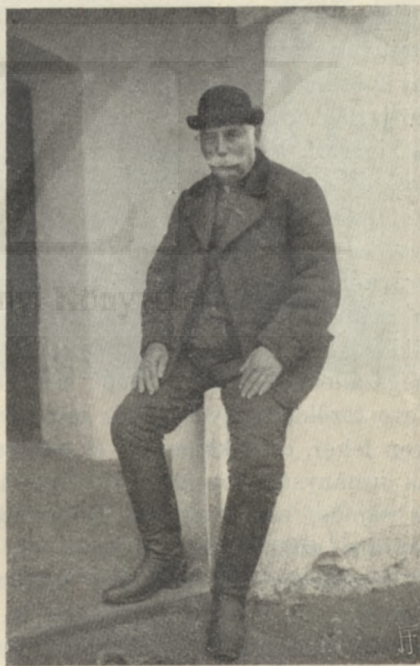
MAGYAR ÖREG EMBER.

Az összes lakosság 70%-a magyar. Földjét tekintve, kicsiben Magyarország. Földmívelése, állattenyésztése egyaránt kitünő. A honfoglalók korán megszállották, s az itt talált nagyszámú szláv és avar elemet fölszívták. Azt állítják, ennek következtében alakult ki a nyugati és dunántúli nyelvjárás. Amazt a nyugati határszáron főleg Vasban, Zalában, emezt déli Somogy és Tolna meg Baranya kivételével — a hol az alföldi ú. n. «ö»-zö dialektus ott-honos — a Dunántúl többi részén beszélik. Igazi magyar típus leg-tömegesebben a Balatontól d.-re és dk.-re található, de foltokban mindenütt. Az ősi szlávval vegyült vagy magyarrá lett típus különösen Veszprém megyében figyelhető meg. Néprajzi tekintetben egész csomó érdekes vidék alakult itt ki, különösen a nyugati nyelvjárás területén. Itt van Vasmegye dny.-i felében az erdők közt fekvő «Örség», 18 ref. és kath. község, Őri-Szent-Péter középponttal; az Árpádok határőreinek hiteles ivadékai, jómódú, szép fajtájú, de sajnos, nem szapora, s ezért a vendeknek tért engedő nép, ősi ízű gazdálkodásmóddal, ősi ízű építkezéssel és tájnyelvvvel. Az Örség mellett fekszik délen a hét községből álló Hetés, vagy a napnyugati Göcsej, régi besenyő telep, horvátokkal, vendekkel keverve; szintén régies ma-