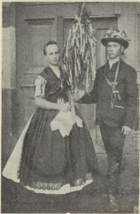
SVÁB KERVÁJOS VEZETŐPÁR.

nagy számmal látogatják. Népmulatságuk koronája a templomi búcsú a «Kirchweihfest», melyet a fiatalság nagy zenés tánczmulatsággal ünnepel. Úgy náluk, mint a dunántúliaknál is minden falunak megvan a maga rezes vagy tröttyös bandája, mely a környező magyar falvakban is erősen kezd meghonosodni s a népmulatságokból kiszorítja a cizgánymuzsikát.