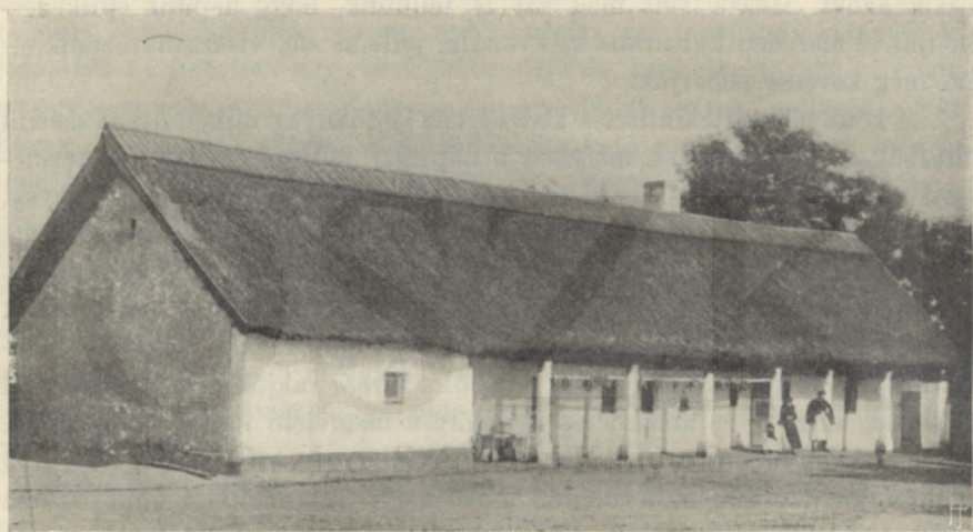
KÚN HÁZ. (TÖRÖK-SZENT-MIKLÓS.)

felől van az első vagy parádés szoba, közepén a konyha, a hatalmas szabad tűzhelylyel, a falakra aggatott virágos tányérokkal, tálakkal; hátul a lakó szoba. Mindkét szoba a konyhából nyílik, s berendezésük nagyjából és általánosan ilyen típusú: Az ajtó mellett lévő sarokban van a kályha, az ősi házban sárból rakott búbos- vagy boglyakemence, újabban zöldmázas fiókos kályha; vele rézsút szemben az udvarra és utcára szolgáló ablakok közt a családi asztal, körülszegve lóczákkal, fölötte a falon a kancsós fogas, a kemence végében s a szemközti fal mellett is nyoszolya, végükben tulipántos ládák, előttük karosszékek. Úgy a lakóház beosztása, mint berendezése hazánk nagy részében az itt leírt típust