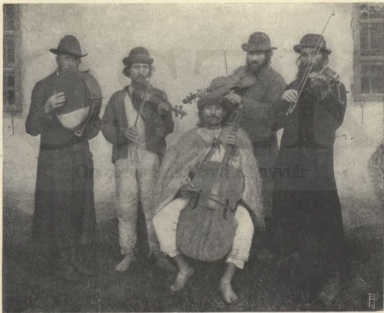
RUTÉN ÉS ZSIDÓ MUZSIKUSOK.

fenecziai és karthagói nyelv. Lehetséges, hogy már a honfoglalókkal jöttek be, sőt már előbb is lehettek itt; de annyi bizonyos, hogy az Árpádok alatt nagy befolyásra tettek szert. Régen külön városrészekben laktak, s öltözetükön megkülönböztető jeleket kellett viselniök. Eszes, ravasz, kereskedő hajlamú, mozgékony, mértékletes, szívos, összetartó, erős faji érzésű, mély családi életű, rendkívül szapora és vallásos nép, mely nem mint nemzetiség, hanem mint vallásfelekezet jön számba. De épen vallási okokból történt szigorú elzárkozottságuk tartotta fönn népi sajátságait, melyek a többi népektől eltérőleg, azzal szoros kapcsolatban vannak. Nagy tömegük a kereskedő, kisebbik az értelmi pályán van; iparral és földműveléssel csak kényszerűségből foglalkoznak.