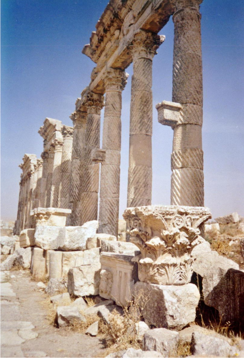
Apamea – Római kori város utcája