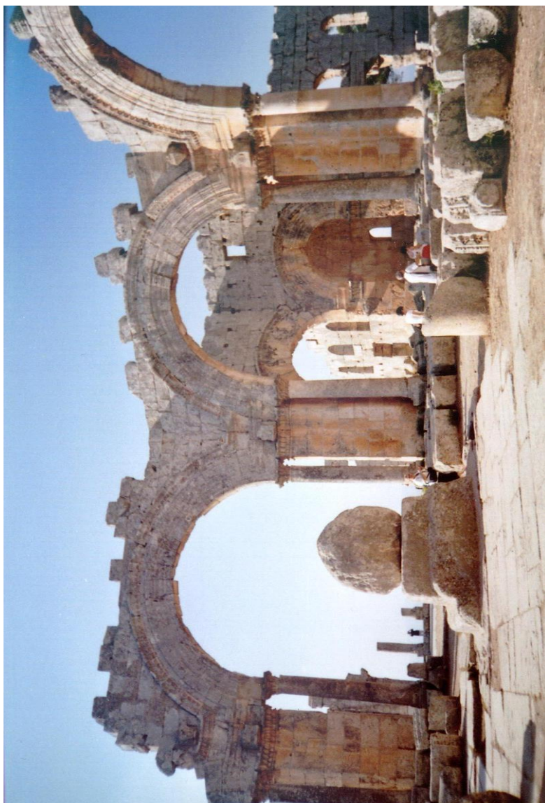
Oszlopos Szt. Simeon bazilika romjai