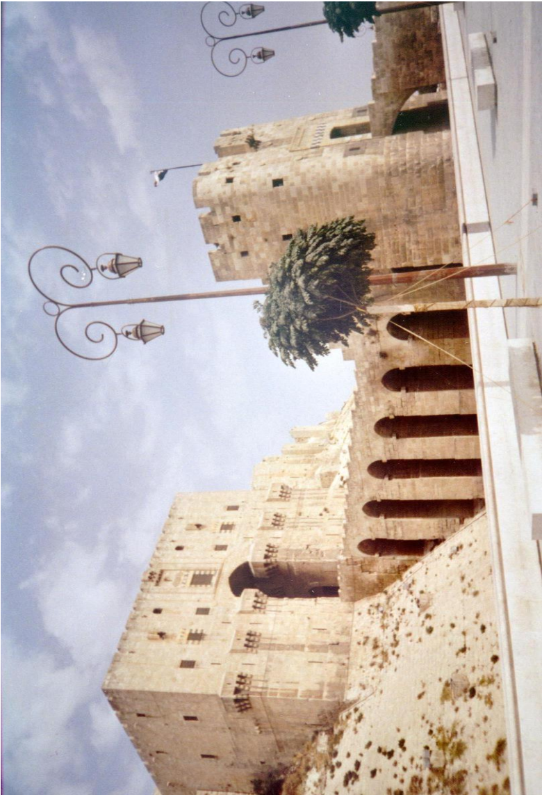
Aleppo – Citadella