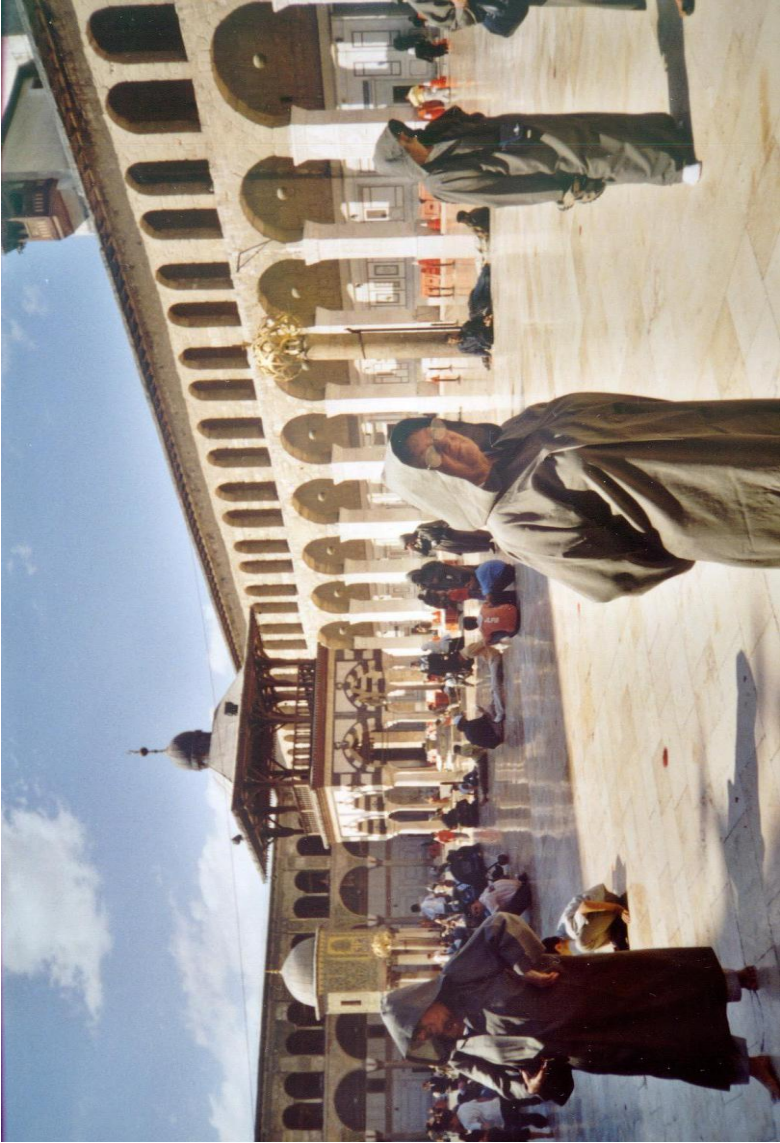
Damaszkusz – az Omajjád Mecset udvarán zarándokkötösben