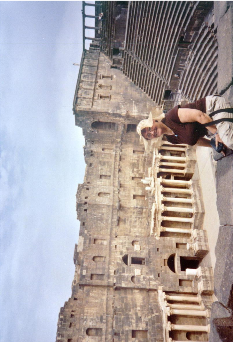
Boszra világhírű amfiteátrumja