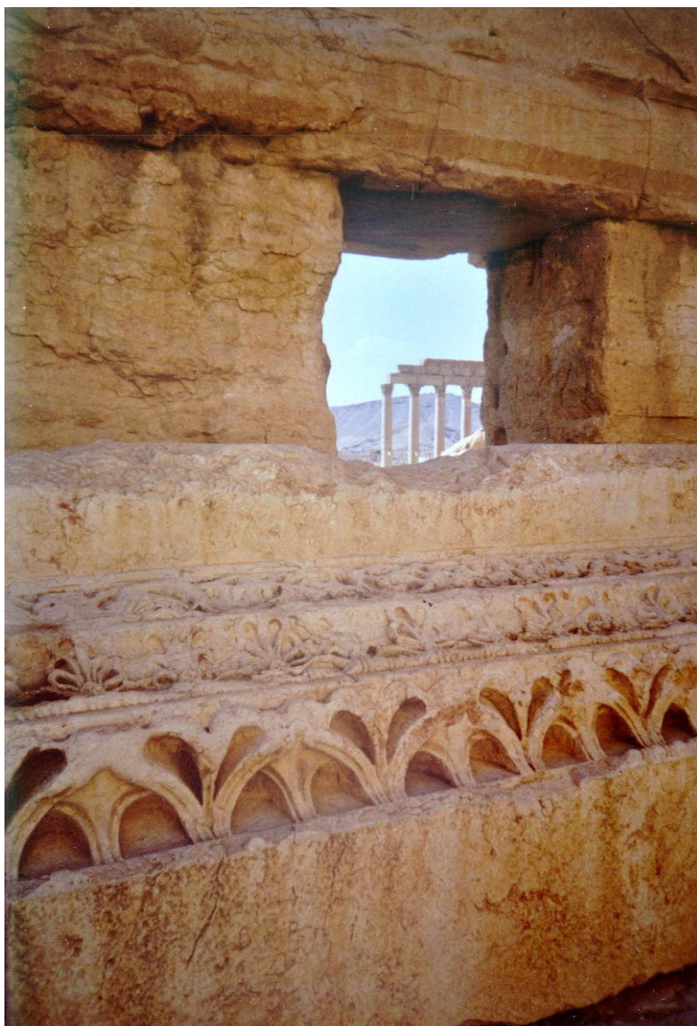
Palmira – Kipillantás Palmira romjaira a Baál templom szentélyéből