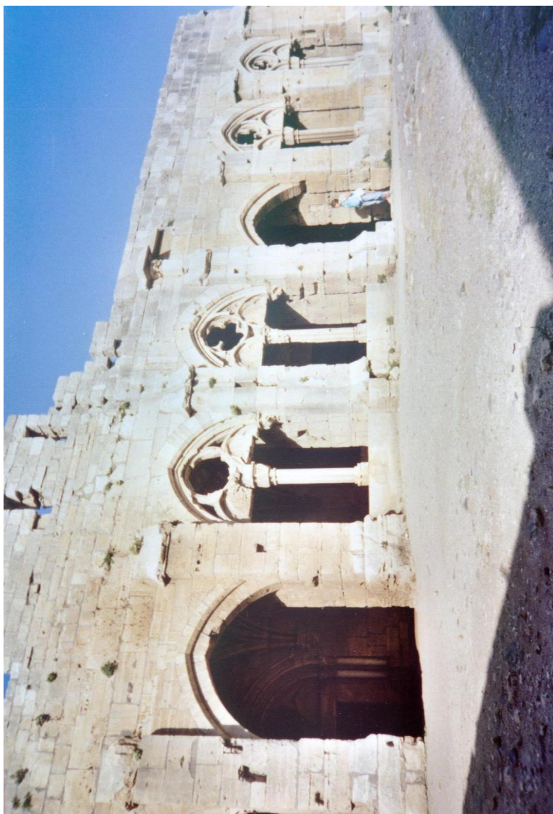
Krak des Chevalliers – Keresztes lovagvár temploma