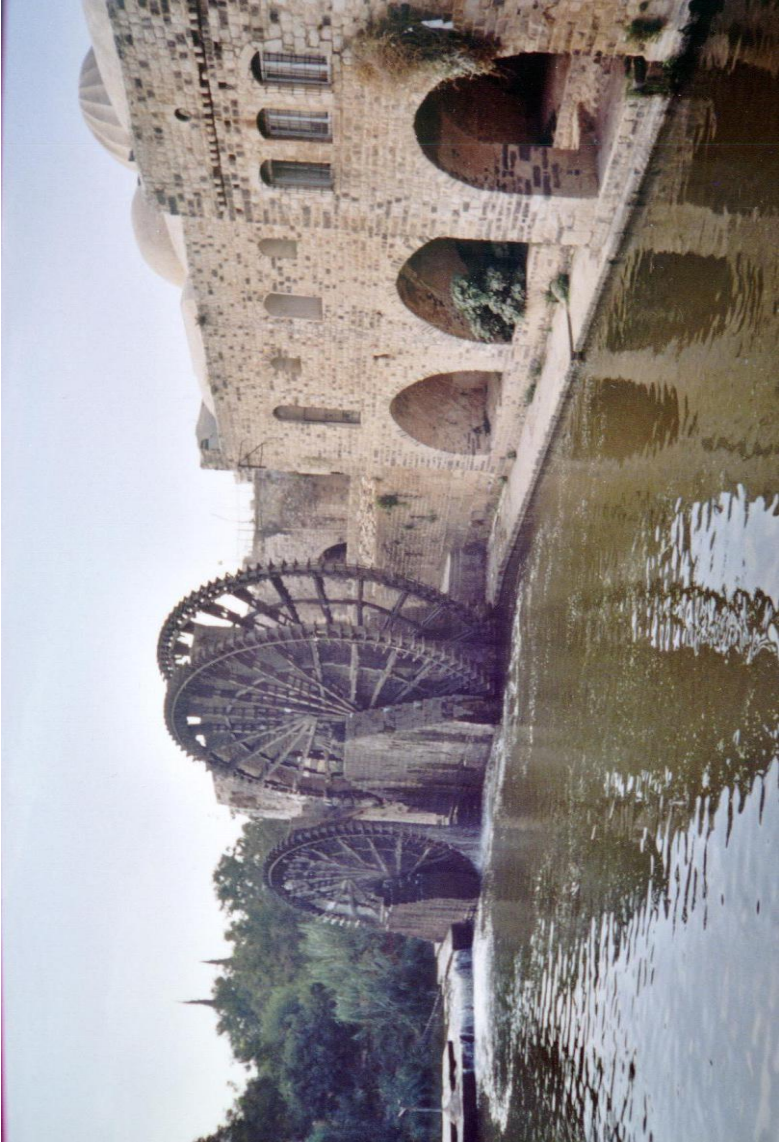
Hama – Vizikerekek