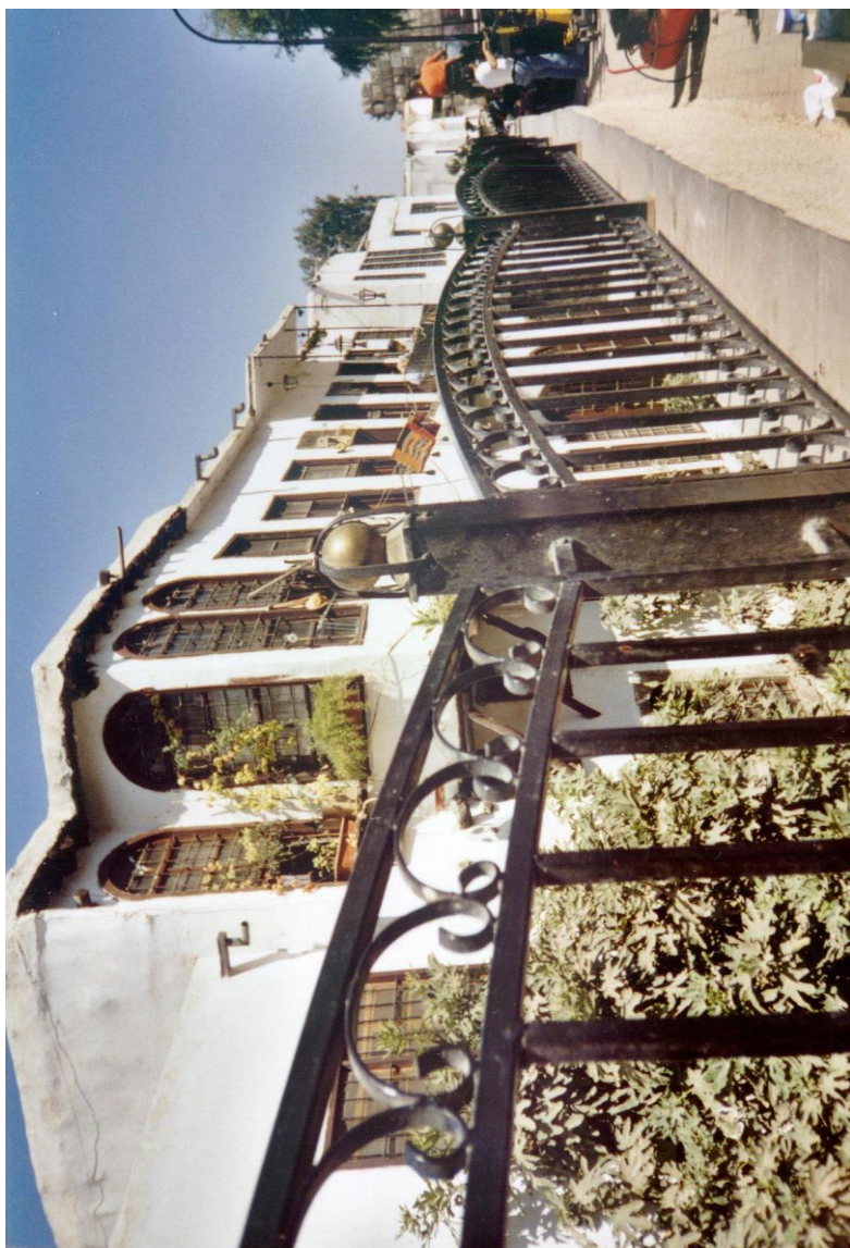
Damaszkuszi utcakép a Citadella oldalánál