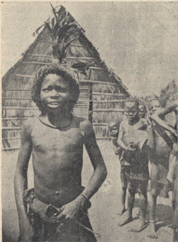
A Bapedék a parókát is ismerik.

— Ugy ám bizony — erősködött, mert minden valamire való ember, a „felsőtíz“, az ő nyájához tartozik. Kíváncsi természetű vagyok: szívesen álltam kö-