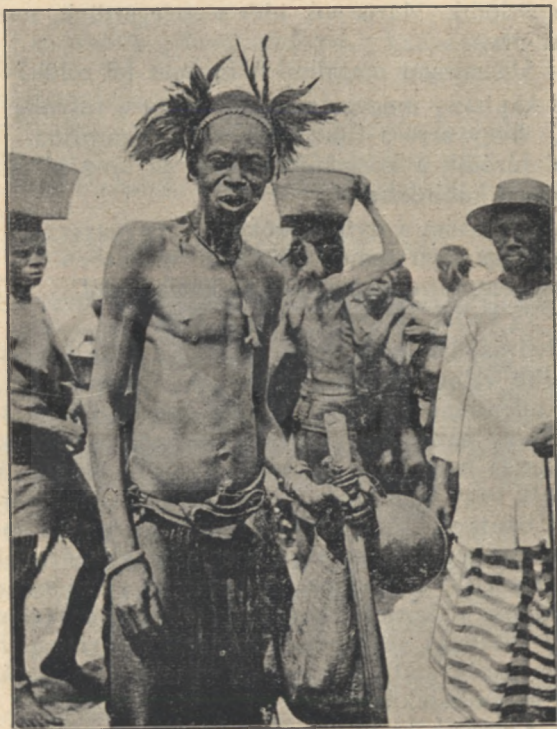
Babunda néger törzsfőnök.

— Parthoz! Gyorsan a parthoz! Majd megtanítom én ezt a népséget keztyűbe dudálni!