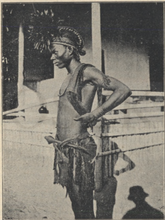
Babunda néger férfi.

— A történet hitelességét megerősíti az a körülmény, jegyeztem meg — hogy szóról-szóra ugyanezt a történetet minden egyes utazásomon hallottam különféle emberektől, akikkel hajszálra ugyanez az eset esett meg. Az elefántoknak nyilván megrögzött szokása,