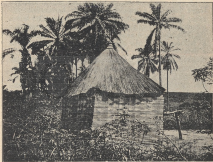
Babunda néger leány lakóháza.