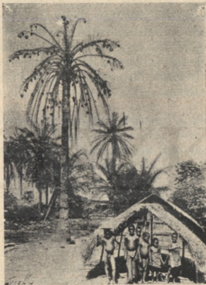
Szövő madarak fészkei. (A Kvilu-menti falvak pálmái tele vannak a fekete »szövő« madarak fészkeivel. A szárnyrakelés előtt a fiókákat kiszedik a bensülöttek a fészkekből és olajban megsütve megeszik. Inyenc falatjuk nékik. Ez »A világosság eredete« című mesében említett »dzsapodja« madár.

amellett nem volt terhünkre — ellenkezőleg roppant hasznavehető kis jószág volt. Az apja alighanem olyanforma oktatással bocsátotta szárnyára, hogy bennem amolyan félistent lászon: rendíthetetlen hite és bizodalma, amivel rajtam csüggött, egyenesen megható volt. Ha nagyon szorongatott helyzetben voltunk, támadás