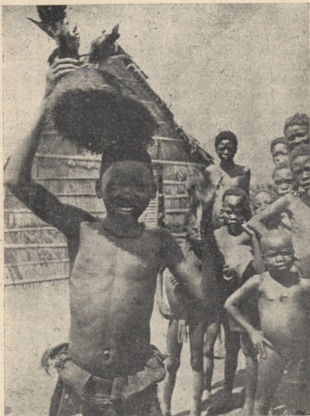
A Bapendék a parókát is ismerik.