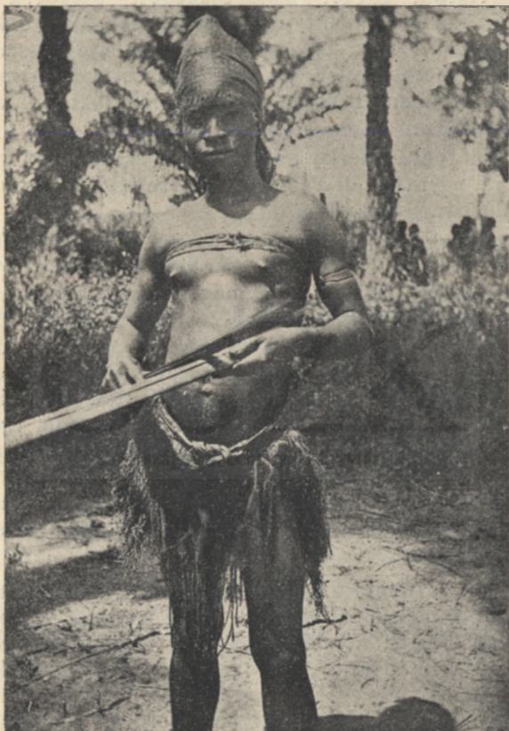
Mobunda legény gyászkeraplóval.

zátonyt rajzolt térképébe, szikla vagy homokzátonyt, aszerint, hogy keményebb vagy enyhébb volt-e a ráz-