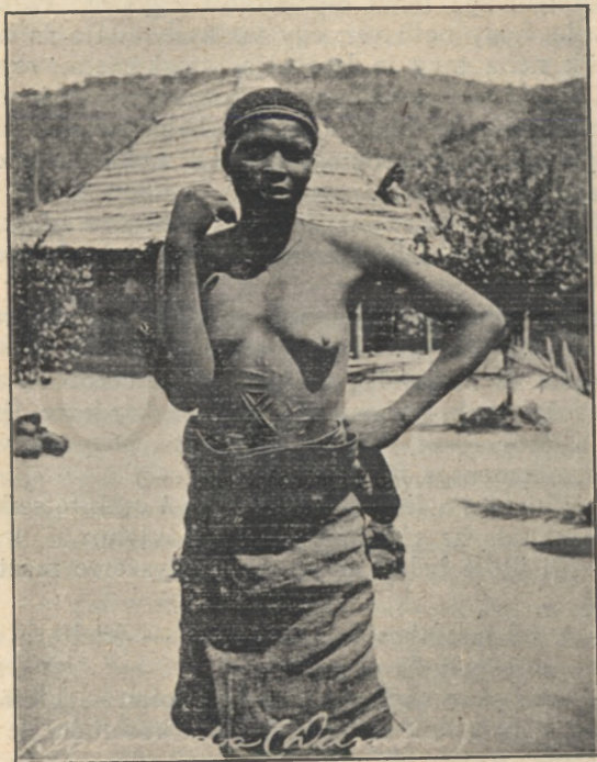
Babunda néger szépség.

rejtekhelyén megbujva leselkedik s aki megcsalja, előbb vagy utóbb mérgezett nyilat kap az oldalába. A törpék népe nem ismeri a tréfát ilyenekben. Viszont meg kell adni, nem fordul elő, hogy törpe valaha is