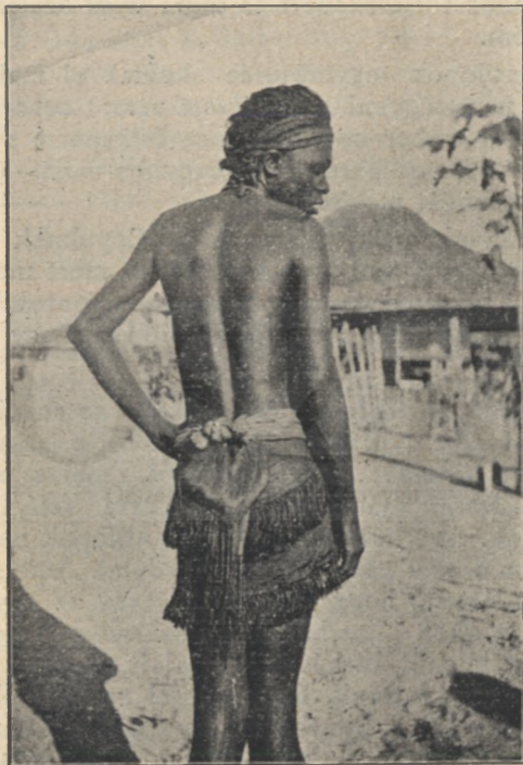
Babunda néger férfi.

álltunk. A bennszülött vadász rám nézett elcsodálkozó- zón: a legcsekélyebb kísérletet se tettem a lövésre. Szanga jobban megértett; körülszimatolt a levegőben, amerről a vad jött és — égnék borzolódtott a szőre. Új-