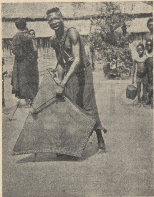
Batetela drótnélküli táviró.

Még amikor a rabszolgakereskedelem megszűnt is az embervásár elnyomásával Amerikában, a gyarmat