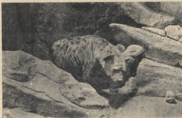
A hiéna odujából kijön.

— Szó ami szó, sakál bátya, mi nem voltunk mindig jó barátok, de most, hogy szegeletre jutottunk egy-