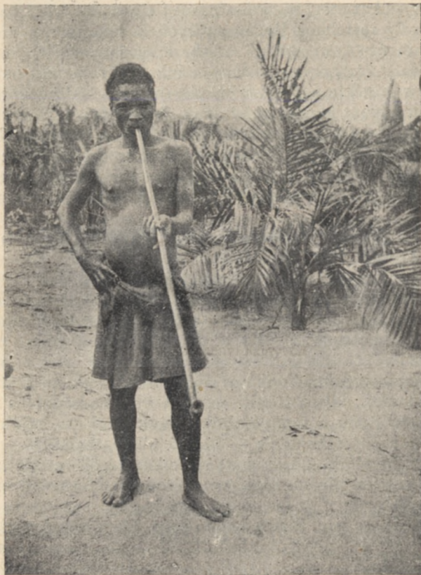
Akkora pipát szívnak a Bakongók, akár egy magyar falusi nótárius.

hölgynek“ volt fenntartva. Ő utána következett egy gentleman, aki egy kerek sovereignt szúrt le aranyban s ő nyithatta föl a hangszer födelét. A csodálkozás föl-