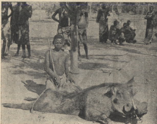
A világ legcsufabb állata: A varangyos disznó.

Igy szólván, kivett egy pipát a tarisznyájából, megtöltötte a száraz levelekkel, meggyújtotta a tábortűz