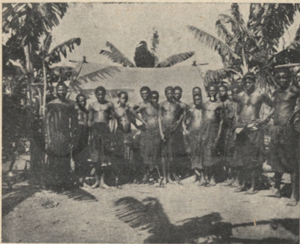
A bambalák várják a támadást Kengében.

Köveltük az állat nyomát; kis társam szorosan a sarkamban. Kis időre rá halljuk ám az állat hörgését. Közvetlen közelünkben kellett lennie, de a bozót elfogta a kilátást. Amikor hirtelen megpillantottam, tíz lépésre volt, szemtől-szembe fordulva. Egyenesen nekem rontott. A következő pillanatban golyóm átfúrta a nyakszirtje közepét és a bölény élettelenül rogyott a lábam elé.