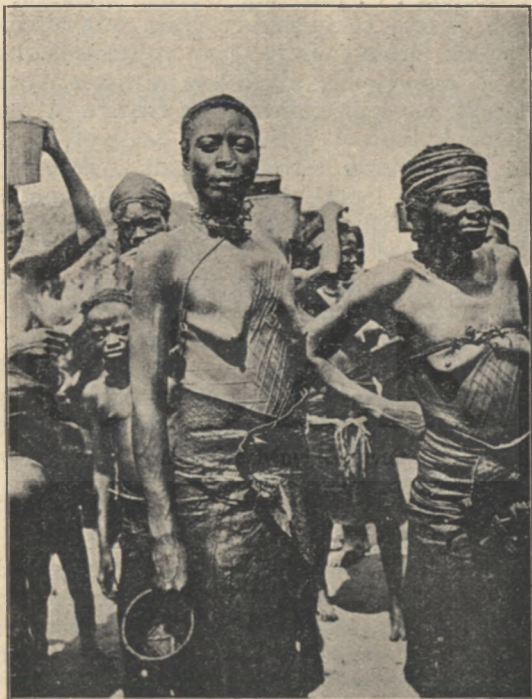
Babunda néger asszonyok.

lentkezett volna, ha ellenség: végezhetett volna velem, mielőtt puskámhoz nyúlhattam. Nem, ember nem lehet. De mégis van valami emberi benne. Majom? Meglehet — de a szeme túlon túl nagy hozzá, hogy majom