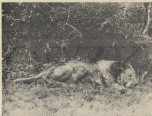
A vén oroszlán.

— Csalatkoztam Sakál komában — jegyezte meg a hiéna. — Jobb véleménnyel voltam róla. De ha ő nem