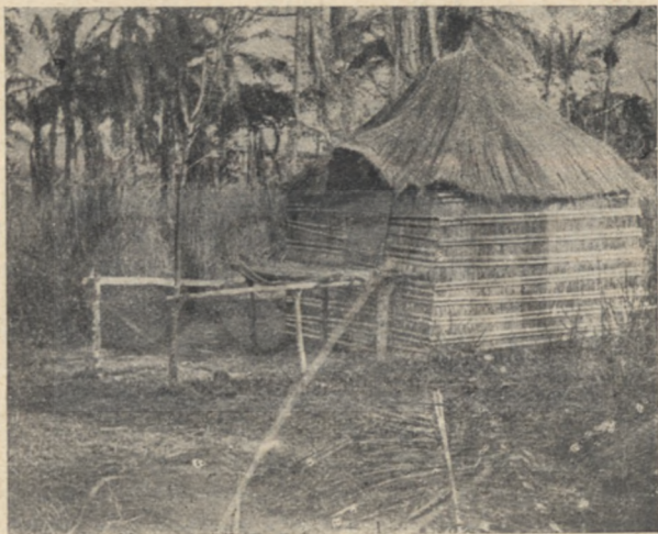
Babunda ház verandával

sig megteltek. A könnyen fölbuzduló komasszúiak nyomban átlátták a hirdetett tanítás üdvös voltát, hazavágtattak és csapatostul kezdék terelni kérdemesült feleségeiket a templomok elé — árverésre. A kereslet vajmi csekély volt és bátortalan; az asszonyok ára rohamos iramban hanyatlott — soha nem tapasztalt pangás állt be az asszonypiacon. Egész jóminőségű árút lehetett kapni, ha nem is újat: alig rongáltat, egy kö-