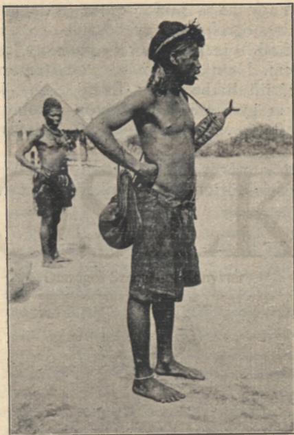
Babunda néger férfi.

sek vele valakit. Borzasztó következményei lehetnének. Izmaim ereje rettenetes. Nem, ne mondja meg nekem azt a szót, nem akarom megtanulni". — A hittérítő erősködött. Kifejtette apróra, mennyi mindenféle helyzetbe juthatok, amikor botra lesz szükségem. Megtörténhetik, hogy útra készülök, hegyes vidéken és