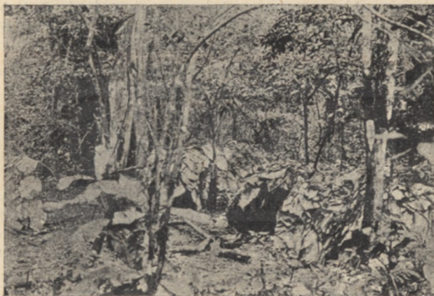
Pygméusok méhkashoz hasonló kunyhója.

A jezsuitákat sok támadás érte már ezek miatt a misszió-állomások miatt. Éveken át ontották ellenük a támadó cikkeket ilyenféle címeken: „Kegyetlenkedések a Kongo-vidéken“. Kivált az angol sajtó volt hangos a keményhangú leleplezésektől.