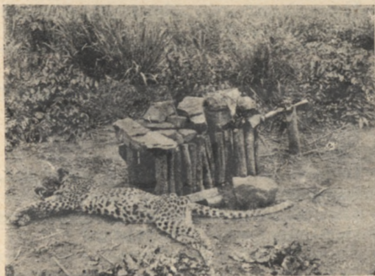
Az embert evő leopárd.

Reggel mind a ketten lementek a folyóra. A kis antilop a korhadt fatönköt és egy hosszú kötelet cipelt. Óvatosan körülszimatolt s mikor meggyőződött róla, hogy nincs a közelben krokodil, lemerült a folyó fenekére és a kötelet áthúzta egy gyökér alatt a víz fenekén. Aztán kikecmergett a vízből, rákötötte a fatönköt a kötélen egyik végére és behajította a folyóba. A kötélen másik