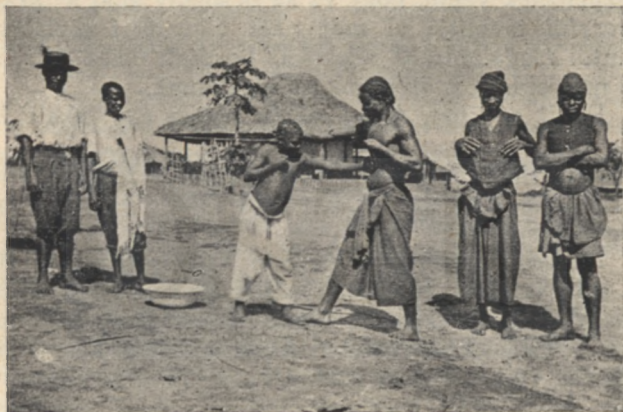
A híres Buja-Mokenye box-match.

— De ha embereim közül ott hagyja valaki a fogát