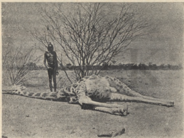
Hogyan kapta a zsiráf a hosszú nyakát?

A vadmacska neve, az ősi ellenségé, egyszeriben talpra állította mókus komát — szempillantás alatt fönn termett a pálma tetejében; ijedtében észre se vette a magával vonzott súlyos kötelet. Akkor a kis antilop rákiáltott: