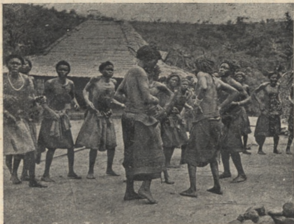
A Kongó-népek szenvedélyes táncosok.

Másnap reggel korán fölkerekedtünk. Ritkás erdőn át vivő hosszú menetelés után sziklás dombok közé értünk. A száraz időszak végére járt, a fű kopárra lesülve. Ami kevés fűszál kisarjadt a kövek között, letöredezett az elsők lába alatt. Ez fárasztóvá tette a kapaszkodást: európai csizmámban folytonosan meg-megsiklottam, akárcsak sima jégen járnék. Végül is megpróbálkoztam, hogy mezítláb loholok utánuk. Ekkor meg