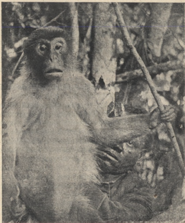
A nagy majom.

hogy második lándzsát vegyen magához. Amint az elefánt észrevette, borzasztó bögéssel rontott reája. Mászoló egész természetben fölegyenesedve várta be néhány lépésnyire és aztán rettentő erővel hajította el a lándzsát.