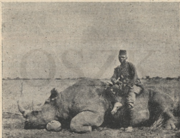
Marbuki az elejtett orrszarvún.

De a kis antilop, látván, hogy a sakál bekapta a horgot, jobbnak látta gyorsan elszélelni; félt, ha még tovább ott marad, hangosan elneveti magát. Sietve annyit mondott csak, haza akar menni, hogy hamut hintsen a fejére gyásza jeléül. Ezzel elváltak.