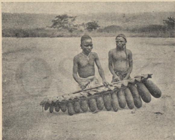
Xilofon Babindzsi hangszer. (A billentyűk fából vannak, minden billentyű alatt száraz lopótköböl vajt külön rezonátor van.)

— Dilonda, a te cimboráid meg fognak pukkadni az irigységtől. Ahogy én látom, nem ezer, de tízezer kupa bort fogsz fölhajtani, ha szert teszel erre a mustáros edényre. Az emberek mind téged fognak emlegetni a Kaszaitól a Kviluig, hogy ilyen dicső ivó nincsen több a világon. Ha valaki jól birja az italt, azt fogják