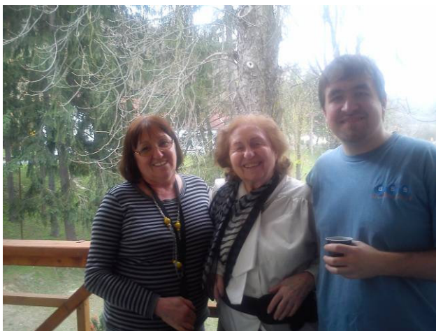
2013. Lányommal és unokámmal Visegrád-Gizella-telep reh. kórház parkjában felkötött karral

A kötetet borítóval együtt szerkesztette és a szonetteket írta: