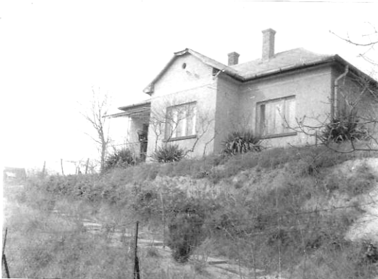
Szüleim háza a dombtetőn