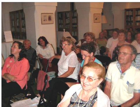
Szigliget, esti foglalkozás

Az ég derült, a gyorsvonat haladt, az egész táj fürdött napsugárban, szálló fecskeraj nagy csatazajjal készülődött hosszú vándorútjára. Kitekintve a gyorsvonat ablakán csodás őszi tájban gyönyörködtem.