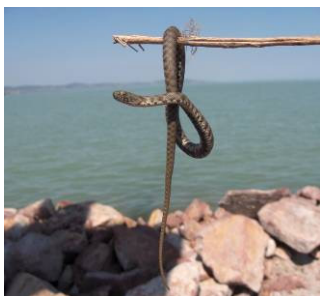
Sikló akasztva

Kakukk szól, éles hangja csendre vár. Az eső eláll, vihar nem csendesül, villámok csapkodnak mindenfelől, széltől ágak megszáradnak, nagy a kár... Félelmetes mennydörgés után lecsap a villám, száraz gallyak lángja lobban, és terjed, fák közt a tűzláng felcsap, ég az erdő, földre ér a tüzes ág... s ropogó tűzvészben nagyot koppan. Félve menekül – most nem vadászik, veszélyt lát – sebesen fut minden állat, megfeszítve reszkető izmaikat, – most a kígyók se jelentnek veszélyt, földön kúsznak, – a farkas sem vadászik.