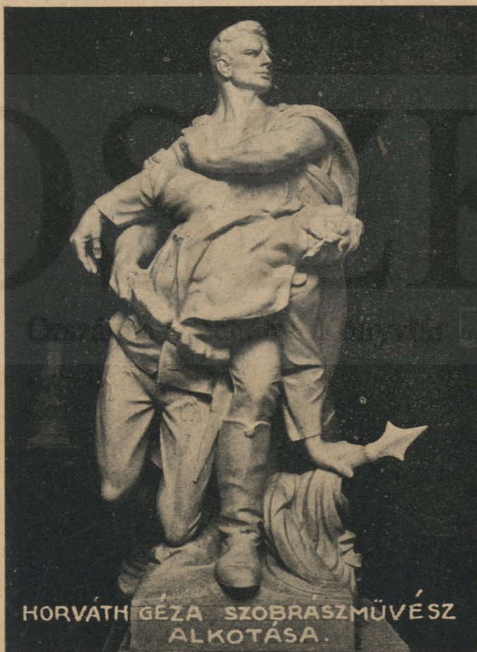
HORVÁTH GÉZA SZOBRÁSZMŰVÉSZ ALKOTÁSA.