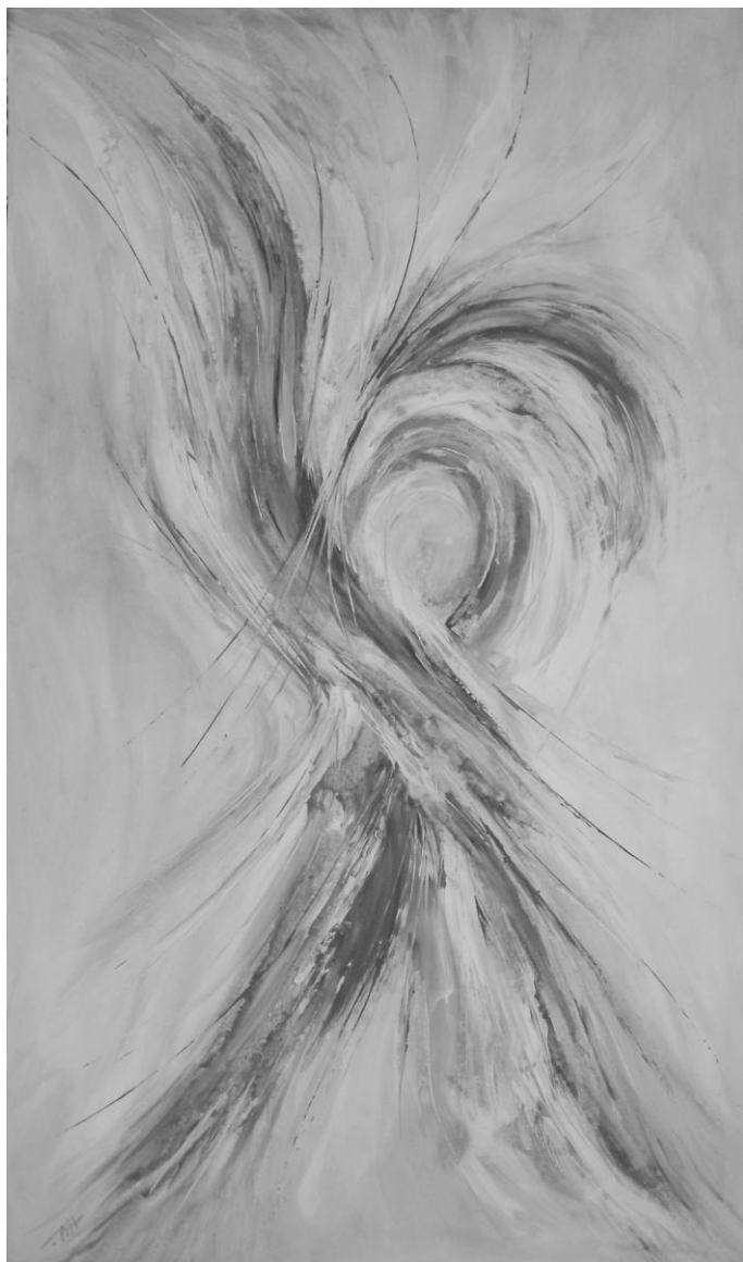
HORVÁTH ILDIKÓ: ÉRZELEMÁRAMLÁS