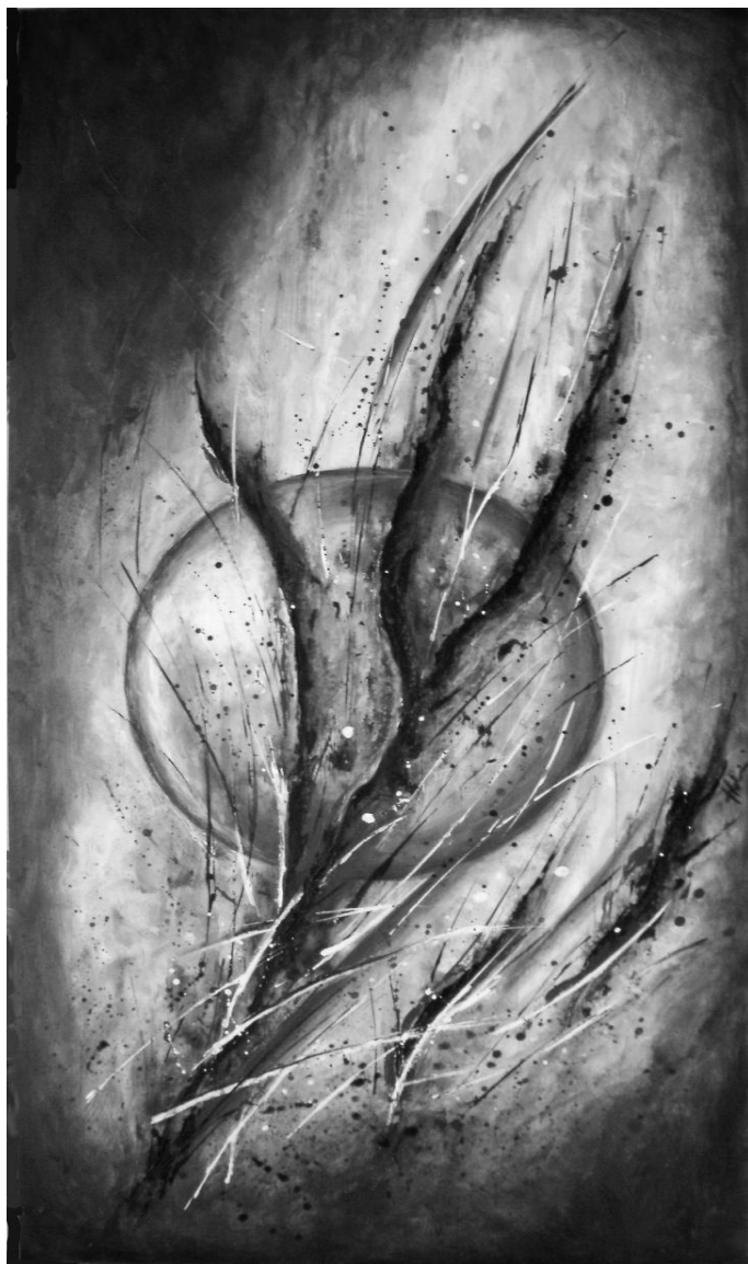
HORVÁTH ILDIKÓ: ÉLETBOLYGÓM