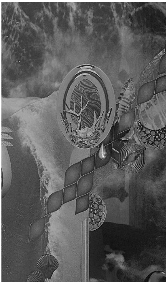
VÉBER NOÉMI: A TENGER SZEME