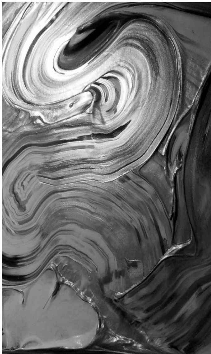
VÉBER NOÉMI: HULLÁMOK KÖZT