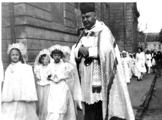
Az iskolából a templom felé

A 2. osztály legemlékezetesebb eseménye az első- áldozás volt, amire hónapokon át készültünk. Az utolsó hetekben többször elpróbáltuk a templomban az utolsó térdhajtásig megkoreografált eseményt.