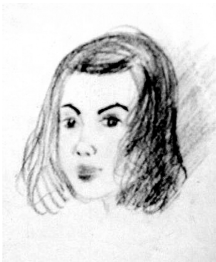
Önarckép 13 évesen

Kicsi vagyok én, Kicsi az én szám, Csak annyit tud mondani: „Szeretlek anyám!”