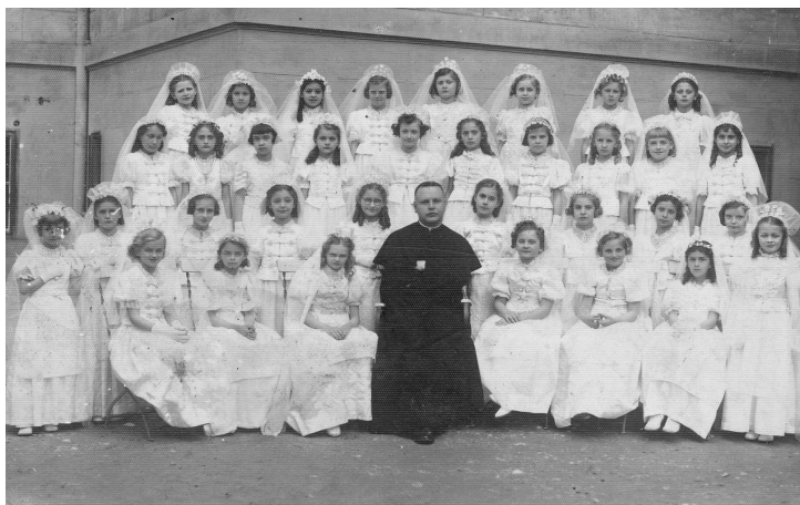
A 2. b osztály