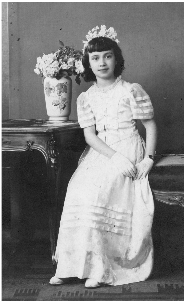
A bérnálási képem

Egy művi mesevilágban éltem. Néha mégis átszűrődött hozzám valami a mindennapok problémáiból, mert mindenre füleltem, ami a felnőttek között szóba került. Így hallottam meg például, hogy azért