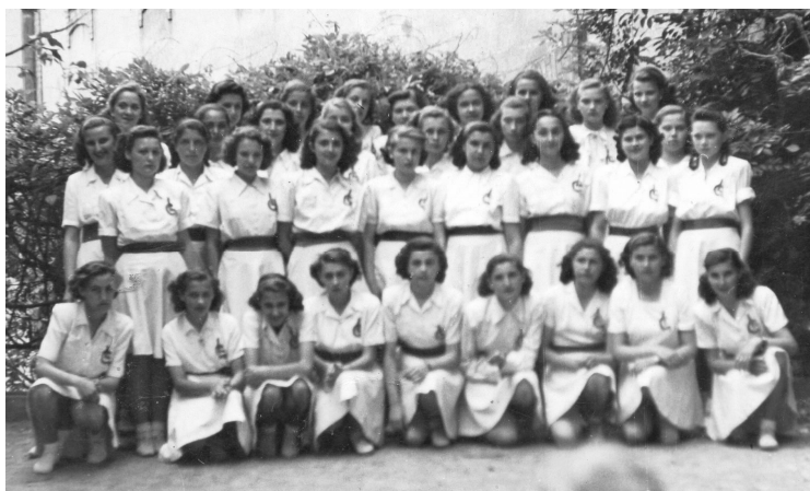
A gimnázium tánccsoportja – 1950.

A gimnázium udvarán, a bejárat mellett, a sarokban állt a Glicina. Emlékeimben úgy él, mintha nem csak a vasrácsra, hanem az épület falán is magasra kúszott volna. Ahogy távolodik a múlt, egyre hatalmasabbnak és egyre gyönyörűbbnek tűnik, pedig valószínű, hogy már régen elpusztult.