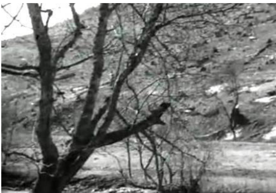
A húszéves megszállás alatt összefüggő hatalmas erdőségeket irtottak ki.

Az első, amivel szembe kellett néznie, a csehszlovák örökség volt. Ungvár első látásra kedves monarchiabeli kisváros volt, ha vasárnap a templom után a családdal korzóztak, zárójelbe is lehetett volna tenni az elmúlt húsz évet, mintha visszatértek volna a régi békebeli világba. Ha bementek egy cukrászdába, a választék nagyobb volt, mint otthon, sőt még tejszínhabot is kérhetett a kávéhoz a gyerekeknek. Ha a vidéket járta, több új házat látott, mint a csonka országban, látszódtott, hogy a terület ötöd évszázadig egy jóléti államhoz tartozott, s a szegény Magyarország még nem tudta kiszívni a két évtized alatt felhalmozott jólétet. De látta ennek az örökségnek az árnyoldalát is: a csehek, mintha sejtették volna, hogy az ebül szerzett jószág nem marad sokáig övék, a természeti erőforrásokat kíméletlenül kizsákmányolták: letarolták az erőket, az évszázados fákat, nem törődve azzal, hogy az eső pár év alatt véglegesen elmossa a földet, s kopárrá válnak a hegyek. Gyakran kellett az erdészeti hivatal embereit elkísérnie állapotfelmérésre, erdőtelepítésre. Furcsamód ezzel a helyiekkel, akik korábban morgolódnak az életszínvonal esése miatt, ezzel megnyerték: érezték, hogy végre hazaértek, olyan kormányzat alá kerültek, amelyik hosszútávon gondoskodni akar róluk.