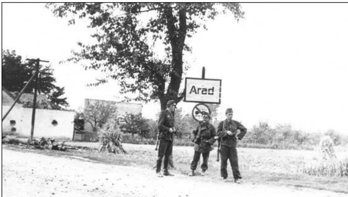
Magyar haditudósító német katonákkal Arad határában 1944. szeptember 14-én

És Világosnál a háború szigorú logikája győzött a lelkesedés és a hit felett: az egyesült román-orosz erők szétverték a magyarokat. Sztalin vassárcányai, a T-34-esek, mint a gyerekjátékokat gyúrték maguk alá a magyar Toldi és Turán harckocsikat. A román tüzekek mintha vurstliban lettek volna, lőtték le a páncéltörő fegyverek és légi támogatás nélkül támadó magyar gyalogságot.