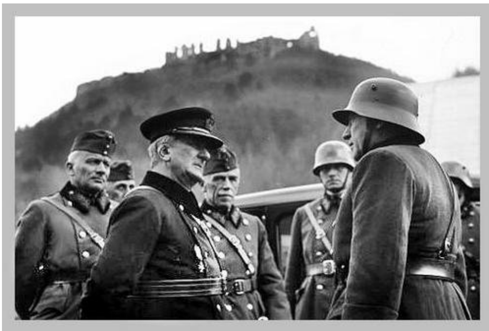
Horthy Miklós Huszton

Fenyegető sötét képek sorolódtak, a közönség némán nézte a majd két évtizedes békediktátum hasznélvezőjének gyászszertartását. Majd a vásznon feltűnt egy öregember 2 , aki jól ismert anakronisztikus, a monarchikus aranykort idéző ellentengernagyi egyenruhájában megérkezik egy vasútállomásra, amin majd két évtized után újra magyar zászló leng. A nézőtéren nem tört ki tapsvihár, de egy pillanatra mindenki a könnyeivel küszködött, ahogy a Munkácsi vár előtt az ünneplő tömeg eddig féltve őrzött magyaros ruhájában köszöntötte a bevonuló honvédeket.