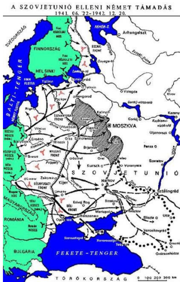
A Barbarossa Hadművelet – 1941.