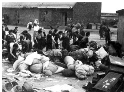
31. kép. A „Kanada kommandó” rabjai a blokkok előtt válogatják szét a teherautók rakományát.