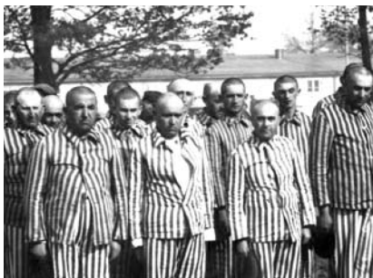
26. kép. Férfi zsidó foglyok a „Szaunában” történt fertőtlenítés után