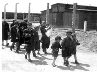
36. kép. Utolsó útjukon