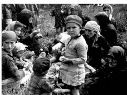
38. kép. Zsidók a birkenau-i kiserdőben a „zuhanyzás” előtt, a krematórium mellett