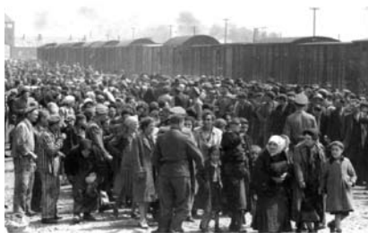
12. kép. A szelekció