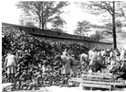
27. kép. A „Kanada” kommandó női rabjai válogatják a tárgyakat a barakkok előtt