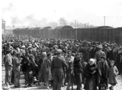
18. kép. A szelekció