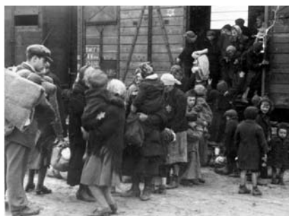
9. kép. Megérkezés Auschwitz-Birkenau