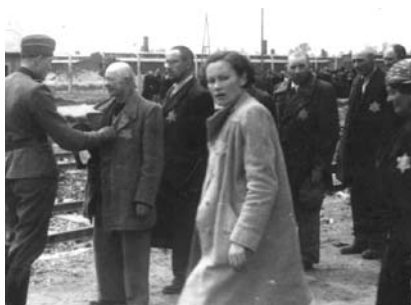
14. kép. A szelekció