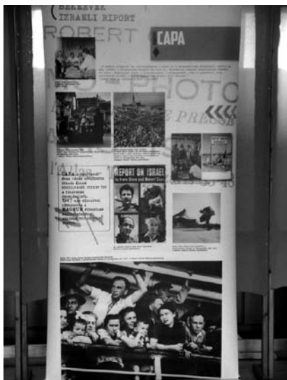
3-4. kép. Beregszász, Európa-Magyar Ház, Robert Capa fotóművész vándorkiállításának megnyitója