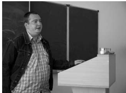
9-12. kép. Rendhagyó történelmi és irodalmi óra, fotó- és könyvkiállítás, dokumentumfilm-vetítés az UNE Magyar Tannyelvű Humán- és Társadalomtudományi Karán