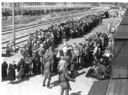
11. kép. A szelekció