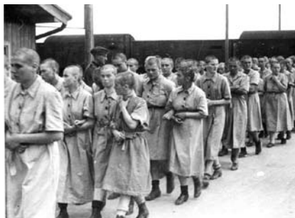
25. kép. Női zsidó foglyok