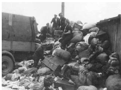
29. kép. Egy tipikus kép a csomagok és bőröndök végtelennek tűnő áradatáról, melyeket „Kanadában” gyűjtöttek és szortíroztak