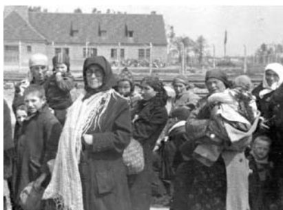
34. kép. Zsidó nők és gyerekek a III. sz. krematórium előtt