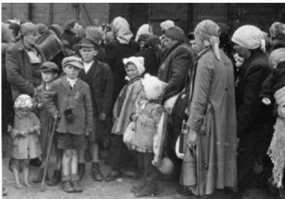
7. kép. Megérkezés Auschwitz-Birkenaubába