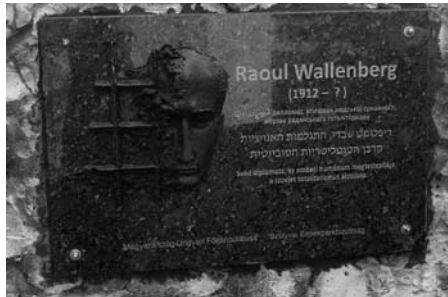
27-29. kép. A Raoul Wallenberg domborműves emléktábla felavatása