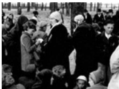
39. kép. Zsidók a birkenai kiserdőben, mielőtt a halálba vezetnék őket, a krematórium mellett