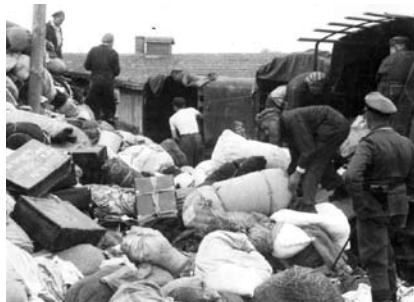
28. kép. A „Kanada” részleg barakkjai nem bizonyultak elégségesnek; személyes vagyontárgyak tömegei lepi el a barakkok közötti helyet