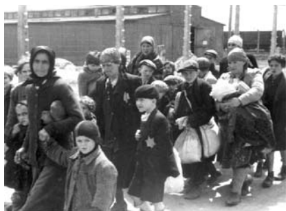
37. kép. Utolsó útjukon