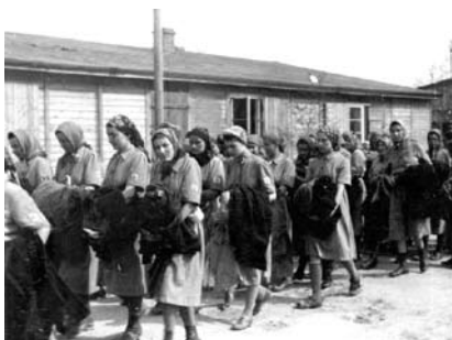
22. kép. Zsidó nők úton, a táboruk felé, már fogolyként