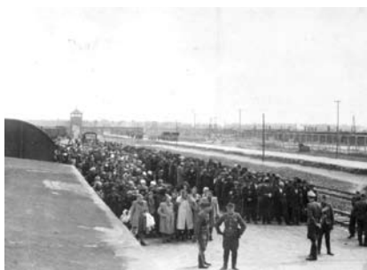
13. kép. A szelekció