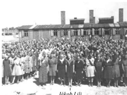
19. kép. Zsidó nők a sorakozón Birkenauban