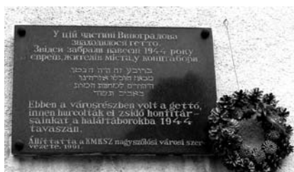
17-20. kép. A visszakapott zsinagóga felújítás alatt, gyertyagyújtás a holokauszt-emléktáblánál