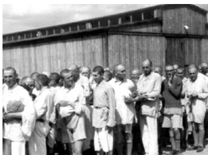
21. kép. Zsidó férfiak a fogollyá válás folyamatainak végén