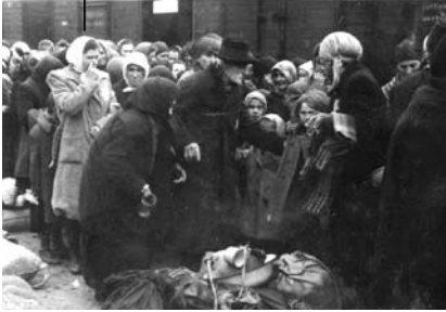
3. kép. Megérkezés Auschwitz-Birkenaubába