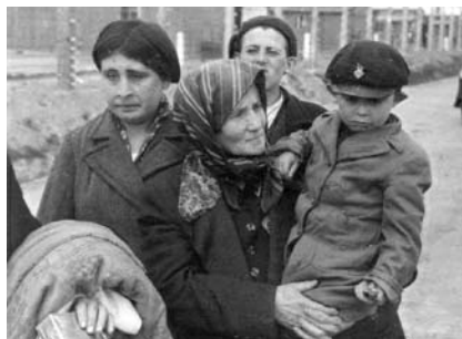
35. kép. Utolsó útjukon