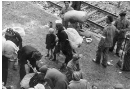
8. kép. Megérkezés Auschwitz-Birkenaubába