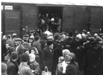
10. kép. Megérkezés Auschwitz-Birkenau