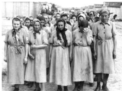
20. kép. Zsidó női rabok a folyamat végén