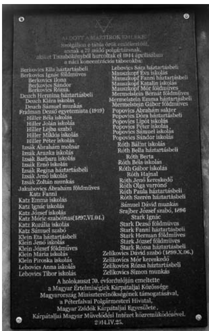
21-24. kép. Feliratos emlékoszlop-avatás a tiszabökényi elhurcolt zsidók emlékére