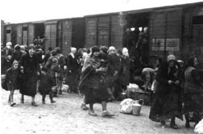
5. kép. Megérkezés Auschwitz-Birkenaubába