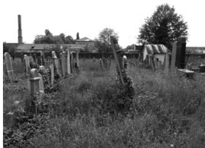
15-16. kép. A nagyszőlősi zsidó temető