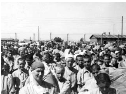
24. kép. Női zsidó foglyok a női táborban