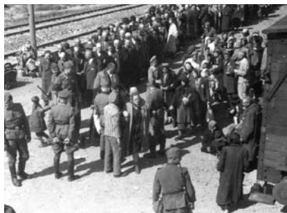
17. kép. A szelekció