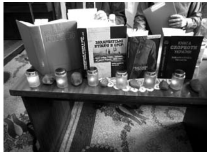
13-14. kép. Magyar holokauszt-megemlékezés, író-olvasó találkozó