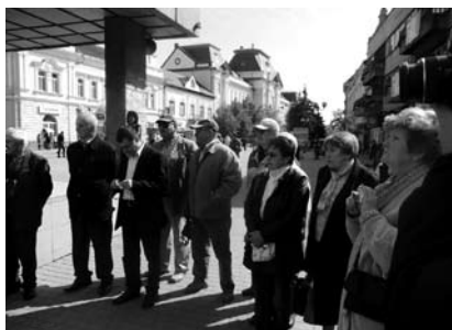
1-2. kép. Emlékezés az egykori zsinagóga falánál