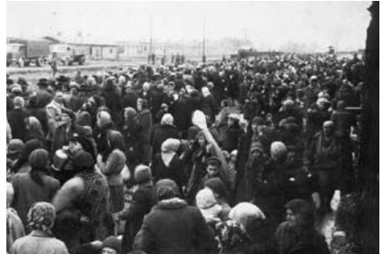
6. kép. Megérkezés Auschwitz-Birkenaubába