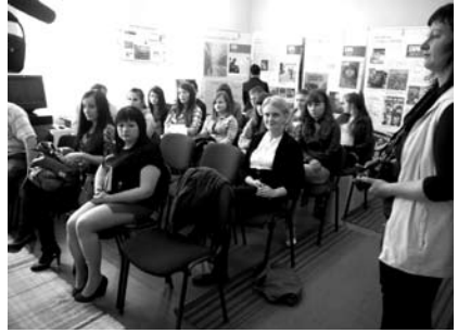
25-26. kép. Megemlékezés, fotókiállítás a könyvtárban