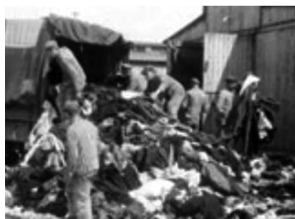
32. kép. Az ide hurcolt zsidó emberektől elkobzott ruhadarabok