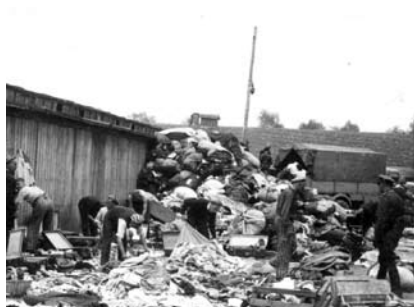
30. kép. Válogatás a barakkok előtt. Elkobzott javak újabb szállítmánya érkezett egy teherautón