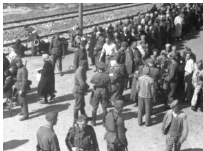
15. kép. A szelekció