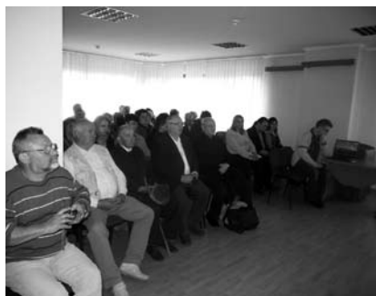
5-8. kép. Európa-Magyar Ház, nemzetközi emlékkonferencia