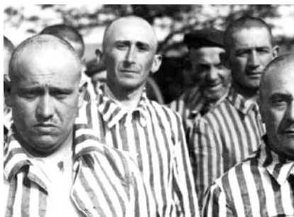
23. kép. Férfi zsidó foglyok