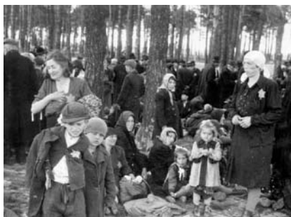
40. kép. Anyák és gyermekeik, miközben a birkenai kiserdőben a halálukra várnak, a krematórium mellett