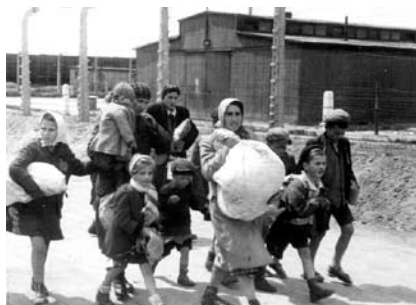
33. kép. Utolsó útjukon