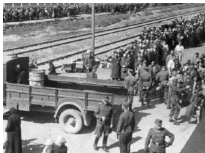
16. kép. A szelekció