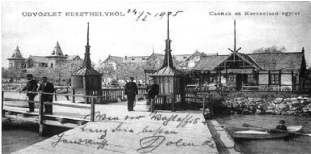
A KCSKE kikötője 1905-ből