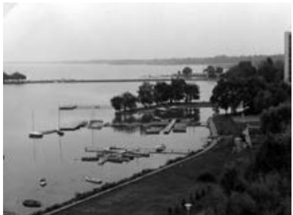
Hotel Helikon és az új partszakasz