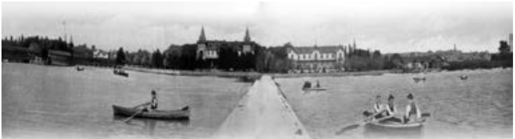
A Hullám Szálló és a Balaton Szálló a mólóról, jobbra a KCSKE épülete. (KYC)

A tagok saját maguk által nyújtott kölcsönökkel tették lehetővé a csónakház és az első csónakok megépítését. A munkák elkészültéig a Polgári Csónakházból kölcsönzött csónakokban gyakorolták az evezést és rendezték az első házi versenyeket. Az elkészült csónakházban nagyterem, öltöző, műhely és toalett kapott helyet. Az „L” alakú épület a mai játszótér előtti szakaszon meghatározta a vízpart hangulatát. A kikötő híd két oldalán fából kialakított tornyos épületekben rendezvények alkalmával a pénztárosok dolgoztak.