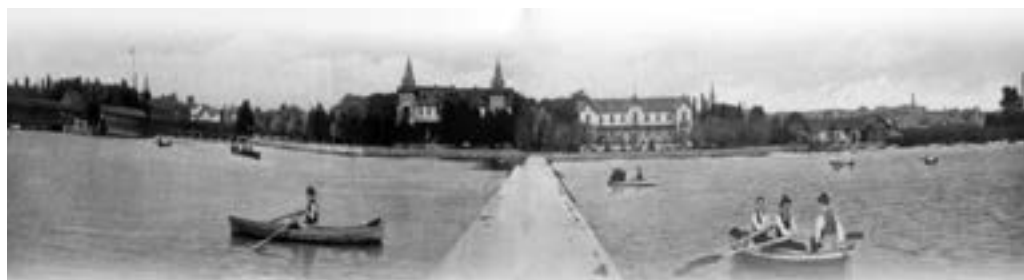
A Hullám Szálló és a Balaton Szálló a mólóról, jobbra a KCSKE épülete. (KYC)

A tagok saját maguk által nyújtott kölcsönökkel tették lehetővé a csónakház és az első csónakok megépítését. A munkák elkészültéig a Polgári Csónakházból kölcsönzött csónakokban gyakorolták az evezést és rendezték az első házi versenyeket. Az elkészült csónakházban nagyterem, öltöző, műhely és toalett kapott helyet. Az „L” alakú épület a mai játszótér előtti szakaszon meghatározta a vízpart hangulatát. A kikötő híd két oldalán fából kialakított tornyos épületekben rendezvények alkalmával a pénztárosok dolgoztak.