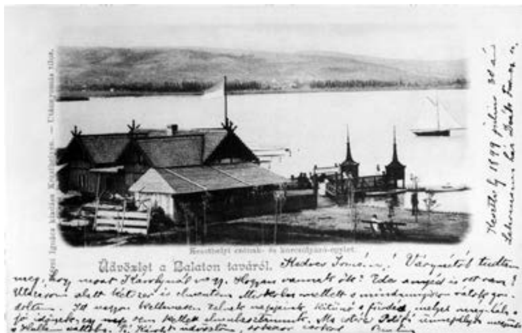
A Keszthelyi Csónakázó és Korcsolyázó Egylet épülete (B.M.)

A csónakház avatásakor 1900-ban már gazdaságilag erős az egyesület. A megalakuláskor felvett kölcsönöket teljes egészében visszafizették, építettek még egy nagyméretű pavilont. Hajóleltárukban: 22 db csónak, 21 db szandolin szerepelt, tagságuk 160 főre emelkedett, ami tovább bővült a Gazdasági Tanintézet Atlétikai Club 80 fős tagságával, 60 koronás éves tagdíjjal a KCSKE-be is beléphettek.