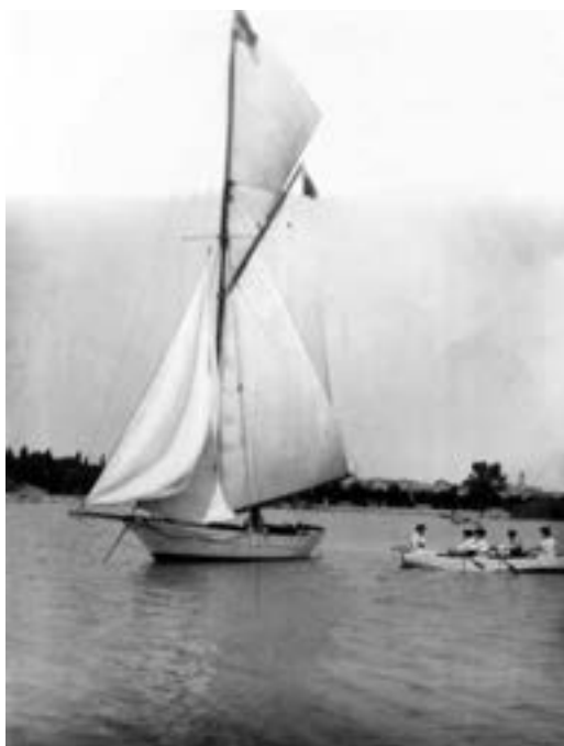
A Festetics család vitorlása

Esténként az egylet a vízitelepén nagy sikerrel üzemeltetett egy Tó-mozit. A filmeket minden alkalommal telt ház előtt vetítették és jó bevételt hoztak.