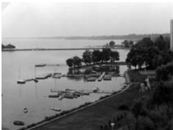
Hotel Helikon és az új partszakasz