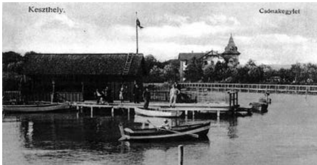
Csónakkölcsönző 1910-ből (B.M.)

Jól kezdődött 1914, a két évvel korábban megalakult Balatoni Yacht Club felvette tagjai közé a Keszthelyi Csónakázó és Korcsolyázó Egyletet, így már indulhattak a BYC rendezvényein.