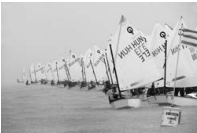
Optimist osztály versenye (Sz.Cs.)