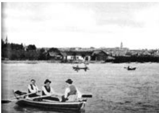
A Keszthelyi-öböl csónakázókkal és a klub épületével.