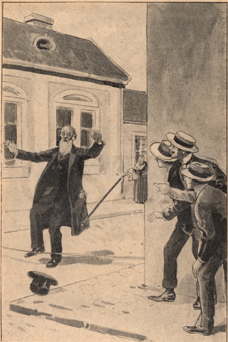
Elgondolkozva jött az öreg és megbottlott a zsinogben. Kevés hijján orra bukott. Kalapja és botja messze röpült.