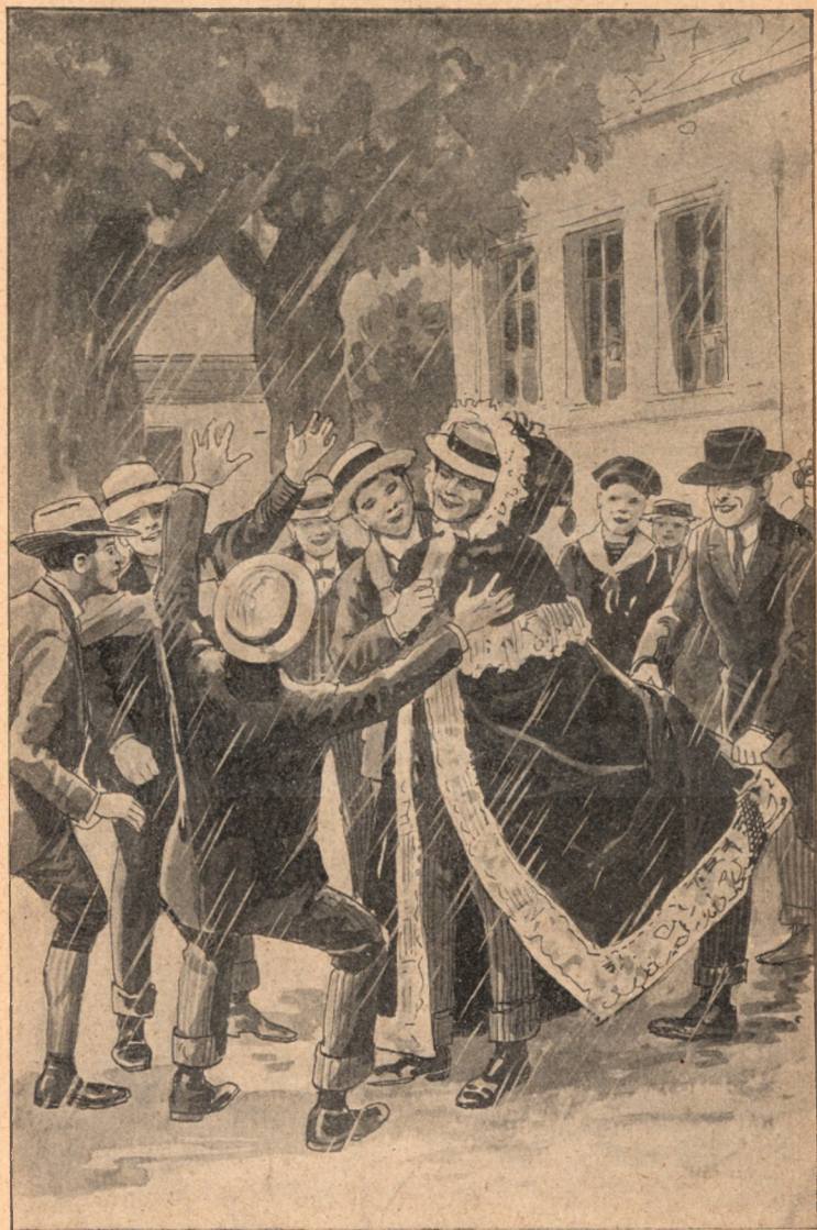
Maguk közé fogták, ide-oda lökdösték, miközben a gallér mulatságo- san lebegett a szélben.