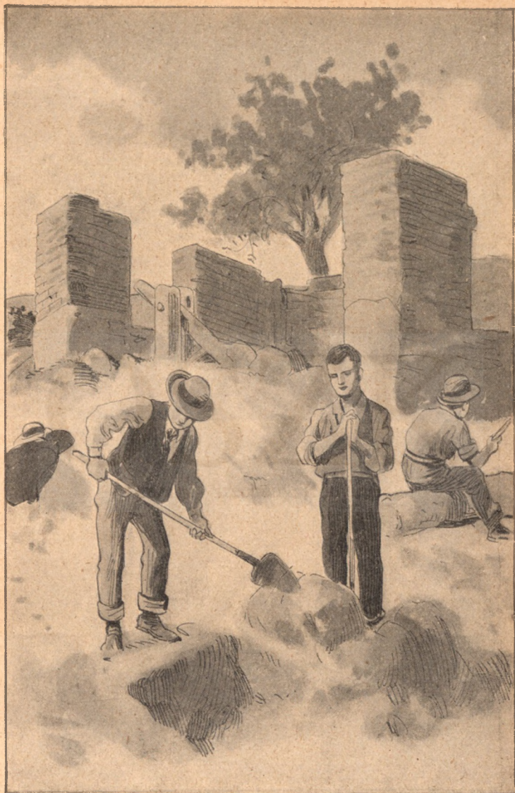
Futóárkokat ástak a vár környékén, faltörő kosokat csináltak. Ezerféle módon próbálták megejteni az ellenséget.