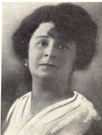
Dienzlné Rác Ena