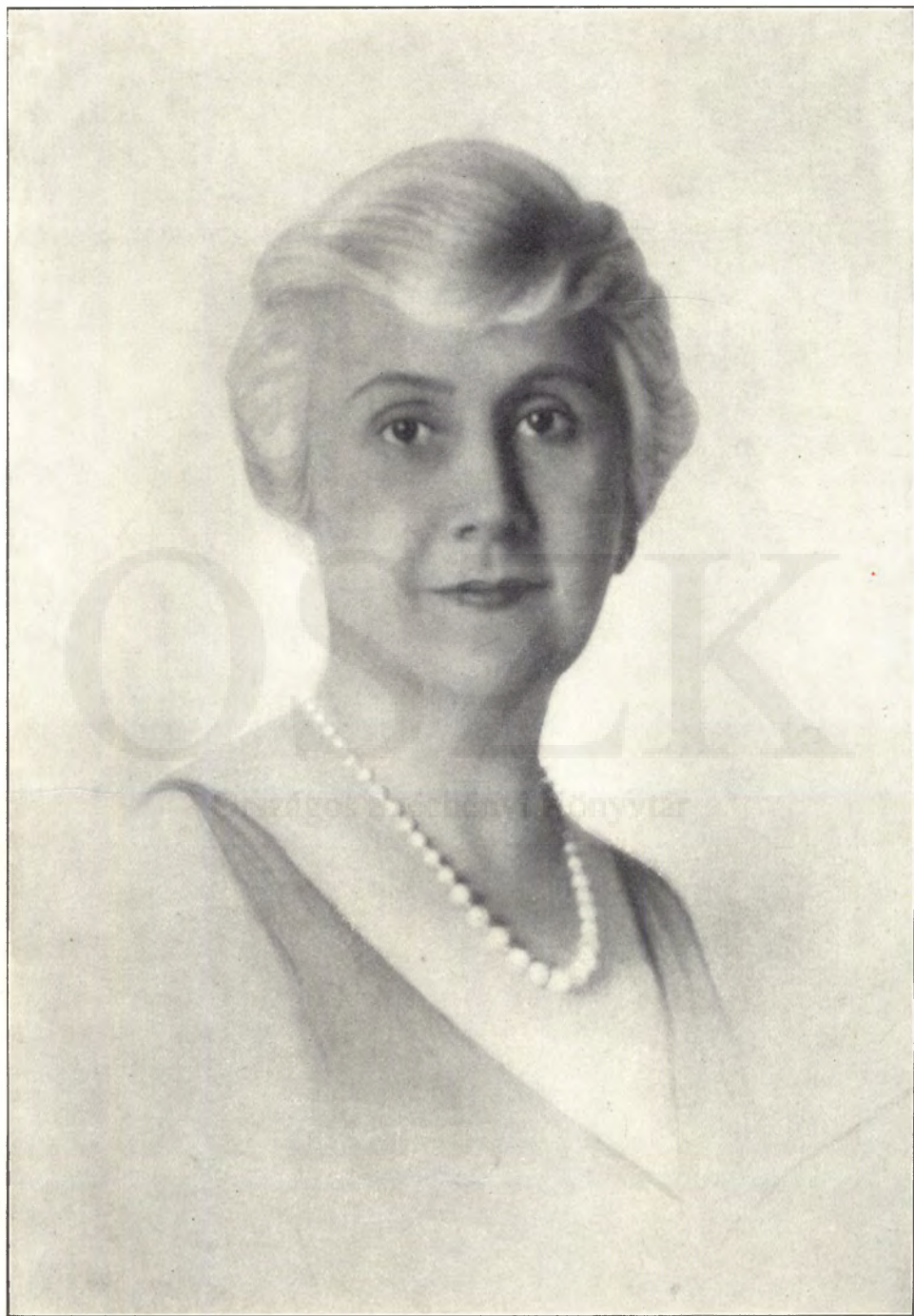
nagybányai vitéz Horthy Miklósné