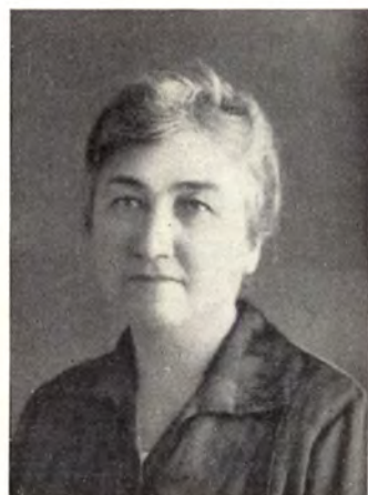
Gr. Gatterburg Aurélné