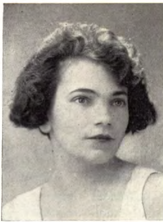
J. Viraág Ilus