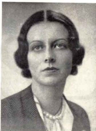
Odescalchi Károlyné hercegnő