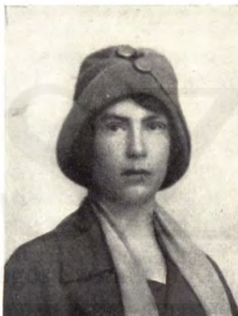
Mária Raineria Magdolna főhercegnő