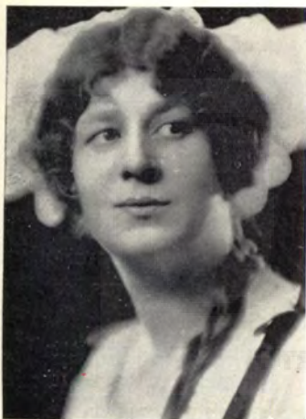
Adler Aquila Adelina