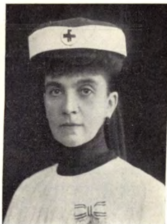
noralli Konek Emilné