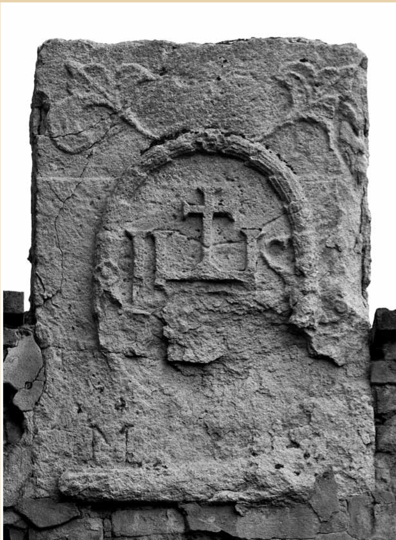
A sárospataki jezsuita rendház kapujának IHS címerfaragványa 1705-ből

A sárospataki Római Katolikus Egyházi Gyűjtemény kőtára