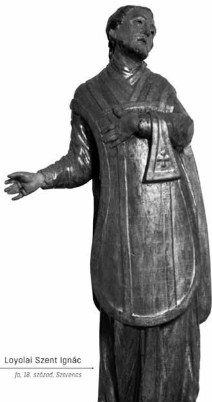
Loyolai Szent Ignác