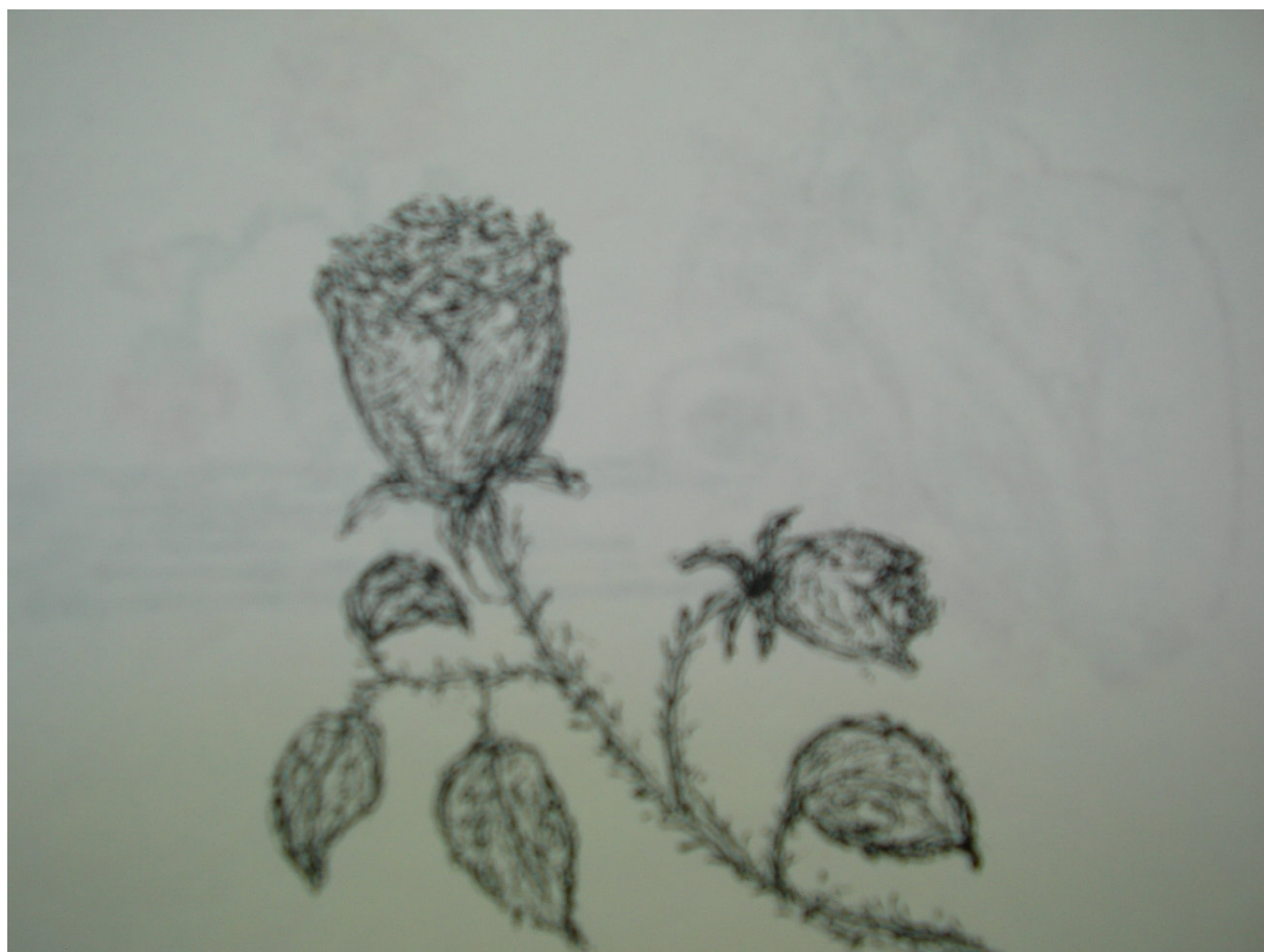
Egy szál rózsza