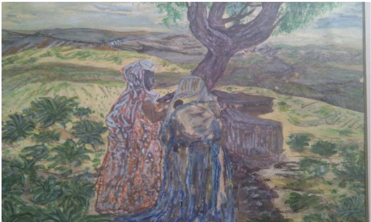
Asszonyok a kútnál