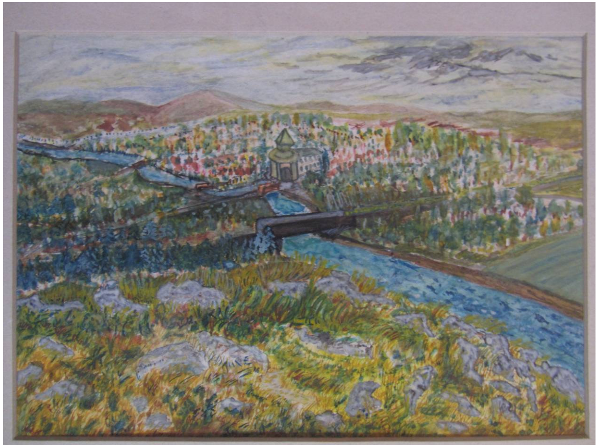
N.N. város látképe