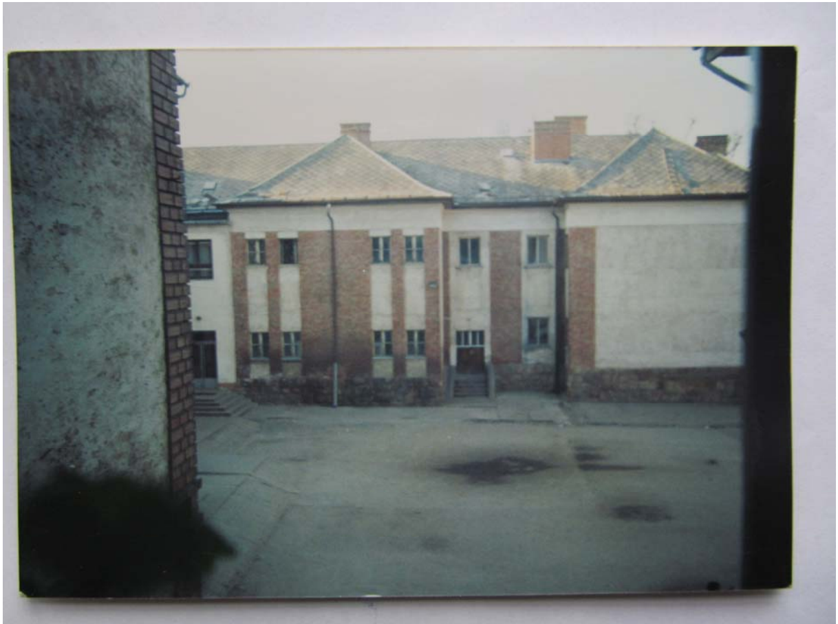
A Templom téri általános iskola, Pilisvörösvár