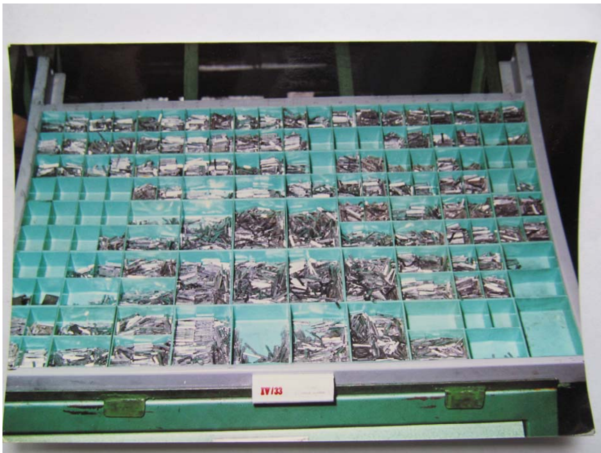
Ólombetűket tartalmazó betűszekrény