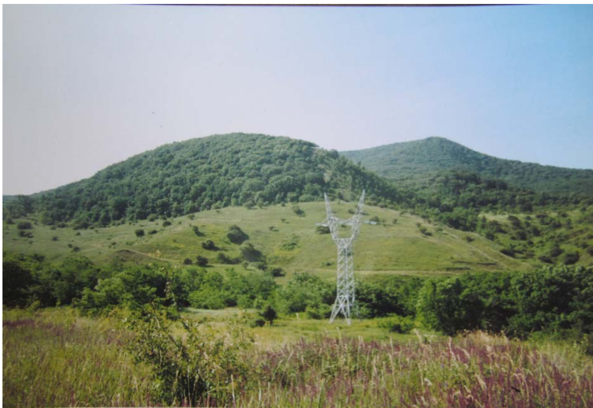
A Kis-Gete Tokodaltáró határában