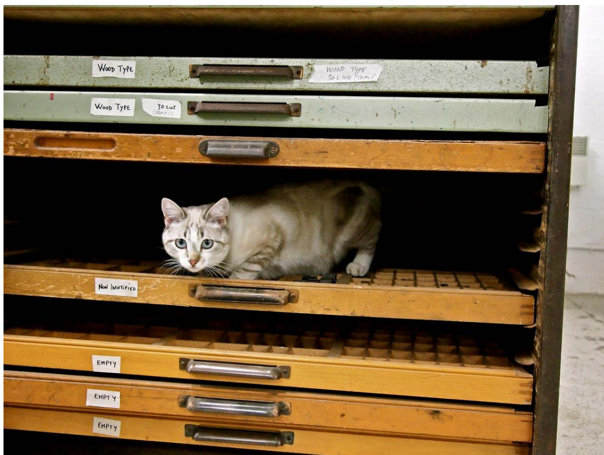
Régimódi, fából készült betűszekrények