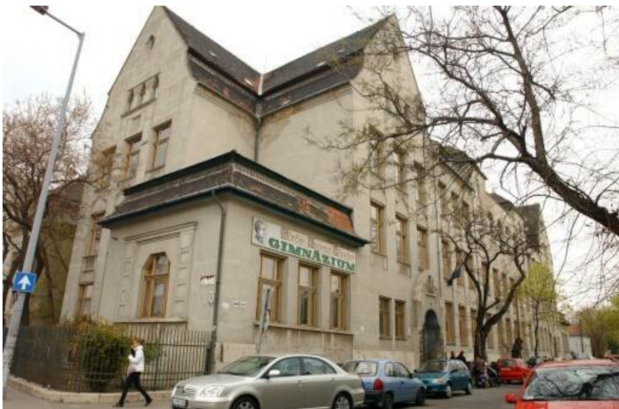
A Körösi Csoma Sándor Gimnázium