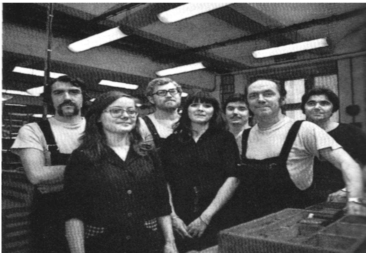
Belső (udvarra néző) terem