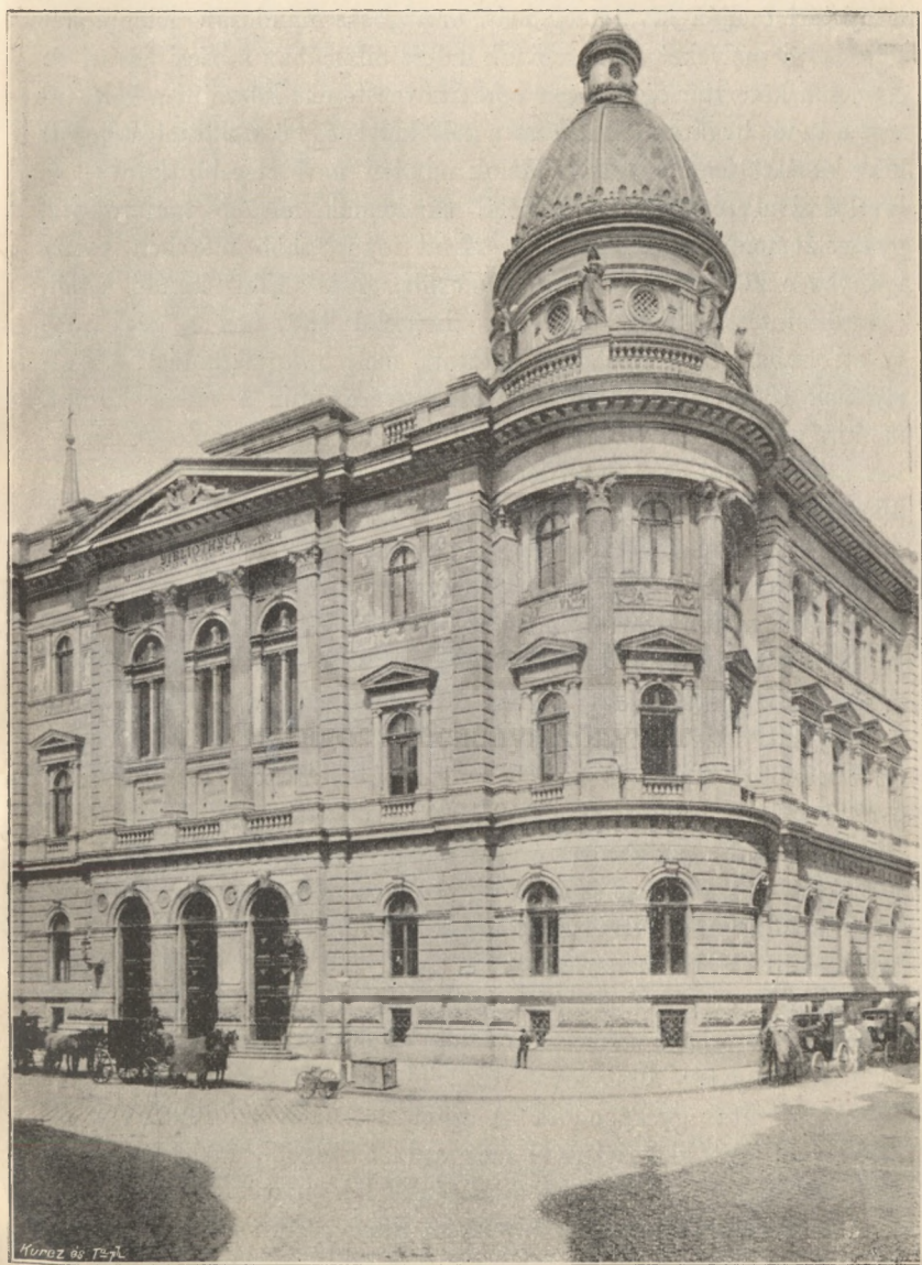
A BUDAPESTI EGYETEMI KÖNYVTÁR ÉPÜLETE 1876.