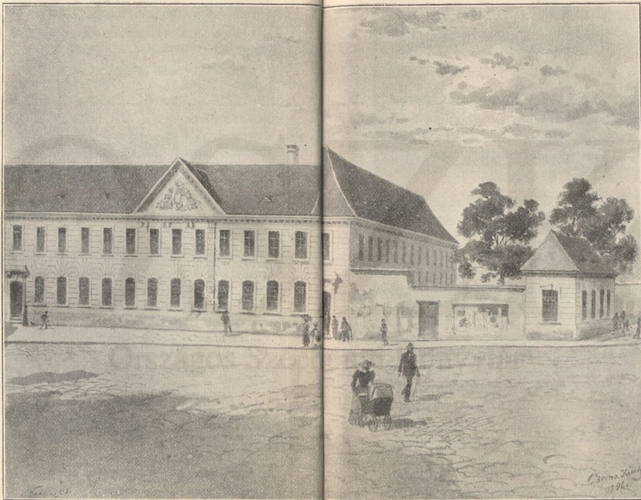
A BUDAPESTI EGYETEM TÁR ÉPÜLETE 1784—1875.

a könyvtár. Az így támadt legérzékenyebb, irodalmi hézagok későbbben sem pótolhattak, sőt ez időszak utolsó 8 évében is az időnként felmerülő szükségletek szemmel tartásával csak a tankönyvirodalomban tartott egyenlő lépést a könyvtár, természetesen a már nagyobb dotáció