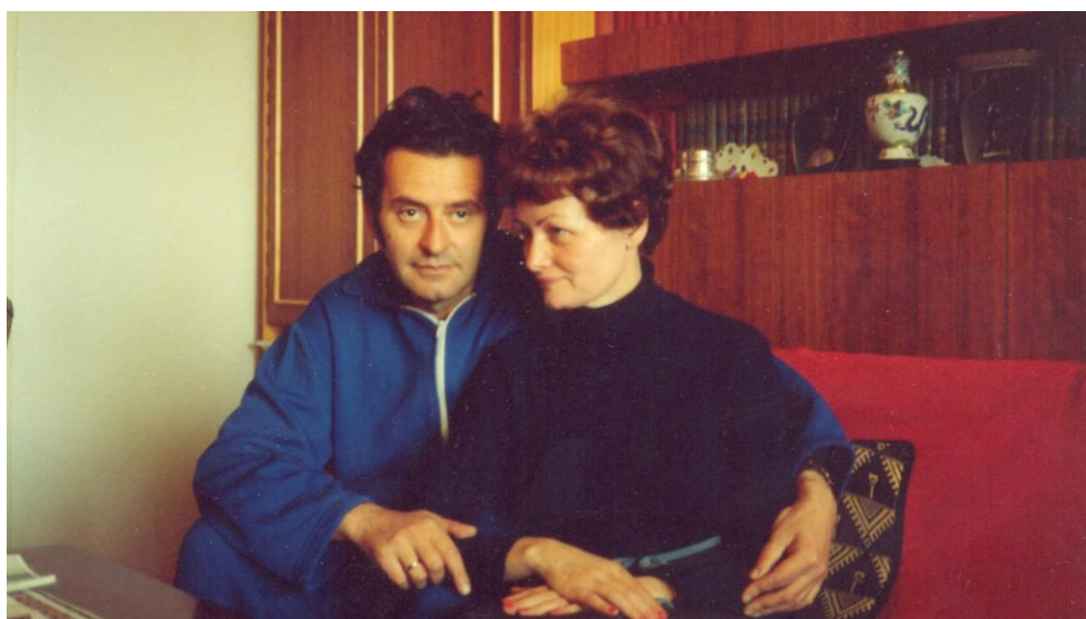
Mi ketten (1963. Debrecen és 1983. Budapest)