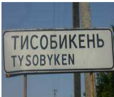
4. kép Tiszaabökény hivatalos közúti névtáblája

Tiszaabökény esetében a lakott területet jelölő hivatalos szervek által kihelyezett névtábla ukrán településneve ТИСОБИКЕНЬ-ként azonosítja a települést, míg az egyik magyar társadalmi szervezet által kihelyezett üdvözlőtáblán az ukrán neve ТИСОБЕКЕНЬ. A hivatalosan elfogadott névforma a ТИСОБИКЕНЬ (vö. Molnár–Molnár 2005: 101).