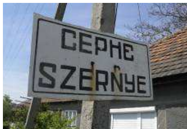
3. kép. Szernye településnévtáblája

Tiszaabökény esetében a lakott területet jelölő hivatalos szervek által kihelyezett névtábla ukrán településneve ТИСОБИКЕНЬ-ként azonosítja a települést, míg az egyik magyar társadalmi szervezet által kihelyezett üdvözlőtáblán az ukrán neve ТИСОБЕКЕНЬ. A hivatalosan elfogadott névforma a ТИСОБИКЕНЬ (vö. Molnár–Molnár 2005: 101).