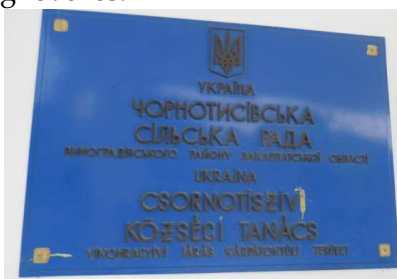
9. kép. A Feketeardói Községi Tanács névtáblája

A magyarlakta települések az utcanév-táblák tekintetben viszonylag jól ellátottak, azonban néhány településen vannak olyan utcák, amely esetében hiányzik, vagy csak annyira rossz állapotban van, hogy alig vagy egyáltalán nem olvasható az utca neve.