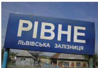
2. kép. Szernye vasúti megállójának táblája