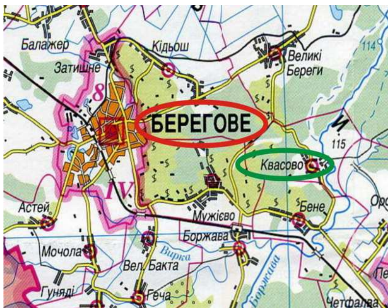
1. ábra. Eltérések az egyes települések ukrán névváltoztatának használatát illetően (ДНВП «КАРТОГРАФІЯ», 2007)

napság is találkozunk olyan kiadványokkal, ide tartoznak az Ukrajnai Kartográfiai vállalat kiadványai is, melyek helytelenül tüntetik fel az egyes települések ukrán nevét, megtévesztve az olvasót (1. ábra). Igaz ugyan, hogy csak egy betű eltérés van Beregszász ukrán nevében, de 1995-től hivatalosan Берегове -nak írjuk ukránul Beregszászt, Kovászó neve viszont helyesen van feltüntetve, hiszen egy időben változtatták meg ukrán végződését -e -ről -o -ra.