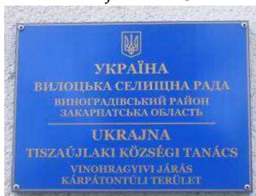
8. kép. A Tiszaújlaki Községi Tanács névtáblája

NOVE SELOI, FANCSIKOVOI, VERBOVECI községi tanácsokról, illetve VINOHRAGYIVI JÁRÁSról és KÁRPÁTON-TÚLI TERÜLETről. A megye nevének ezen változatú feltűntetésével elvétve a Munkácsi és Ungvári települések névtábláin is találkozhatunk. A megyei nevének egy másik alakja is feltűnik a névtáblákon a Munkácsi és Beregszászi járásokban, mégpedig a Kárpátalja és a Kárpátontúli terület vegyítéséből, a KÁRPÁTALJAI TERÜLET megnevezés.