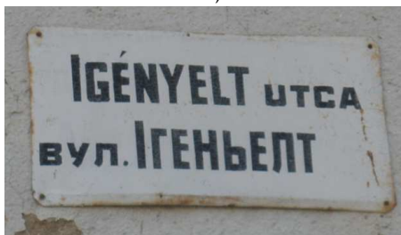
13. kép. Az Igényelt utca névtáblája Nagyberegen

Nagybereg utcanév-tábláit jellemzően a magyar nyelvű nevéből transliterálták át ukrán nyelvére, így lett az ERDŐ ЕРДИВ , a RÖVID PIVÍD , a NAGYSZER НАДЬСЕР , a TÓSZEG ТОВСЕГ , az IGÉNYELT ІГЕНЬЕЛТ , az ÉGER ЕЙГЕР utca stb.