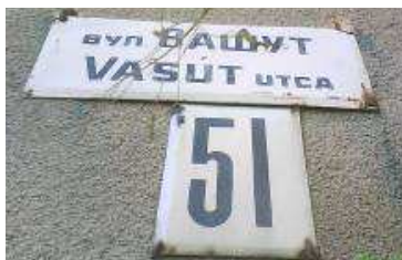
10. kép. A Vasút utca névtáblája Bátyúban

2. A magyar elnevezést értelemszerűen fordítják le. Borzsova településen például a Vasút utca ukrán fordítása вул. Залізнична .