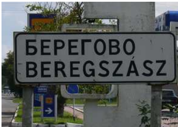
2. ábra. Beregszász névtáblája (2008.06.02)