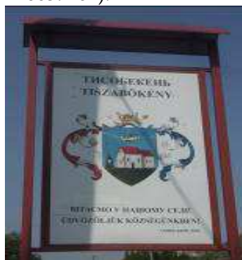
5. kép Tiszaabökény kulturális névtáblája

Ha Tiszaújlakra Beregszász felől érkezünk, akkor a település magyar neve az ukránból visszatranszliterált VILOK, míg Nagyszőlős felől érkezve TISZAÚJLAK.