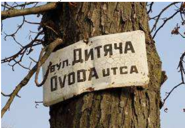
13. kép. Az Óvoda utca (?) névtáblája Gáton

II. Rákóczi Ferenc utca esetében az ukrán fordításnál elmarad a római szám. Ennél sokkal nagyobb a különbség Gát településen, ahol az Óvoda utca -t вул. Дитяча -ként fordítják le, vagyis Óvoda utca -ból Gyermek utca lesz.