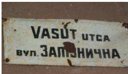
11. kép. A Vasút utca névtáblája Borzsován

Nagybereg utcanév-tábláit jellemzően a magyar nyelvű nevéből transliterálták át ukrán nyelvére, így lett az ERDŐ ЕРДИВ , a RÖVID PIVÍD , a NAGYSZER НАДЬСЕР , a TÓSZEG ТОВСЕГ , az IGÉNYELT ІГЕНЬЕЛТ , az ÉGER ЕЙГЕР utca stb.