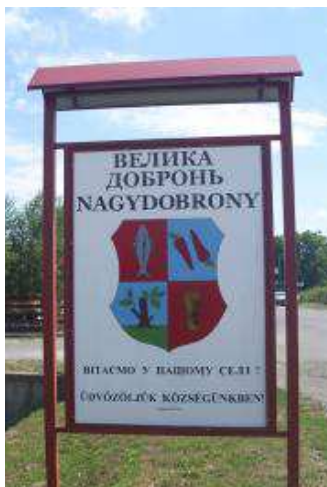
6. és 7. kép. Nagydobrony KMKSZ (balra) és UMDSZ (jobbra) által kihelyezett kulturális névtáblája