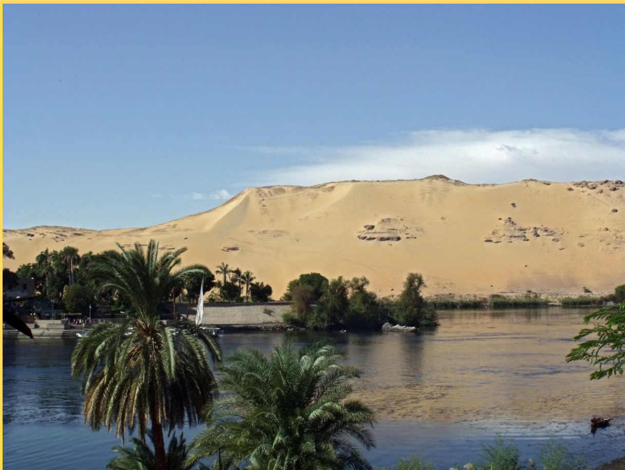
"Arany hegy a Nílus parton" (Egyiptom)