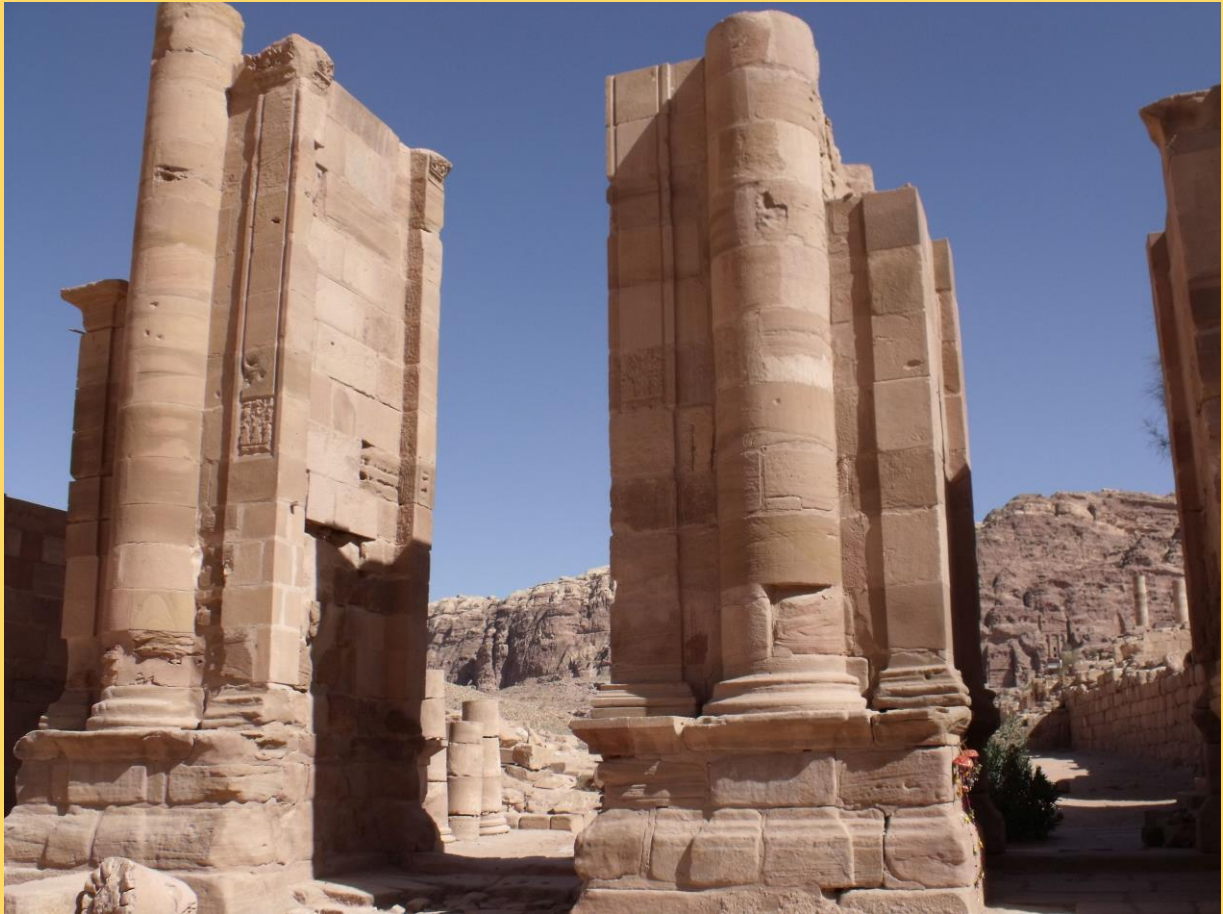
"Aranykor" (Jordánia, Petra)