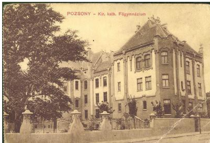
1. kép A főgimnázium új épülete