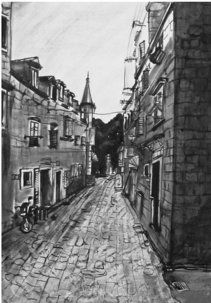
SZOKODI VERONIKA: SIKÁTOR I. (részlet)