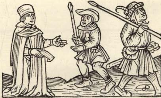
Aus Nr. 231. Huss. Bluthandel. ( \frac{1}{2} d. Orig.-Grösse.)