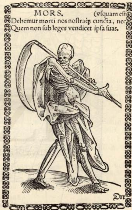
Aus Nr. 256. Necker. Stammbüchlein. ( \frac{1}{2} d. Orig.-Grösse.)