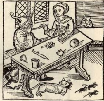
Aus Nr. 169. Brant. Stultifera navis. ( \frac{1}{2} d. Orig.-Grösse.)

Hain 3747. Proctor 7775 (fehlt im British Museum). Von Weisbach wird diese Kal. Martiis erschienene 8 o -Ausgabe nicht erwähnt. M. 117 Holzschn. von dem Meister d. Bergmannschen Offizin, der eine auf fol. xiiij datiert 1494. Von einigen ganz geringen Wurmstichen auf den ersten 3 Bl. abgesehen sehr schönes Ex. d. seltenen Ausgabe.