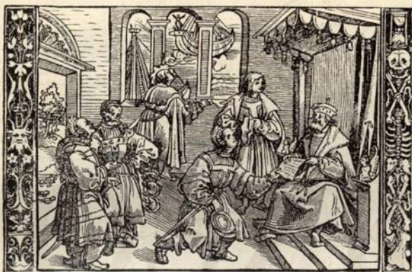
Aus Nr. 239. Justinus. Hystorien . ( \frac{1}{4} d. Orig.-Grösse.)

Hain-Copinger 9609. Proctor 2061. Hase 122. Sehr schönes Exemplar. Der Holzschn. auf fol. 4 vorzügl. altkoloriert, darunter ein in Farben u. Gold ausgeführtes Initial H . Am Ende wurmstichig.