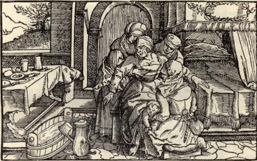
Aus Nr. 335. Xenophon. ( \frac{1}{2} d. Orig.-Grösse.)

335 Xenophon. Commentarien vnd beschreibungen / von dem leben vñ heerzug / Cyri des ersten Königs in Persien etc. Uebers. v. H. Boner.