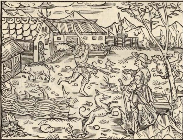
Aus Nr. 257. Odyssea.

Vergl. Rivoli S. 184, wo diese Ausg. nicht verzeichnet ist. Titel in Holzschn.-Einfassung, 1 Himmelskarte, 58 Holzschn. — wahrscheinl. nach Zeichn. v. Ben. Mon-