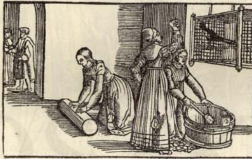
Aus Nr. 296. Der Ritter vom Thurn.

1. Titelbl. u. Bl. A 8 fehlt, Bl. Q mit Textverlust beschädigt. — a) Goedeke II. S. 498, Nr. 33. Erste Ausg. M. Holzschn. — b) Vergl. Goedeke II. S. 443, der diese Ausg. nicht kennt. Titelbl. fehlt. — c) Fehlt bei Goedeke. — Z. T. stark fleckig.