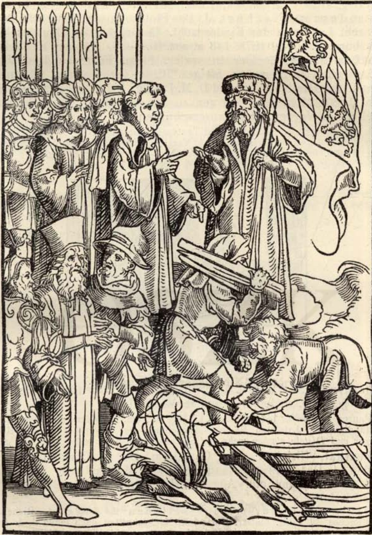
Aus Nr. 294. Richenthal. Concilium. ( \frac{1}{2} d. Orig.-Grösse.)

des wetters aygentlich vnnnd augenscheynlich wissen vnd erkennen mag. O. O., Dr. u. J. (Nürnberg, J. Gutknecht, 1510—20). 7 n. gez. Bl. 4. Lwdb.