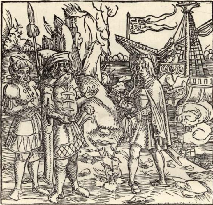
Aus Nr. 178. Historia von Rhodis.