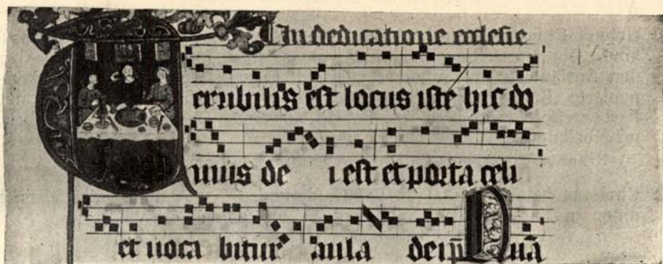
Aus Nr. 91. Der Schmaus. 15. Jahrh. (Der obere Teil des Blattes.)