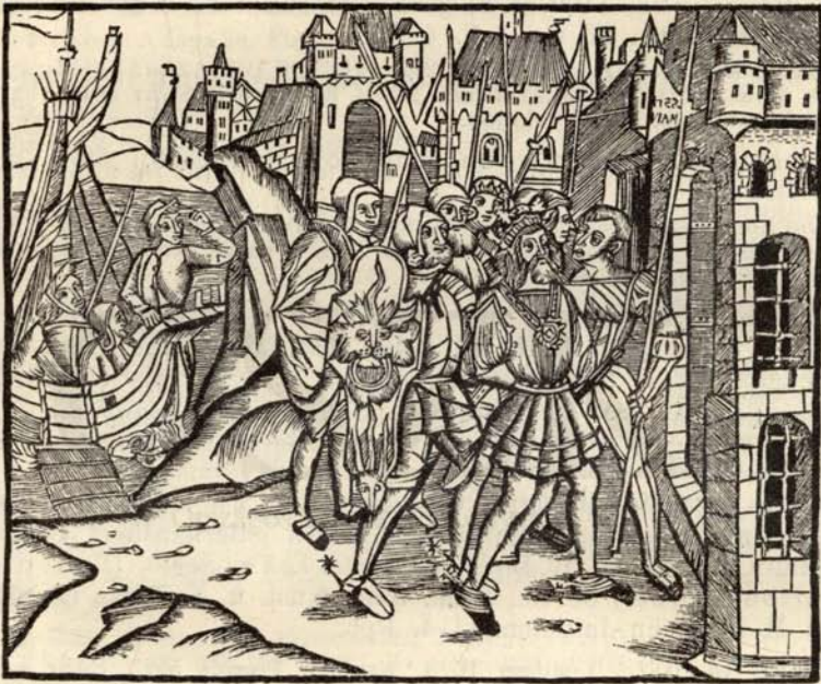
Aus Nr. 155. Barbarossa.

Auf dem 1. Bl. ein Holzschn., auf dem letzten d. Druckermarke. Mit d. hs. Eintragung: Jo. Abhauser augustinus artium magister et Decretorum lector Wienn. studii M. D. XIII , von dessen Hand auch die zahlr. hs. Marginalien.