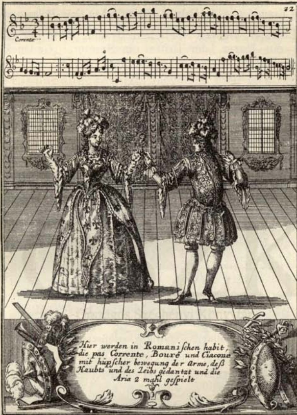
Aus Nr. 345. Lambranzi. Tantz-Schul. ( \frac{1}{4} d. Orig.-Grösse.)