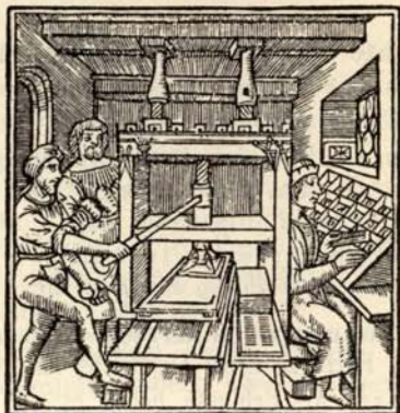
Aus Nr. 180. Chassanaeus. Catalogus. ( \frac{1}{2} d. Orig.-Grösse.)