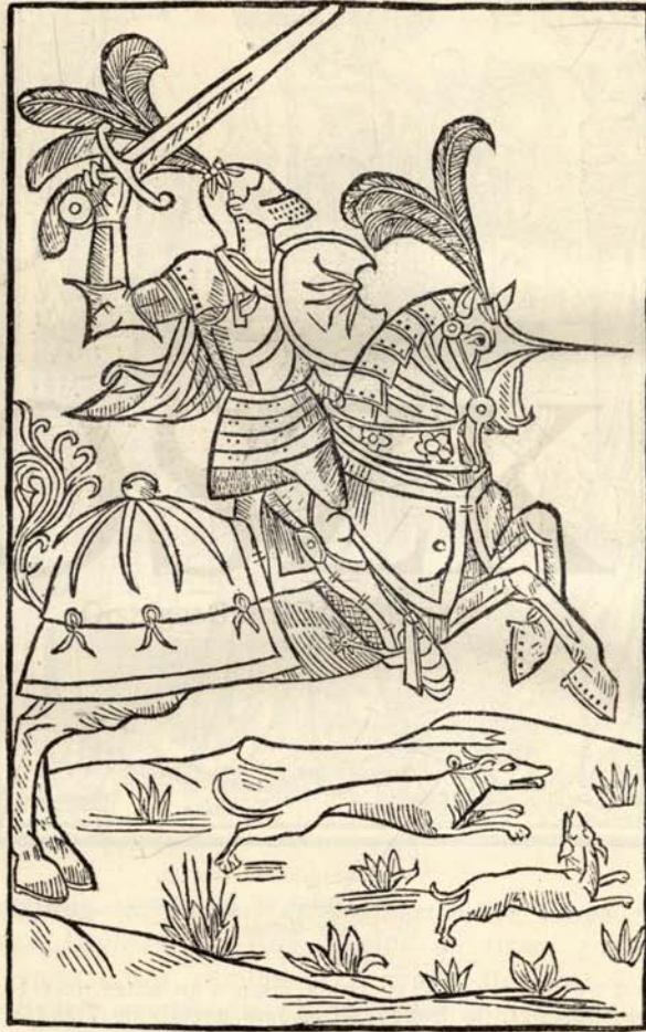
Aus Nr. 233. Illustrations de Gaule.

Rivoli S. 381. M. zahlr. Holzschn. Rot u. schwarz gedruckt. Interessant wegen des ersten Besitzers, dessen Autograph sich auf d. Innenseite d. Vorderdeckels befindet: „ Ex Bibliotheca Georgij Tury m. p. Anno 1539 “. Es ist dies der berühmte ung. Feldherr in den Türkenkriegen u. Befehlshaber v. Palota u. Kanizsa. (Gleichz. Lieder auf Thury s. bei Goedeke S. 306, Nr. 236 u. S. 307, Nr. 243.) Die Initialen s. Namens auf d. Rückdeckel d. schönen gleichzeit. Einbandes.