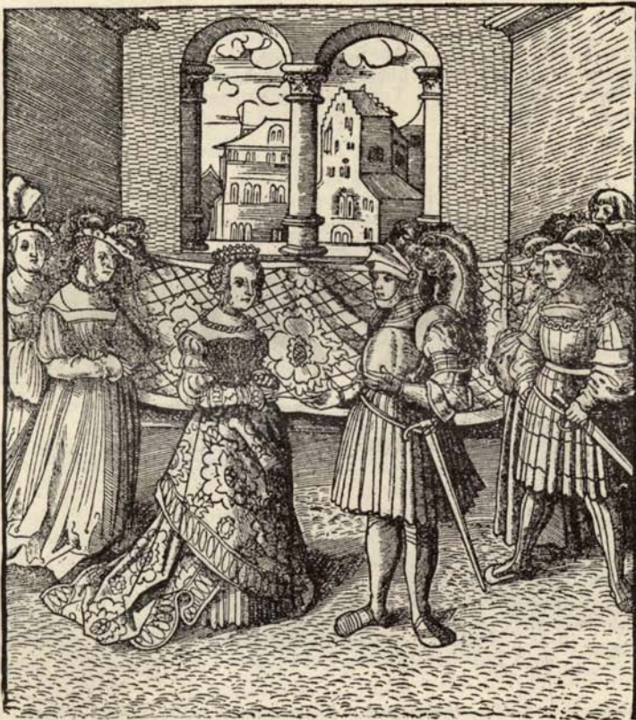
Aus Nr. 281. Pontus u. Sidonia. ( \frac{2}{3} d. Orig.-Grösse.)

Aeusserst seltene Ausg. d. berühmigten Buches von Puy-Herbaut (Brunet IV. 989, Reusch, Index I. 284). Auf S. 117 u. 118 ein vehementer Ausfall gegen die Genfer Schriftsteller u. Rabelais. Der Verf. wollte sich dieser Art an Rabelais rächen, der in seinem Pantagruel (IV. B. 32. Kap.) von dem „enragez Putherbes“ spricht. M. zahlr. deutschen Versen.