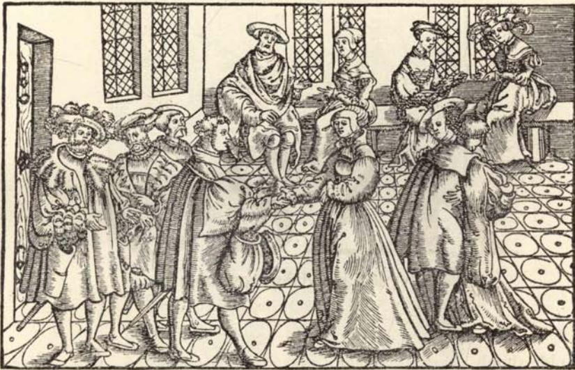
Aus Nr. 220. Haimonskinder.

Titelbl. rot u. schwarz gedruckt. M. zahlr. Holzschn. v. Urse Graf. Tadello's erhaltenes Exemplar. Auf d. Rückseite d. Titels am unteren Rande Dublettenstempel d. Hof- u. Staatsbibl. München.