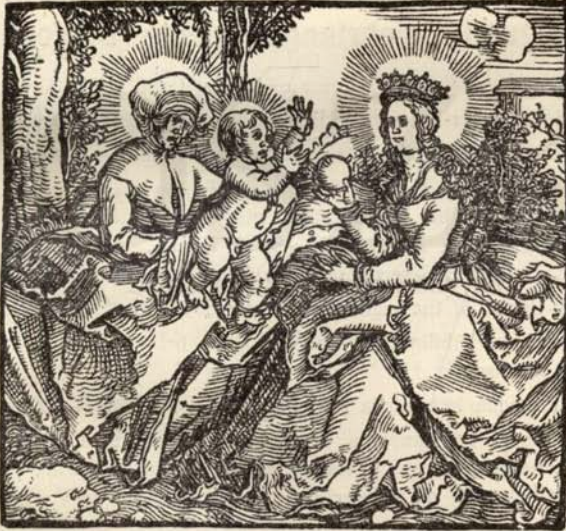
Aus Nr. 330. Weiditz. (Orig.-Grösse.)

358 — 2 lose Einbanddecken (15. Jahrh.) u. 1 St. a. d. 16. Jahrh. Leder. 8. Stark beschädigt.