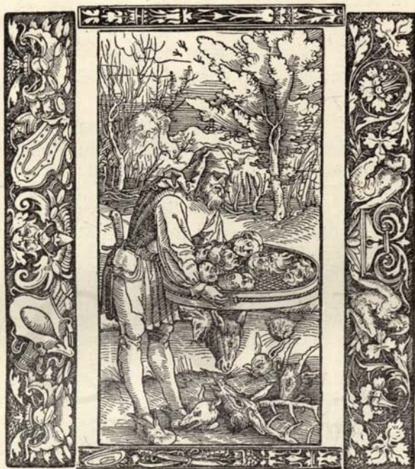
Aus Nr. 184. Cicero. Officia. ( \frac{1}{4} der Orig.-Grösse.)