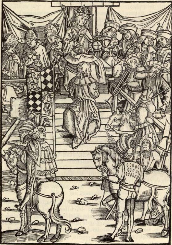
Aus Nr. 334. Wyle. Transzlatzion. (1/2 d. Orig.-Grösse.)

334 Wyle, Nikolaus von. Transzlatzion oder tûtschungē . . . etlicher bûcher Enee siluij : Pogij floretini : Felicis hemerlin : doctoris . Mit sampt andern