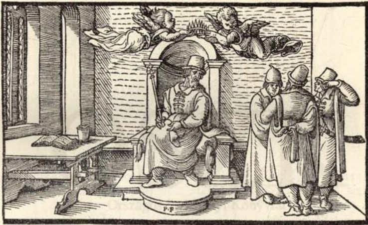
Aus Nr. 230. Der Hungern Chronica. ( \frac{1}{2} d. Orig.-Grösse.)

230 Der Hungern Chronica | inhaltend wie sie anfengklich ins | land kommen sind / mit anzeygung aller irer König / | vnd was sie namhafftigs gethon haben. Angedan | gen von irem ersten König Athila / vñ volfüret | bisz