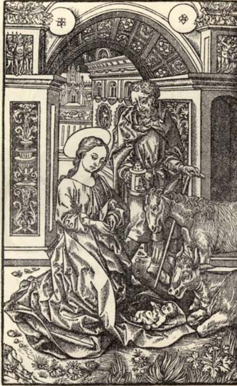
Aus Nr. 225. Heures de Paris. ( \frac{2}{3} d. Orig.-Grösse.)

Goedeke II. S. 320, 8. M. unzähl. Holzschn. deutscher u. Schweizer Meister, darunter d. Monogr. H. H. (Heinrich Holzmüller, Nagler, Monogr. III. Nr. 1041). Die Holzschn.-Vignette (Nagler l. c. Nr. 3) m. d. Patron kolorirt. Die Bl. s 3 u. s 4 , bb 5 u. bb 6 fehlen.