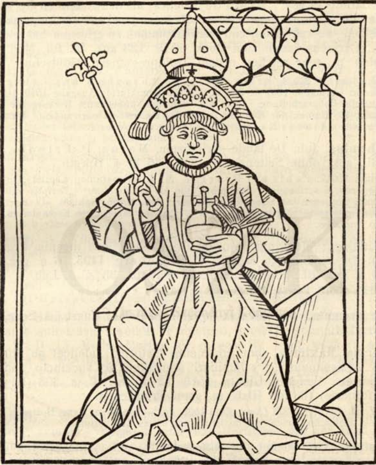
Aus Nr. 317. Thurócz. Chronica Hung. Brünn 1488.

Hain 15518. Proctor 1874. Szabó III. 1. 15. M. 66 Holzschn., u. z. Wappenschild auffol. 1b. blattgr. Darst. d. Kampfes Ladislaus d. H. m. d. Kumanen auffol. 2a, 41 altkolor. Abbild. d. ung. Könige, 1 blattgr. Darst. d. Einzuges d. Tartaren in Ungarn u. 22 kl. altkolor.