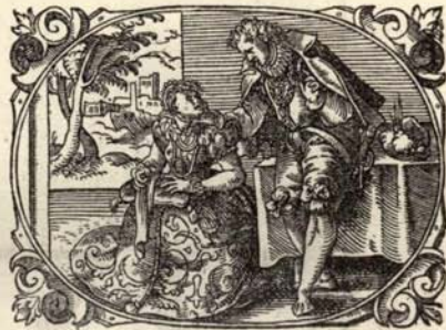
Aus Nr. 176. Buch der Liebe. ( \frac{2}{3} der Orig.-Grösse.)

Hain-Copinger 4027. Proctor 7180. Sehr seltener Vicentiner Druck. Interessantes Werk. Eine Reihe von Bl. wasserfleckig.