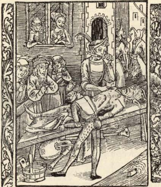
Aus Nr. 210. Geiler. Navicula.