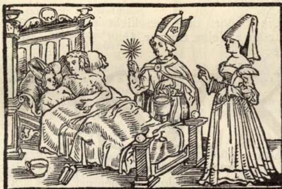
Aus Nr. 253. Melusine.

Auf der Innens. d. Titelbl. d. Holzschn.-Wappen d. Grafen Mansfeld.