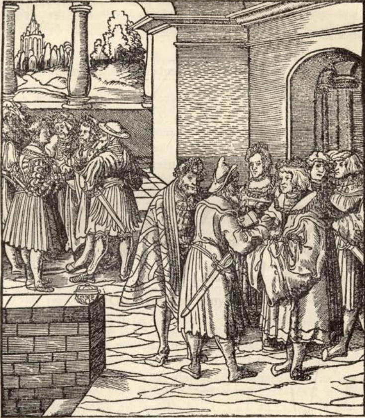
Aus Nr. 192. Dictys. Trojan. Krieg. ( \frac{1}{2} der Orig.-Grösse.)

1543. 2 n. gez. u. 22 gez. Bl. M. fast blattgr. Titelholzschn. u. 1 Holzsch. auf Bl. 1. fol. Hlwd. b.