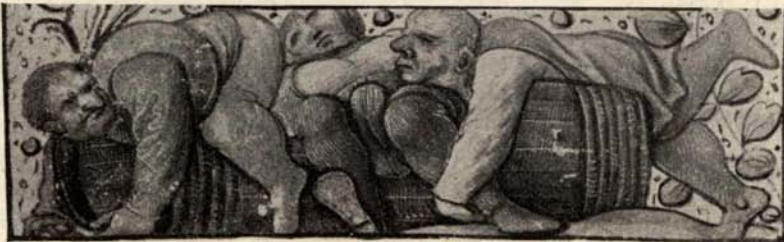
Aus Nr. 38. Livre d'heures de Metz. (Untere Randleiste von Bl. 35.)

Sehr schönes Pendant zur vorigen Nummer u. ebenso sorgfältig ausgeführt. In die leeren Felder einiger Initialen sind kleine, zum Text passende Photographien eingeklebt, z. T. von der Hand der Künstlerin übermalt.