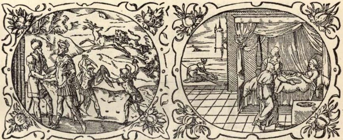
Aus Nr. 135. Amadis.