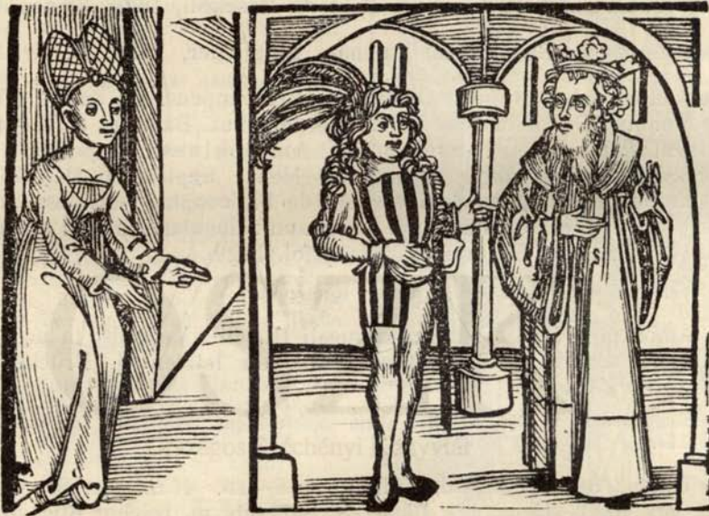
Aus Nr. 280. Pontus u. Sidonia. (Orig.-Grösse.)