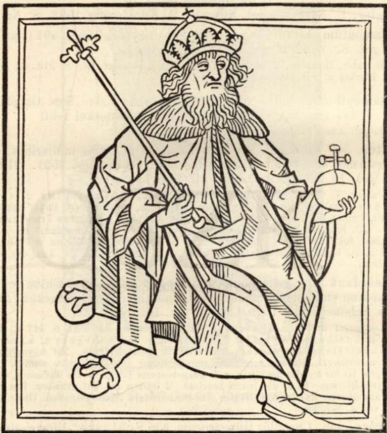
Aus Nr. 317. Thuróc. Chronica Hung. Brünn 1488.