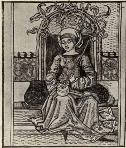
Aus Nr. 318. Thurócz. Chronica Hung. Augsb. 1488.