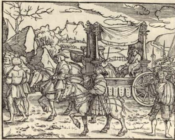
Aus Nr. 245. Livius. Röm. Historien.