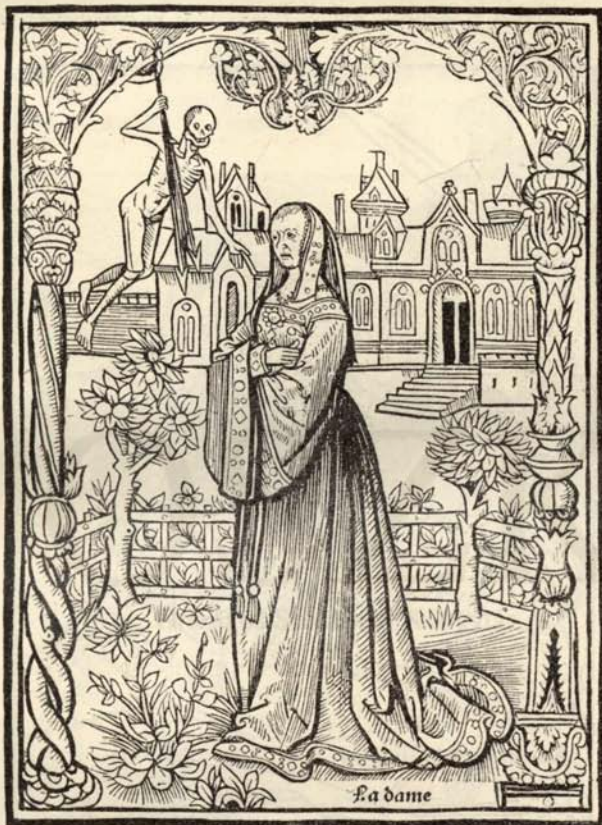
Aus Nr. 232. Jardin de plaisance.

repétant quatre fois. Les „Epitres de l'amant vert“, dans lesquelles l'auteur chante la mémoire du perroquet de Marguerite d'Autriche, mort de chagrin pour avoir été séparé de sa maltresse, sont imprimées à la fin du premier livre des Illustrations. Les premiers ff. et la reliure restaurée. Quelques taches d'eau, du reste bel exemplaire de cette édition rare et estimée. Le f. Aa, (Titre de l'épistre du Roy Hector) manque. A l'intérieur du premier plat l'inscription suivante: Sir Thomas Fairfax of Denton . . . . owner of this Book . C'est l'autographe du célèbre