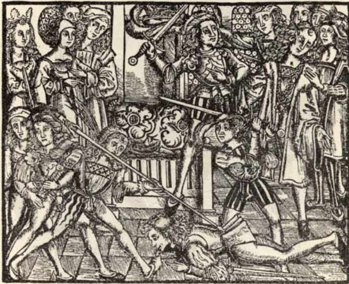
Aus Nr. 229. Hug Schapler. ( \frac{2}{3} d. Orig.-Grösse.)