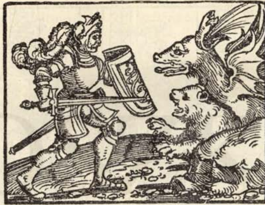
Aus Nr. 221. Heldenbuch. (Orig.-Grösse.)