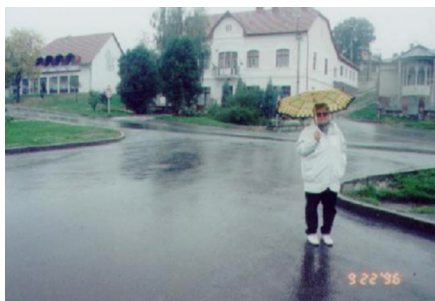
Szendrő gazdag, zsidó része

rás és az emlékezés hangulata szinte harmonizált egymással. A falu mintha üres lett volna, a helybeliek csak futólag néztek utánunk. Talán nem tudták pontosan, de érezték a látogatók kilétét.