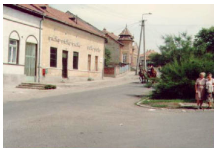
Szendrőn - egy gyerekkori barátnővel