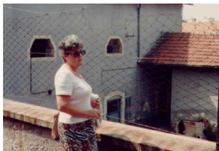
Imaház és a zsidó iskola

Korán reggel gyalog kiment a pusztára, talán egyórás gyalogút távolságra a szekérért és a