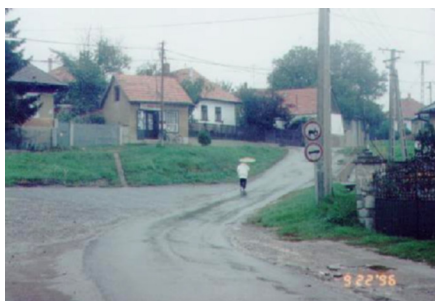
Magányos séta Szendrőn