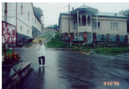
Egy gazdag, zsidó család háza Szendrőn