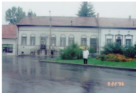
Itt egy nagy, zsidó üzlet működött Szendrőn