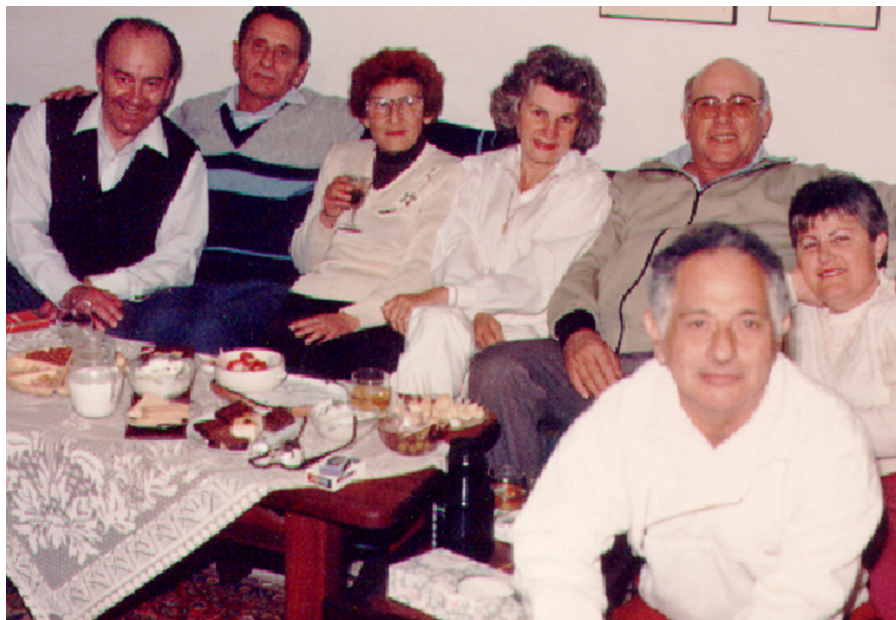
Találkozó 1981-ben a szegedi és a KZ bécsi tábor csapatával