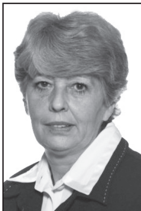
Dobos Krisztina (1949–2013)

2013. december 12-én életének 64. évében súlyos betegség következtében elhunyt Dobos Krisztina oktatáspolitikus, az MDF egyik alapító tagja; szimbolikus jelentőségű, hogy Antall József miniszterelnök halálának 20. évfordulóján.