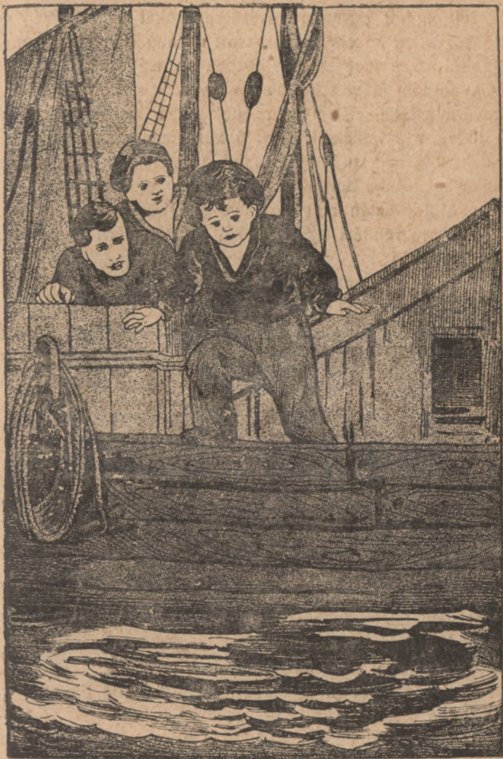
Fleming a kajó korlatjáig hurcolta Jakabot és hiába ellenkezett, belökte a Themis hullámai közé.