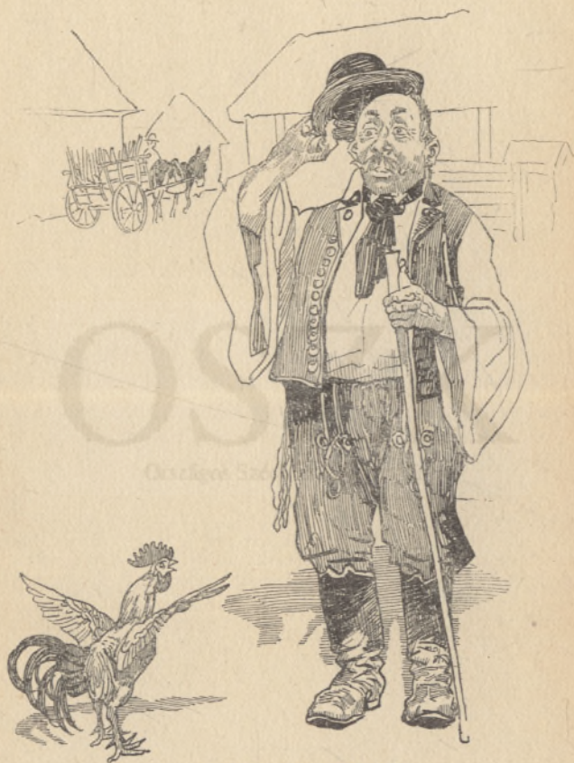
A kis kakas és a bíró úr.