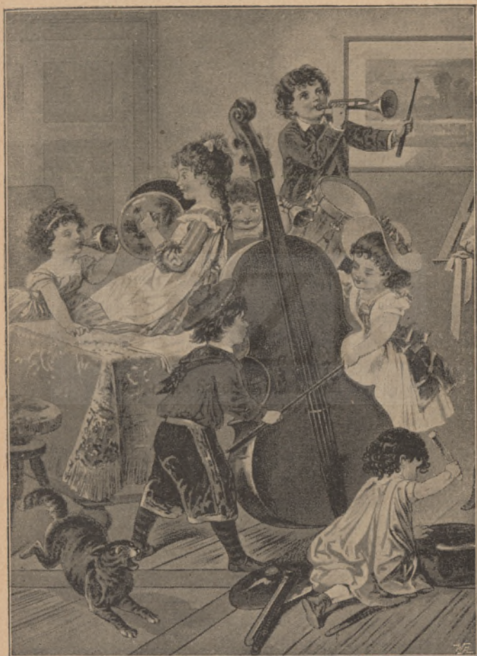
A hangverseny. (Szövegét lásd a 3. oldalon.)