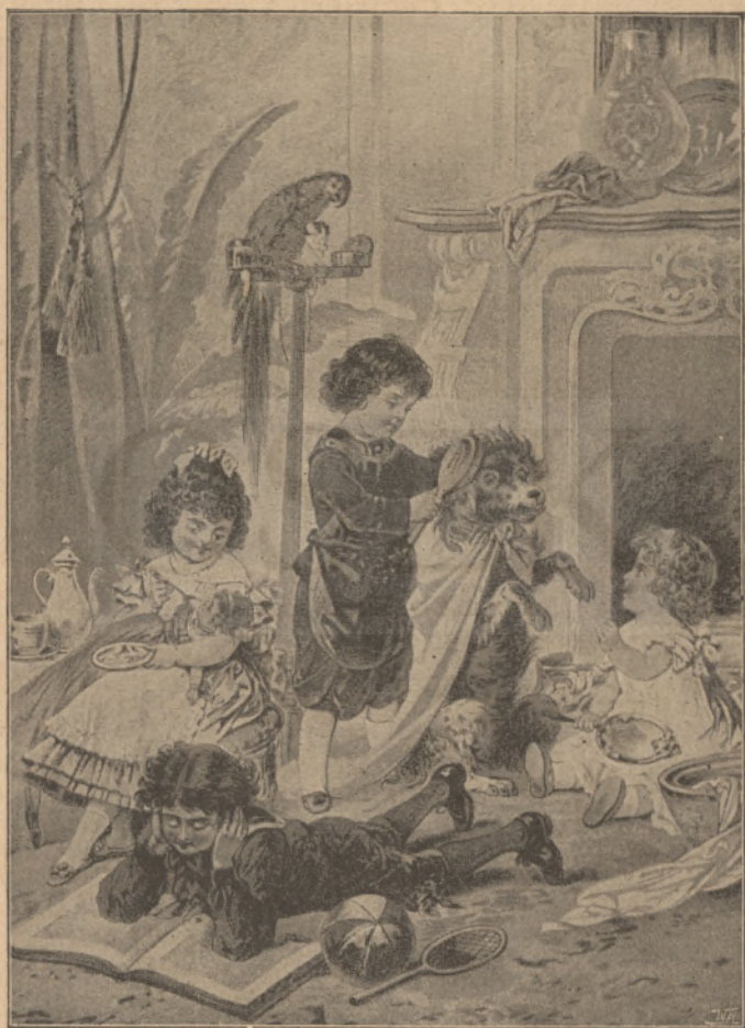
Csak állat! (Szövegét lásd az 59. oldalon.)