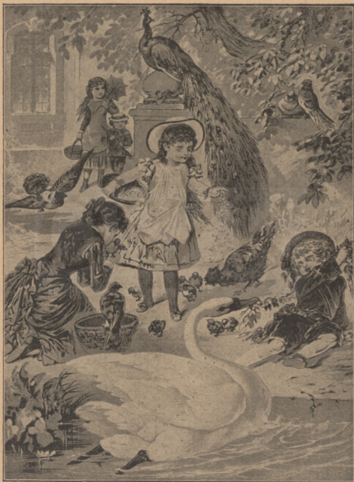
A hattyu. (Szövegét lásd a 24. oldalon.)