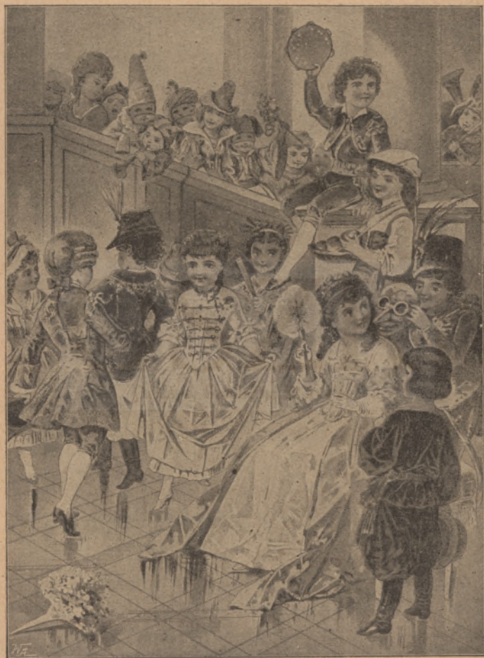
Gerda születésnapja. (Szövegét lásd a 44. oldalon.)