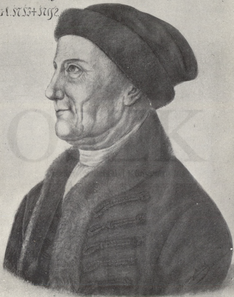
GRÓF RÁDAY GEDEON. (I.)