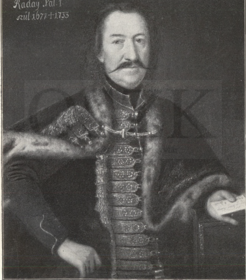
RÁDAY PÁL. (I.)