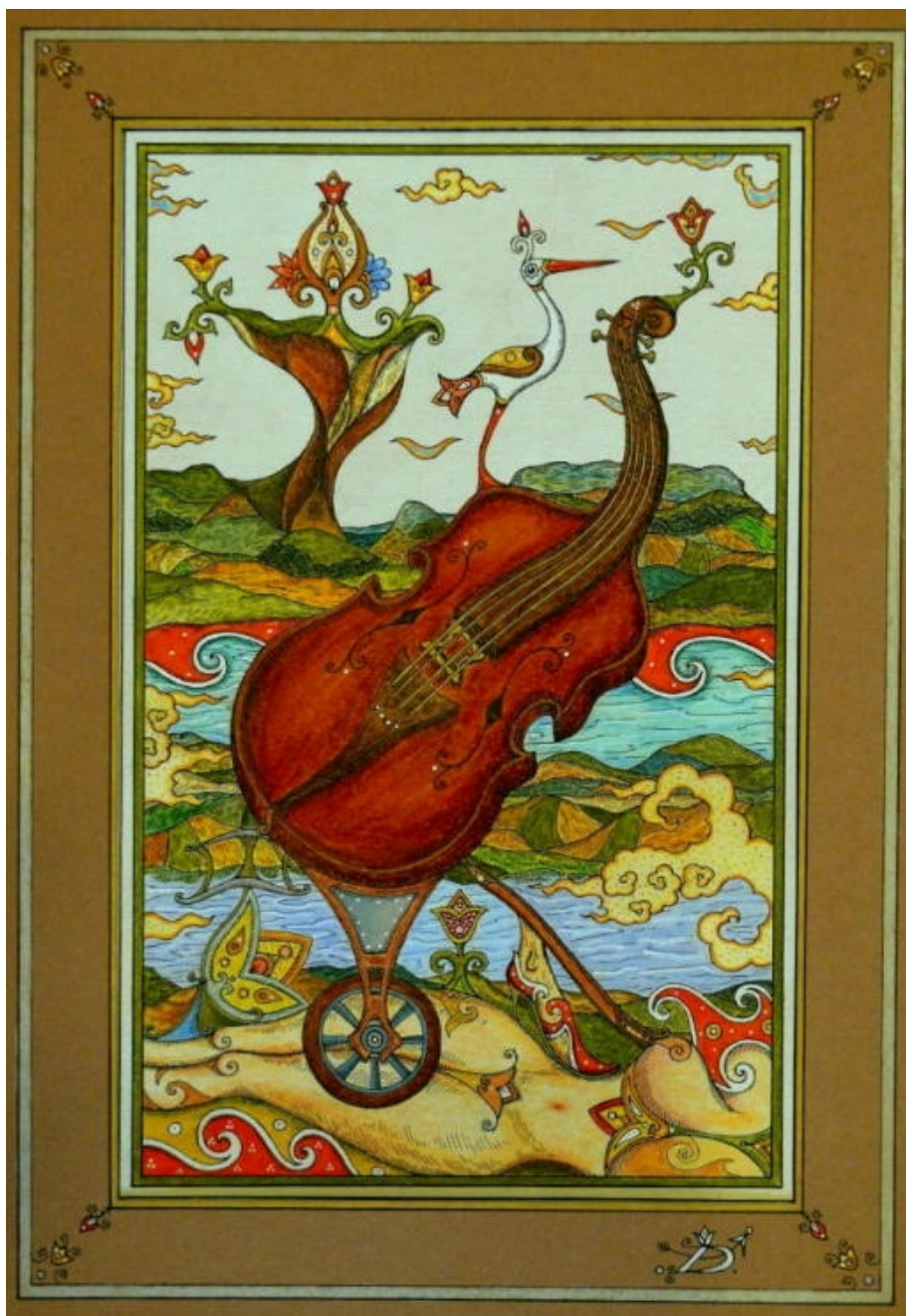
Darvas Iván: Balatoni hangulat