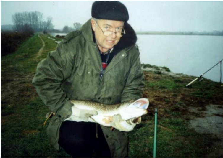
Életem nagy szenvedélye, a horgászat (Rinyaszentkirály, 2006)