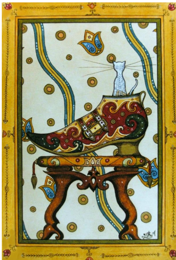
Darvas Iván: A Macska új cipője