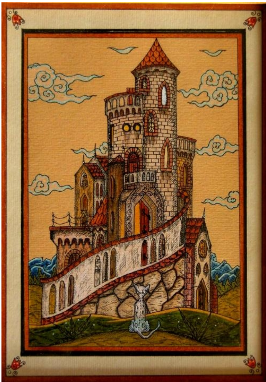
Darvas Iván: Macska-vár