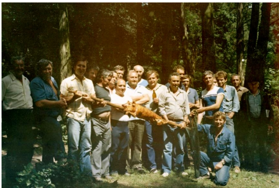
TVIN-es horvát barátainkkal Ribhak-ban (1990)