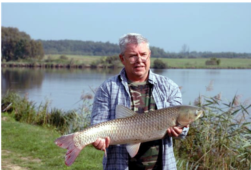
Teljesült a régi álom, íme a kapitális amúr!