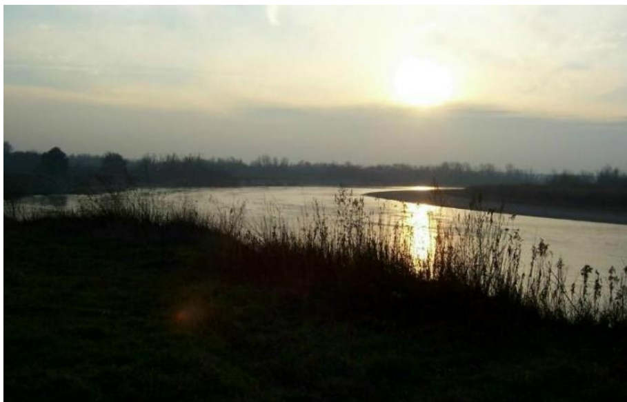
A Dráva a babócsai magaspartnál