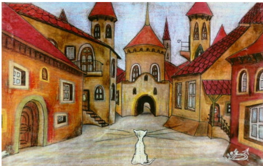
Darvas Iván: Macska a kapuk előtt