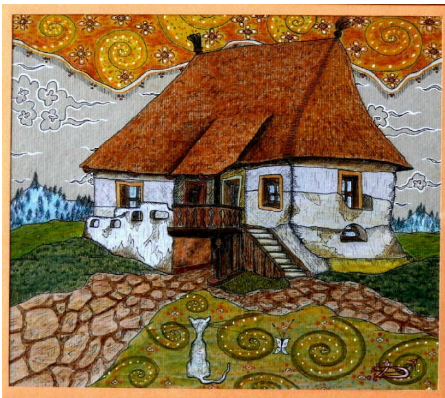
Darvas Iván: Boldogság I.