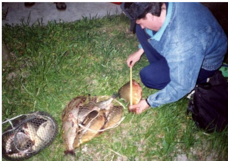
Frici a zsákmányt méricskéli

Mi is felcihelődtünk és kipróbáltuk, igazat mond-e? Valóban az egész éjszakai vihar, hullámozás, a bakonyi főszeél átverte a halakat a déli part felé, és a partszeélben kifáradt, hatalmas lapátos dévérek fáradtan, éhesen keresgéltek a partszeeli kövezés előtt. Itt is jól beetettünk. Meg is lett az eredménye. Magam részéről megpróbáltam a piros kukac alá egy csemegekukoricát is feltűzni, majd a horog hegyét is egy szem csemegekukoricával takartam el. Jóképu szendvics lett belőle. Az erős hullámozás miatt két kapásjelző karikát kellett felszerelni. Jól eloszlottunk a boglári szabad strand partján, ahol ötünkön kívül senki sem volt. Mögöttünk hatalmas platánfák nyújtottak némi védelmet a szemerkélő eső ellen. Mindegyikünk igyekezett gyarapítani a közös zsákmányt. A haltartóba hamarosam méretes tükrös pontyok is kerültek. Olyan mohón kaptak a halak, hogy nemegyszer mindkét horgon keszegek rugdalóztak, amikor kihúztuk a szereléseket a vízből.