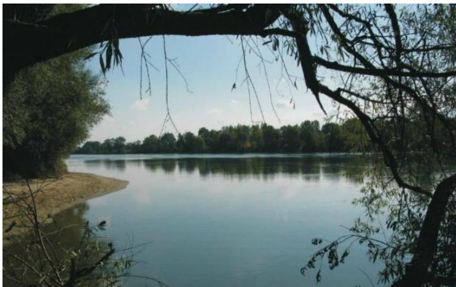
A Dráva Barcsnál

Hazafelé jövet vidám volt a hangulat. Mindenki az élményeit mesélte, hogy miként kerültek horogra a csukák. Észrevétlenül értünk a patakhoz. Először Apósom ment át a maga bizonytalan módján, majd Miska, utána Bütyök egyensúlyozott havas csizmájában a farönkön, kezében haltartó szákja, botjai. Végül én következtem. A gerenda már jó síkos volt, én meg vigyázatlan. A sok szereléssel a kezemben addig kapálóztam, míg sikerült a vízbe csúsznom. A jéghideg decemberi patakvíz befolyt a csizmámba. Egy pillanatra megmerevedtem, majd kitört a nevetés. Kikászálódtam a vízből, kiöntöttem csizmámból a vizet és futás a Moszkvicsig. A kocsiban dideregtem, de a hangulat az továbbra is meleg maradt.