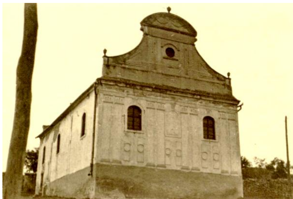
A zsinagóga a háború után