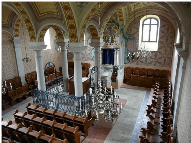
A zsinagóga belülről

http://www.jmpoint.hu/modules.php?name=News&file=article&sid=419 )