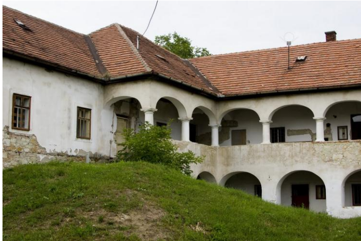
A volt rabbi képző és jesiva