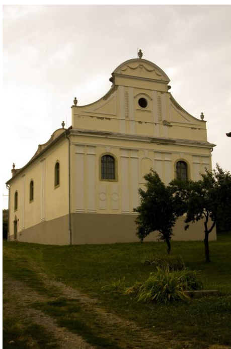
A felújított zsinagóga