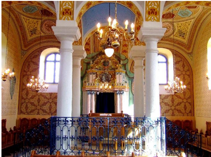
A zsinagóga belülről