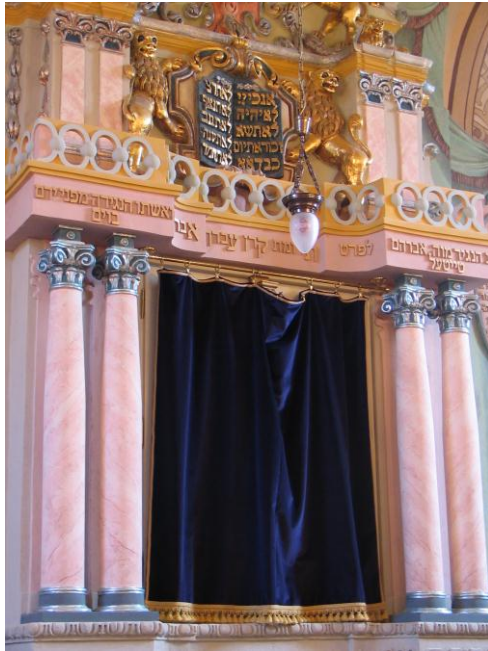
A Tóra szekrény