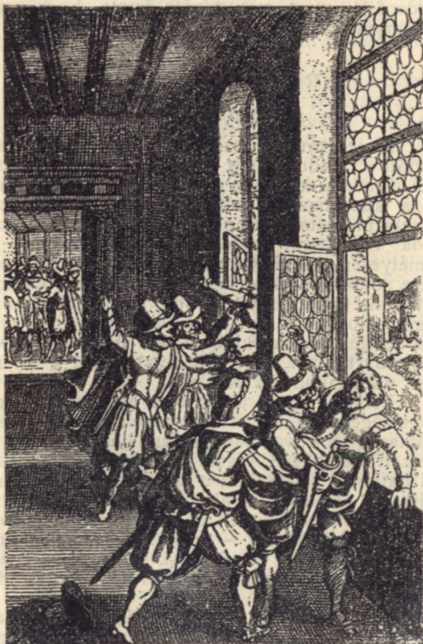
SLAVATA ÉS MARTINITZ KIDOBATÁSA.