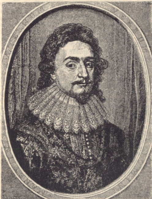
FRIGYES, PFALZI VÁLASZTÓ.

a hidtól, Bethlen „a bécsi hidak előtt“ való harcznak csak harmadik napján érkezett szövetségesei