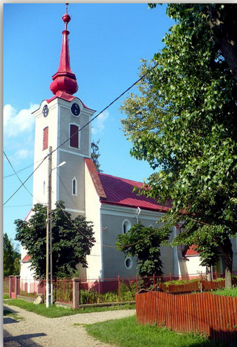
A református templom