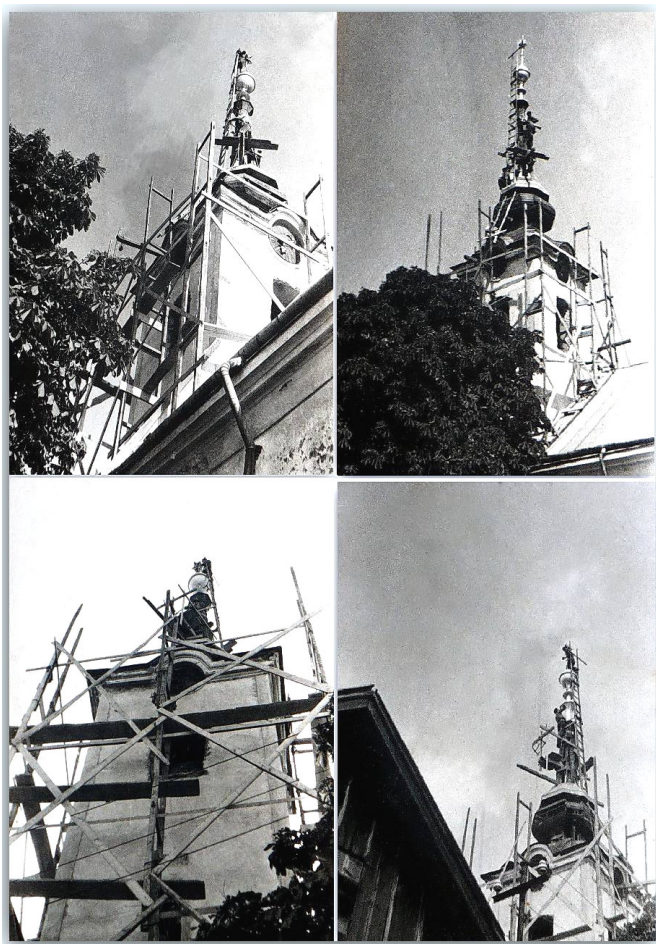
A csatári templom külső renoválása (1971)