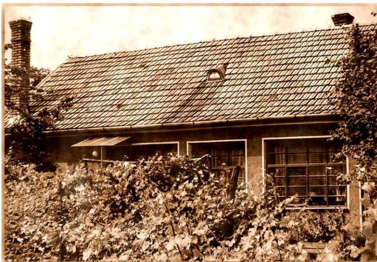
A Hegy Köz Csatári református parókia épülete