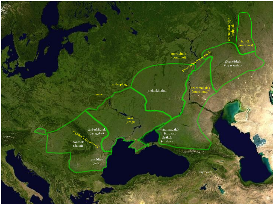
1. ábra. Délkelet- és Kelet-Európa pusztai népeinek szálláshelye az i. e. 5. században (A térkép a Wikimedia Commons: Europe satellite orthographic.jpg nevű állomány származéka. A vonalas rajz és a szöveg eredeti)