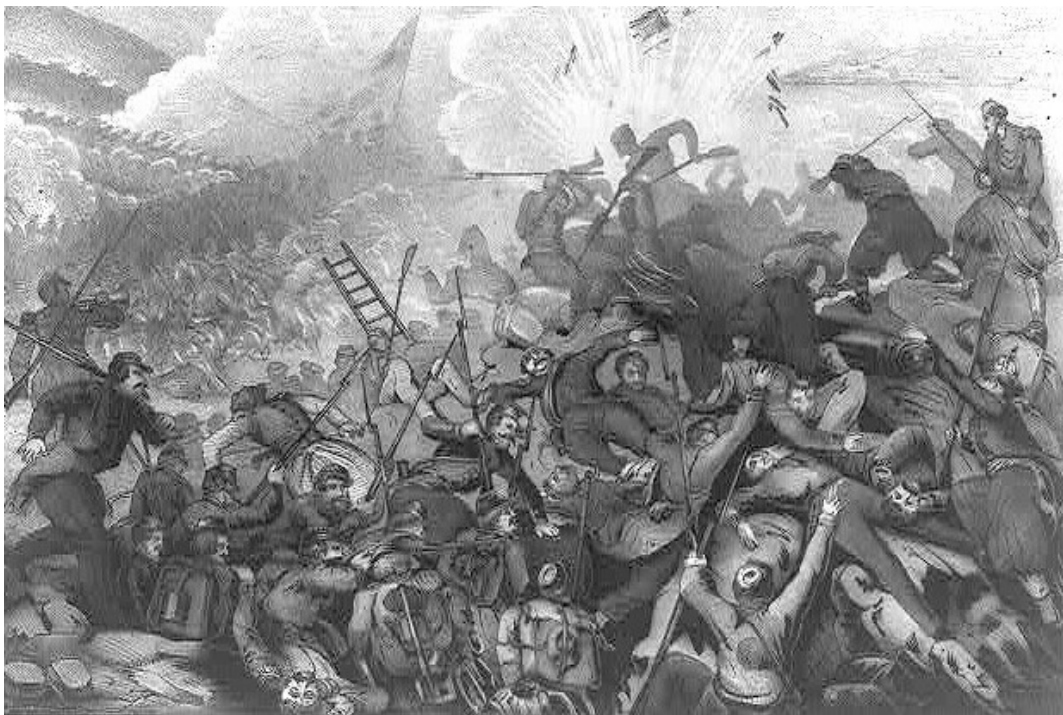
Szevasztopol eleste

A háború jellegére jól utal a fenti kép. Öldöklés folyt, mint általában szokott. Az oroszok erejük teljében érezték magukat, és megfájdult a foguk régi álmukra, a fekete-tengeri tengerszorosokra. Súlyosan tévedtek azonban, az Oszmán Birodalom nem maradt egyedül. Az orosz előretörés nem tetszett a nagyhatalmaknak, a britek és franciák is mellé álltak. Bár az angol és francia katonák is sokat szenvedtek, a tengeri csatákban jobbnak bizonyultak, mint saját birodalmában az elavult cári rendszer. Közel félmillió áldozata volt a háborúnak, nagyrészüket a járvány, az éhínség és a hideg ragadta el.