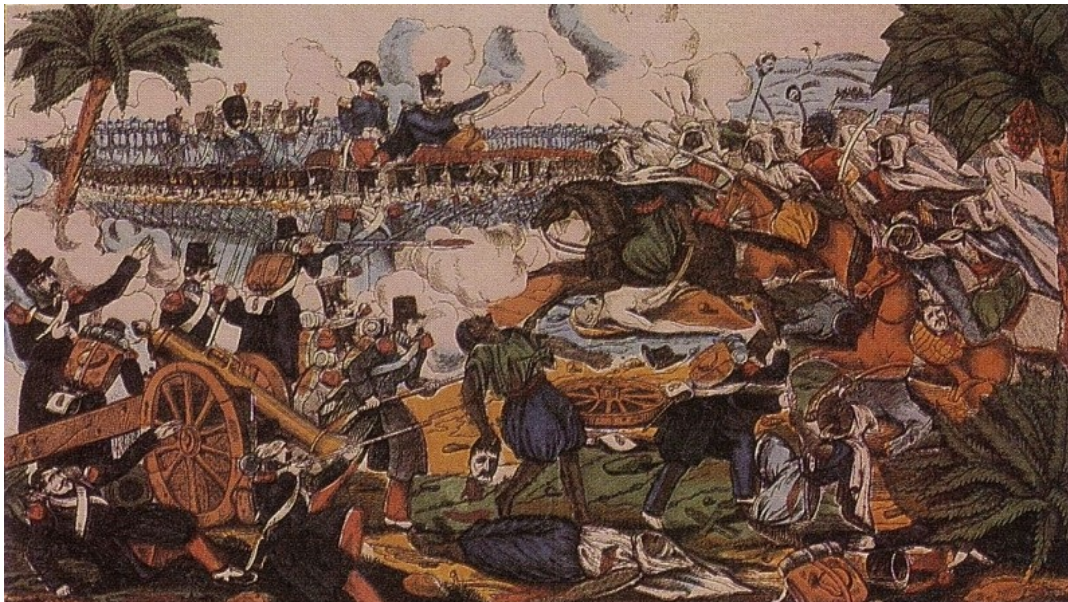
Algéria leigázása (Wikipedia)

Elég talán egyetlen csataképet bemutatni, hogy betekintést nyerjünk, milyen barbár módon verték le a helyieket a franciák, és milyen komoly ellenállással találták szembe magukat.