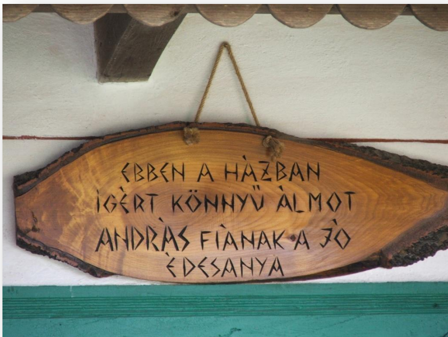
Sütő András szülőháza Pusztakamaráson

Sütő András, Wass Albert, Makkai Sándor, Bánffy Miklós és Horváth István emlékével találkoztunk.