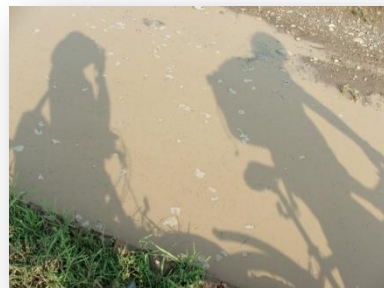
Sár és szúnyogok