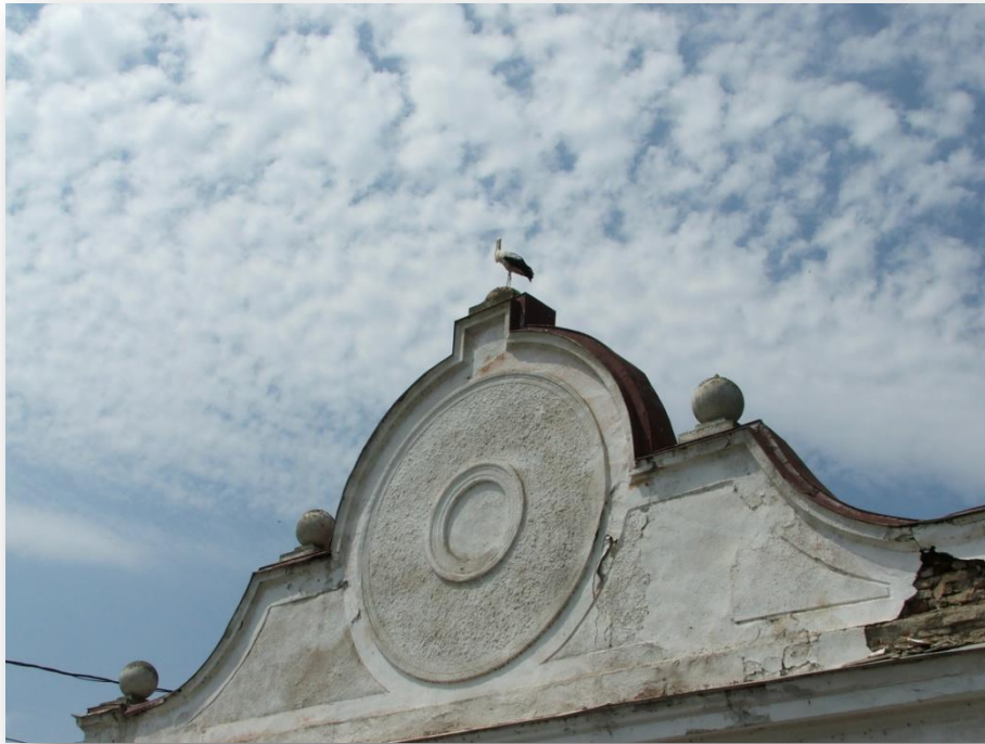
„Használatba vett” Teleki kastély Marossárpatakon