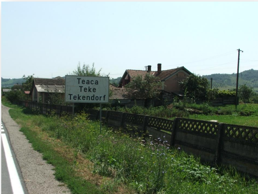
A multikulturalitás nyomai

Magyarok a Mezőség északi és délkeleti részén (Marosvásárhely és Szászrégen környékén) laknak nagyobb számban. A szászok túlnyomó többsége a Beszterce-környéki falvakban, a Mezőség északkeleti részén élt.