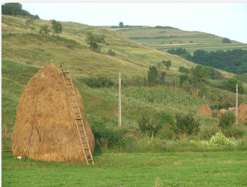
Jellegzetes mezősegi kép