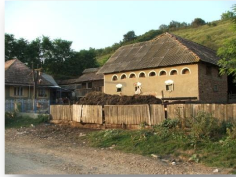
Jellegzetes mezőszégi gazdasági épület