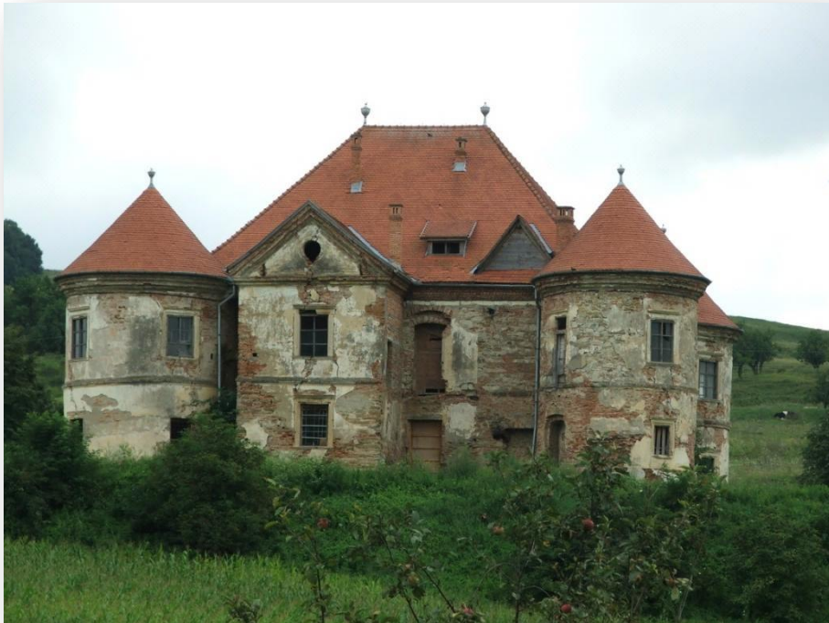
A magyarózdai Pekry-Radák kastély - a Bonus Pastor Alapítvány gondozásában - még reménykedik