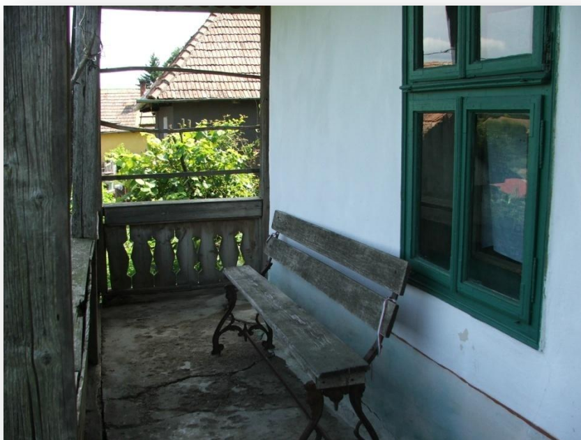
Tornácos parasztház Pusztakamaráson

Igen régies és nagyon gazdag paraszti művészet tárult fel a néprajz kutatói előtt, egy sajátos „mezősségi” paraszti életmódnak és kultúrának az őrzője, ennek oka főként az, hogy a Mezőség fejlődése, talán elzártságának köszönhetően is környezeténél lassúbb volt.