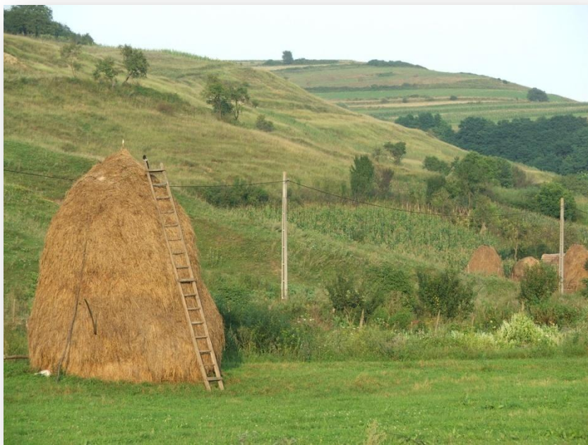
Jellegzetes mezősségi kép