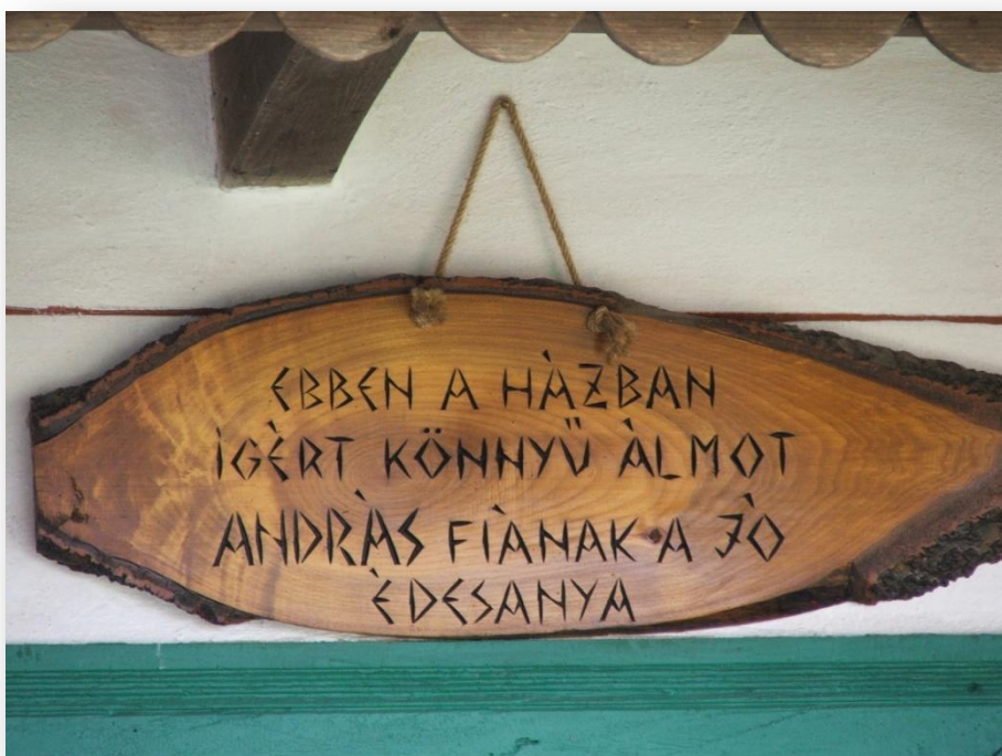
Sütő András szülőháza Pusztakamaráson