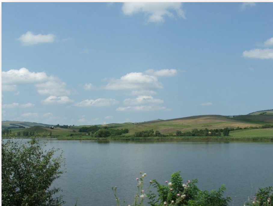
Egy tó a sok közül

A mezősegi tájat a tavak jellemzik, ezek egykor nagyrészt mocsaras területek voltak, amelyeket a 19-20. századi vízszabályozások során rendeztek és általában halastóként hasznosítottak.