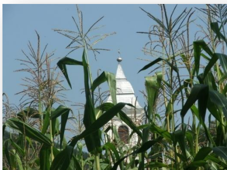
Kukoricás a faluban

Napjainkra ezt a jelentőségét nehezen művelhető agyagos talaja, nagyrészt domboldalakon elterülő szántóföldjei miatt csaknem teljesen elvesztette, habár a lakosság jelentős része ma is mezőgazdaságból él.