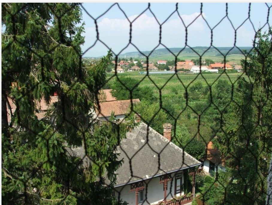
Mezőség nehezen behatárolható

„Látható határvonalai vannak a Mezőségnek. Ahol megkopároznak a hegyek, az ormok, hol sárgák az agyagtól, dombok hol vetés nélkül, bokor nélkül, szakadékok tátongva, szép teknyők, oldalak, drága földek vetés nélkül – az utas azt mondja: ez a mezőség, itt kezdődik. Ezt nem lehet mappán rajzolni. Az utas rájön magától.”( Petelei István: Mezőségi út, Uti jegyzetek)