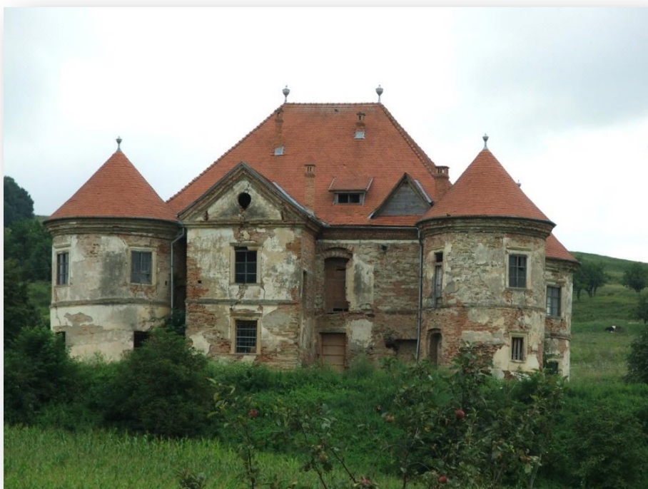
A magyaróvázi Pekry-Radák kastély - a Bonus Pastor Alapítvány gondozásában - még reménykedik