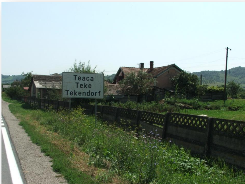
A multikulturalitás nyomai

Magyarok a Mezőség északi és délkeleti részén (Marosvásárhely és Szászrégen környékén) laknak nagyobb számban. A szászok túlnyomó többsége a Beszterce-környéki falvakban, a Mezőség északkeleti részén élt.