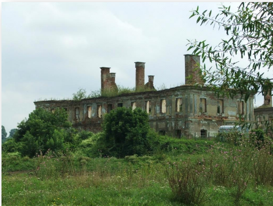
A kerelőszentpáli Haller kastélyra az enyészet vár