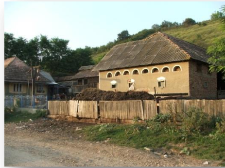
Jellegzetes mezőszégi gazdasági épület