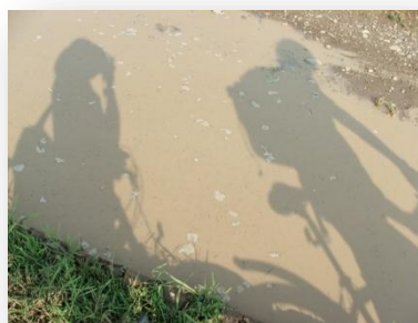
Sár és szúnyogok