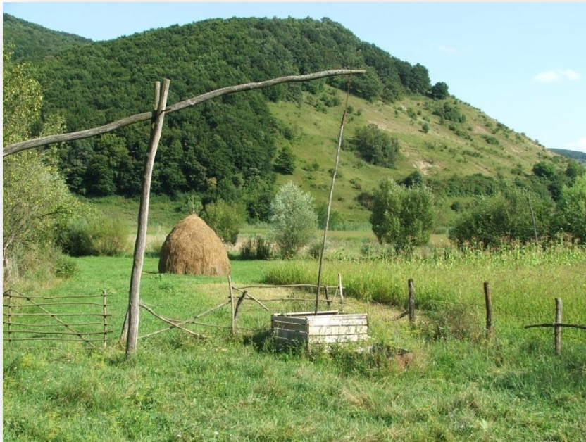
„Gémeskutak és szénabuglyák vidéke”