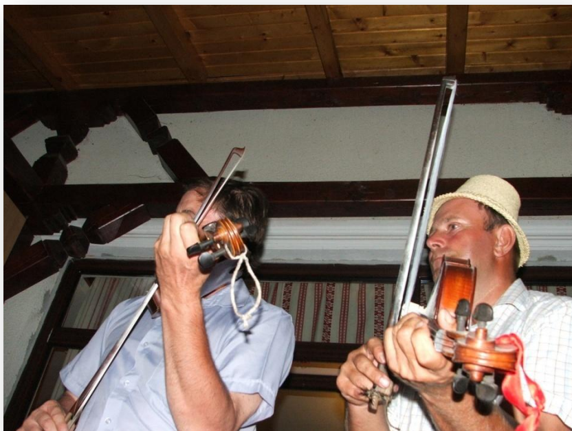
Széki zenészek „munkában”

Mezőség régies, de gazdag és fejlett tánc- és zenekultúrája több tényező együtt hatásának köszönhető. Ez a közép-erdélyi tájegység őrzött meg a legtöbbet az erdélyi reneszánsz és barokk örökségéből, s ezt fejlesztve alakította ki a sajátos újabb erdélyi tánc- és zenestílust. A magyar, román, cigány és szász kultúra összefonódása, kölcsönhatása itt fokozta a legmagasabbra az erdélyi tánc- és zenekincs gazdagságát. A táncok és a táncdalok állandó cseréje következtében a Mezőségen teljesen összemosódnak a magyar és román jellegzetességek határai, s valódi zenei és táncbéli kétnyelvűség érvényesül.