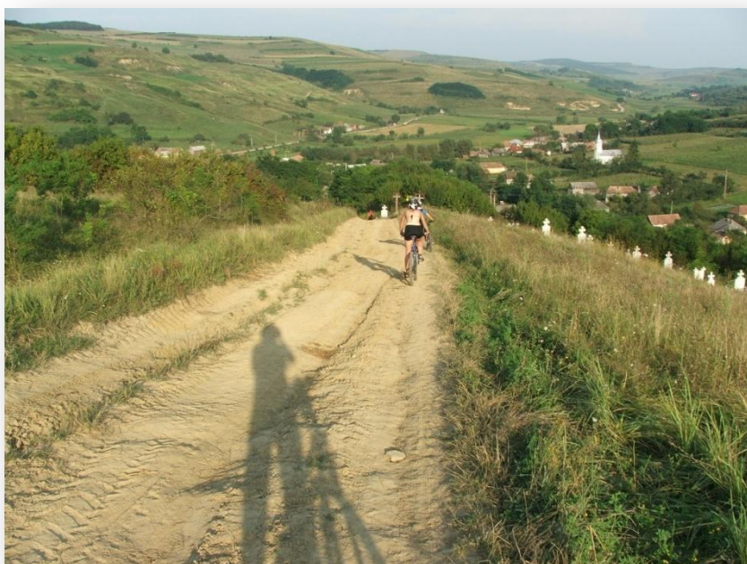
Biciklivel bármi megközelíthető