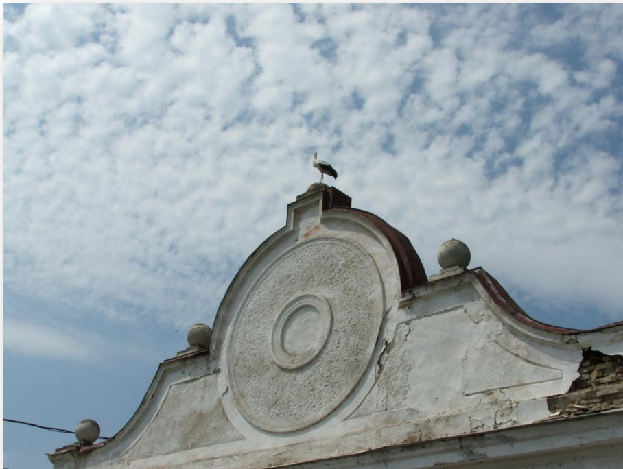
„Használatba vett” Teleki kastély Marossárpatakon