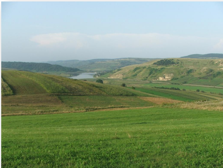
Jellegzetes mezőségi táj

A Mezőség, mint neve is mutatja, ősi erdeitől már századokkal ezelőtt megkoppasztott vidék. Egykori erdei helyén jórészt legelők keletkeztek, csak itt-ott maradt fent egy-egy tölgyes, cseres és gyertyános erdőfolt.