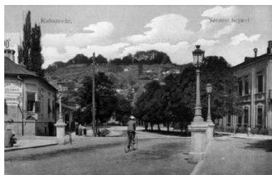
Kolozsvár, a Sétatér bejárata, 1900. körül