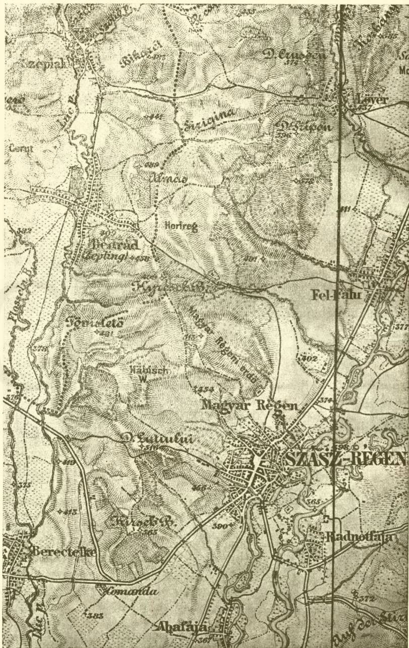
4. A szászrégeni ütközet színhelye. (1 : 75,000).