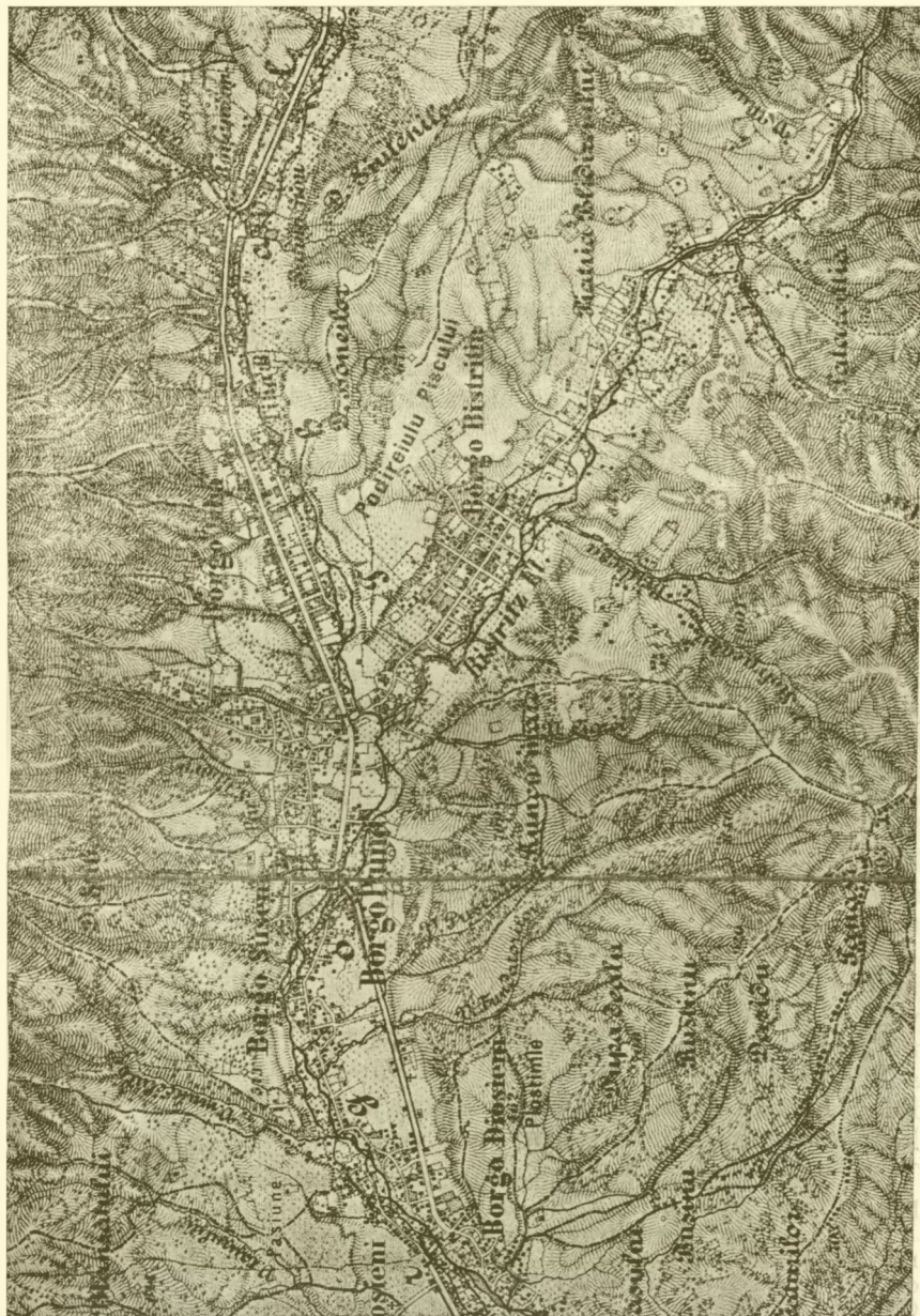
2. A borgótíhai és a borgóprundi ütközet színhelye. (1 : 75,000).