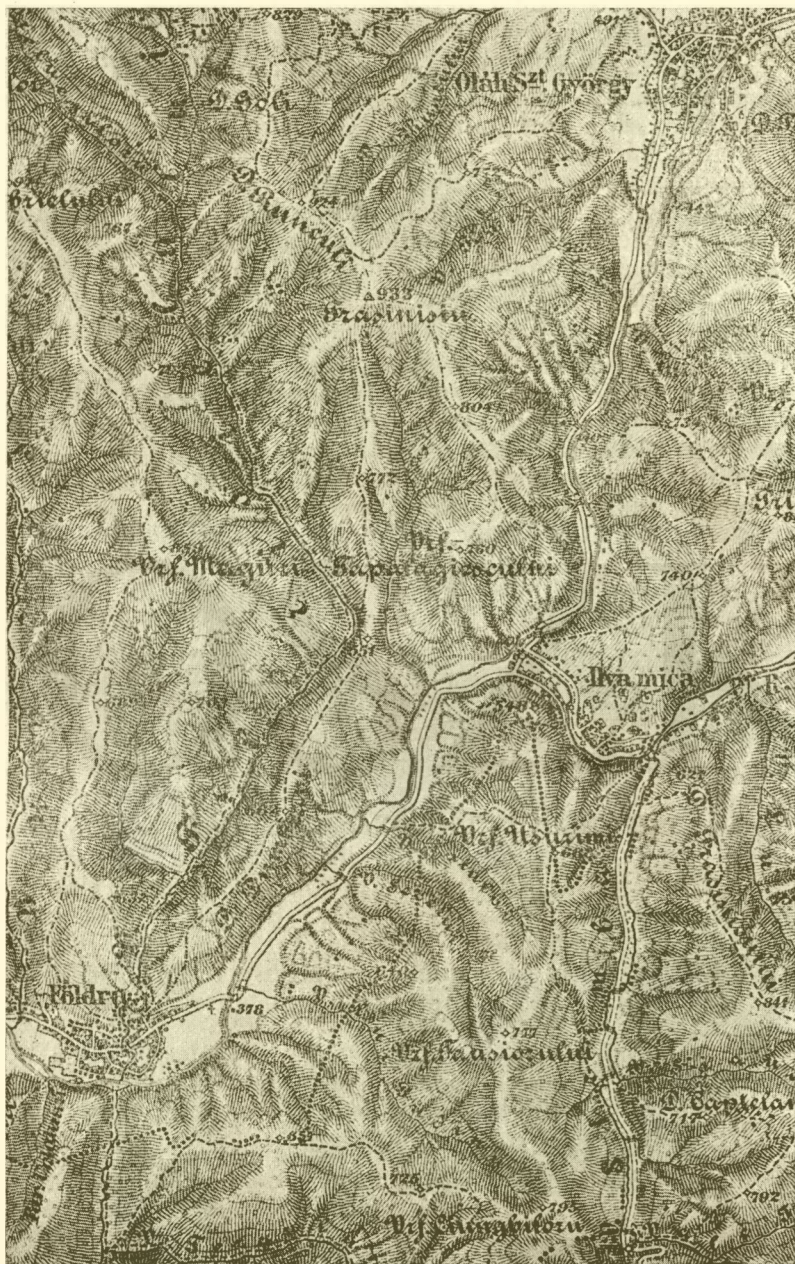
3. A Kisilva és Földra közötti ütközet színhelye (1 : 75.000).