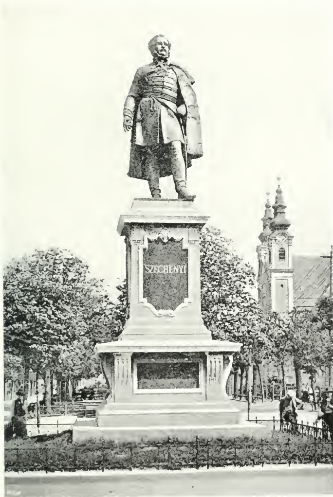
A SZÉCHENYI-szobor Sopronban.