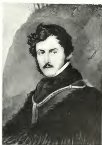
GRÓF ANDRÁSSY GYÖRGY