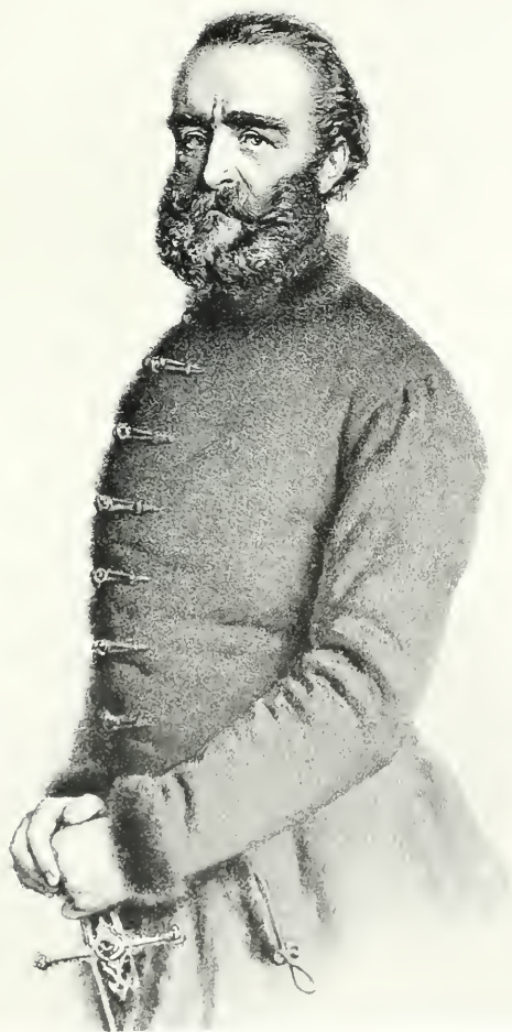
SZÉCHÉNYI ISTVÁN GRÓF arcképe (Döbling).