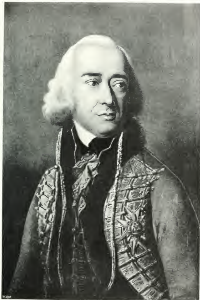
SZECHENYI FERENCZ GYOF.