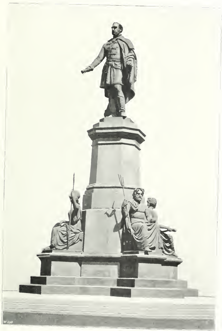
SZECHENYI budapesti szobra.