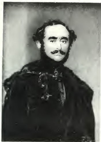
SZECHENYI ISTVÁN GRÓF