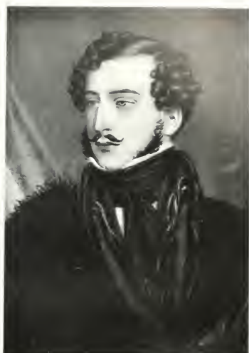
GRÓF KAROLYI GYÖRGY