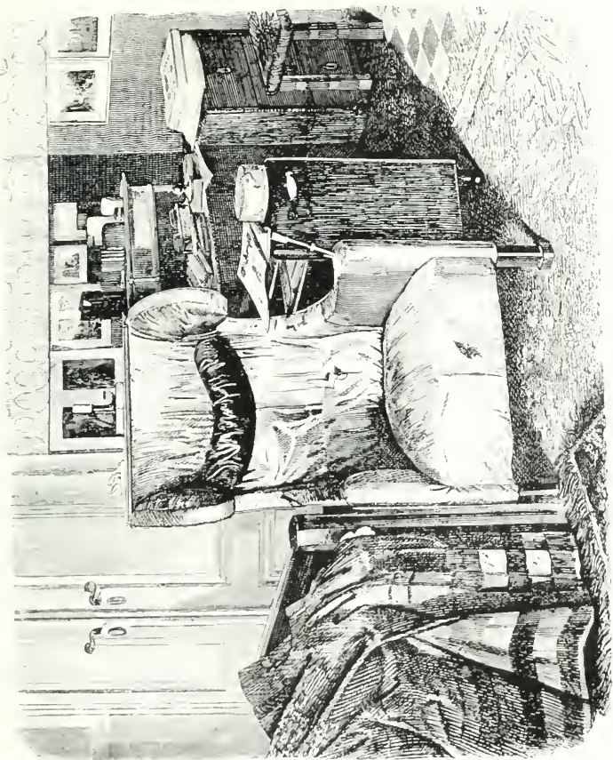
Széchenyi karosszéke, melyben végzetes tettet elkövette