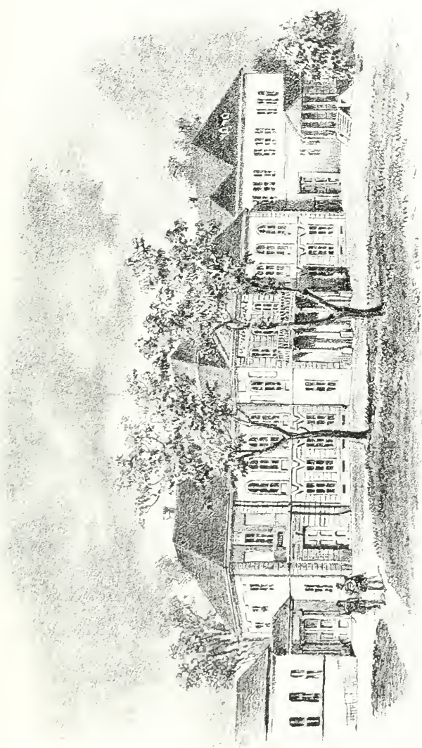
A czenki kastély.