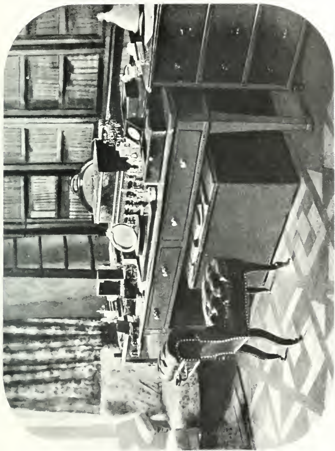
Száma XVI. dolgozószobája (Dobling).