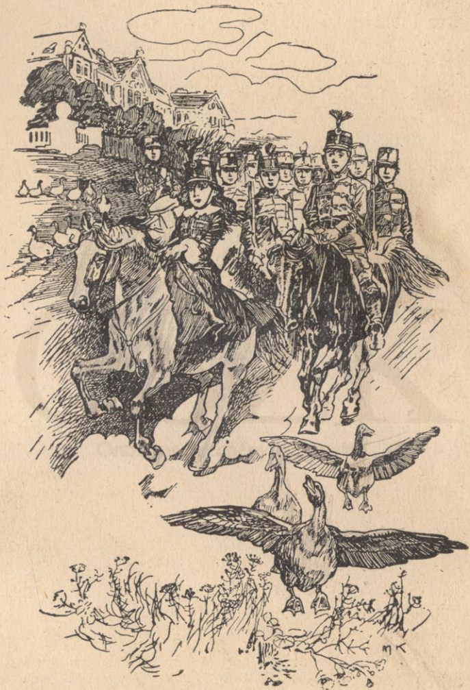
A leány regimentje.