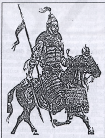
Baján, avar nagykirály (kagán) nehéz lovasa.

son elnök ezt mondta szó szerint: „Az a véleményem, hogy a magyar népet ki kell irtani. Egyébként még hozzáfűzöm, hogy az, hogy a magyar nép ezer éve birtokolja a Kárpát-medencét, nem jogalap, mert jogtalan volt a birtoklása.” Tetszenek érteni? Nem érv, mert jogtalan volt, mondta ezt az Egyesült Államok Elnöke, aki Lloyd George-val, Clemenceau-val, Orlando-val együtt a történelmi Magyarország feldarabolásának a fő előidézője volt. Ebbe kapaszkodni kéne, ebbe a „jogtalanba”, mert tulajdonképpen a magyar őstörténet, a magyarság múltja is ezen fordul meg igazából. Mái is ezt halljuk. Ezt hallottuk ezereszt éven keresztül. Csak hogy ma volt a kérdésfeltevés háttere! A honalapítást a XVI. század végéig ez a kérdés csak a pusztába kiáltott szó volt, mert a Magyar Királyság erős állama volt Eu-