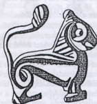
A jagar, amelynek kristálygömbjét ez a vésett oroszán díszíti, lehetett a hont felszabadító Árpádé

Kündének is. Ez lehetett a két honfoglalást összekapcsoló közös, befejező esemény, amelyre 903-ban, vagy 904-ben került sor. Ungvár a Verecei hágón való átkelés utáni pihenő helye, ahonnan Árpád 903-ban indult el. Az óbudai ünnepség pedig a honfoglalást lezáró események egyike, amelyet Kurszán más forrásból ismert időpontban bekövetkezett halála miatt nem tehetünk későbbre 904-nél. Árpád tehát igen gyorsan (esetleg néhány hónap alatt) eljutott Ungvárról Óbudára, a honfoglalás „kezdetétől” a befejezésig. Aligha hihetjük, hogy Árpád seregei a Kárpát-medencét e rövid idő alatt egyedül hódították és szállták meg. Ezért a honfoglaló harcok Anonymusnál olvasható leírásai legalább részben Kurszán és más vezérek megelőző hadjáratait örökítik meg.