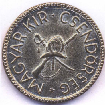
A Csendőr Emlékérme hátlapja