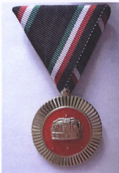
A Csendőr Emlékérem előlapja