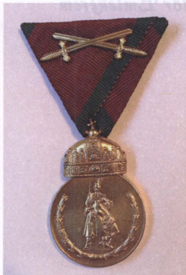
A Jubileumi Csendőr Emlékérem előlapja