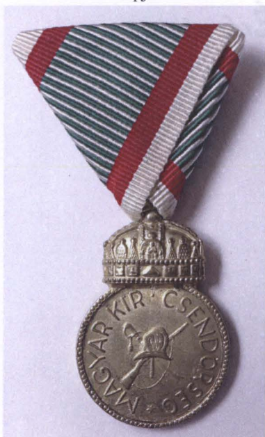
A Csendőr Érdemérem előlapja