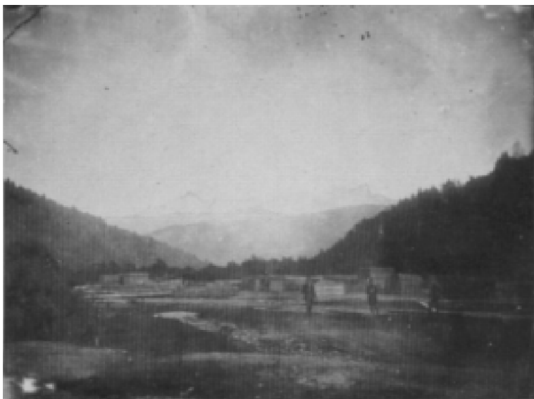
3. ábra Rakpart a tölgyesi vámon alul (Orbán Balázs összes fényképe a Székelyföldről, Budapest, 1993, 131.)