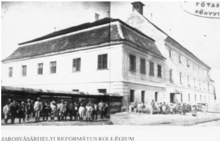
6. ábra A marosvásárhelyi református kollégium épülete, ahogy azt Orbán Balázs láthatta (Orbán Balázs összes fényképe a Székelyföldről, Budapest, 1993, 145.)

135. oldal, 1. hasáb, utolsó sor – 2. hasáb, első sor: ... a vásárhelyi iskola tanoncainak növelésére. A nagy Bocskai István végrendeletében a marosvásárhelyi scholának 3000 forintot, hagyományozott. Bethlen Gábor 200 forintot ... 399