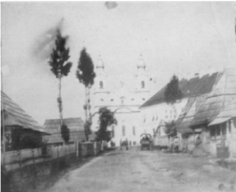
1. ábra A csíksomlyói templom (Orbán Balázs összes fényképe a Székelyföldről, Budapest, 1993, 129.)

22. oldal, 2. hasáb, 1) jegyzet, utolsó két sor: ... az 1333. év rovatában 682. lapon, Dolna néven.. Mint fennebb látók, 1570-ben János Zsigmond ad Balázs Pálnak új donatiót delnei jószágára.