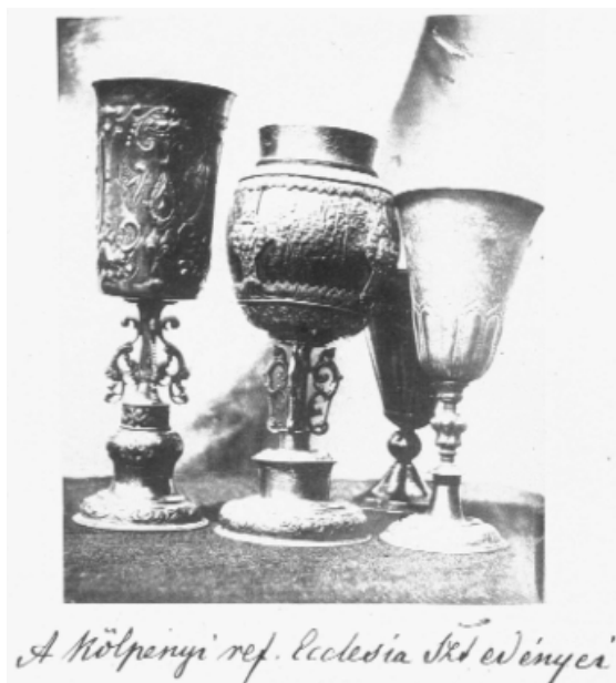
7. ábra A kölpényi református egyház kelyhei (Orbán Balázs összes fényképe a Székelyföldről, Budapest, 1993, 146.)