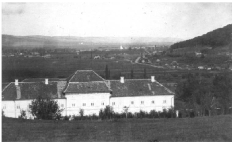
A Nyárad völgye Teremitél nézve.

(Hatvanhét sor a hozzátartozó hét jegyzettel kimarad, illetve átírva, folytatás a 46. oldalon, a 2. hasáb 18. sorában.)